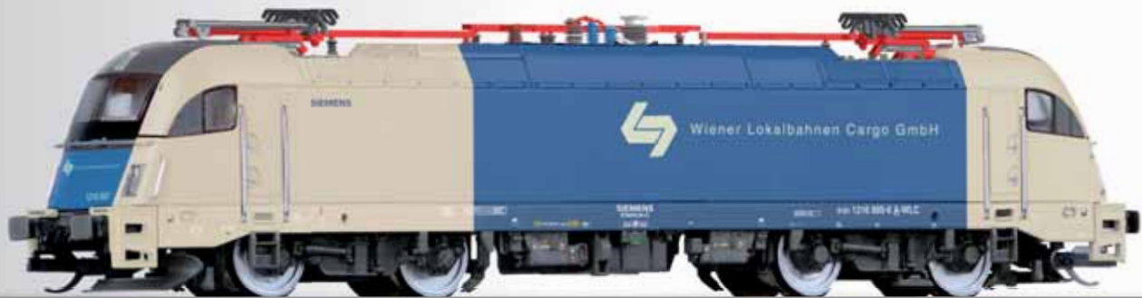
Elektr.lokomotive 1216 950 der WLC (Wiener Lokalbahnen Cargo GmbH) Electric locomotive 1216 950 of the WLC (Wiener Lokalbahnen Cargo GmbH)