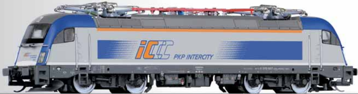
Elektr.lokomotive Reihe 370 der PKP Intercity Electric locomotive class 370 of the PKP Intercity