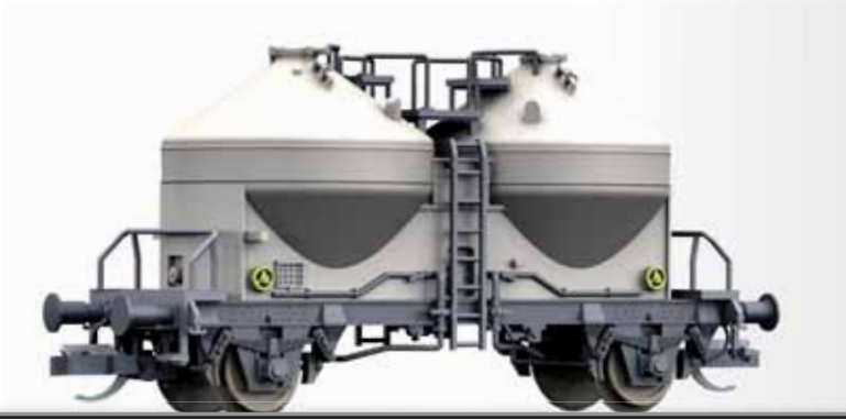
FORMNEUHEIT/NEW: Staubsilowagen Ucs 908 der DB Silo car Ucs 908 of the DB