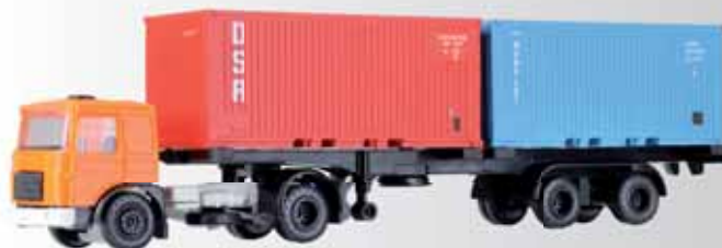
LKW Roman mit Containeraufleger beladen mit zwei Containern / Truck Roman with semi-trailer loaded with two containers