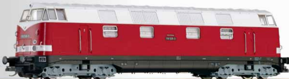
Diesellokomotive BR 118 B'B' der DR Diesel locomotive class 118 B'B' of the DR