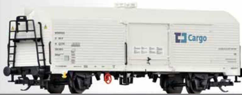
Kühlwagen Ibbhs „CD Cargo“ Refrigerator car Ibbhs of the CD Cargo