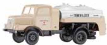
LKW H3A Tankwagen „DRK“ Tank truck H3A „DRK“