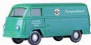
Matador Kastenwagen „DEA Pumpendienst“ / Matador van „DEA Pumpendienst“