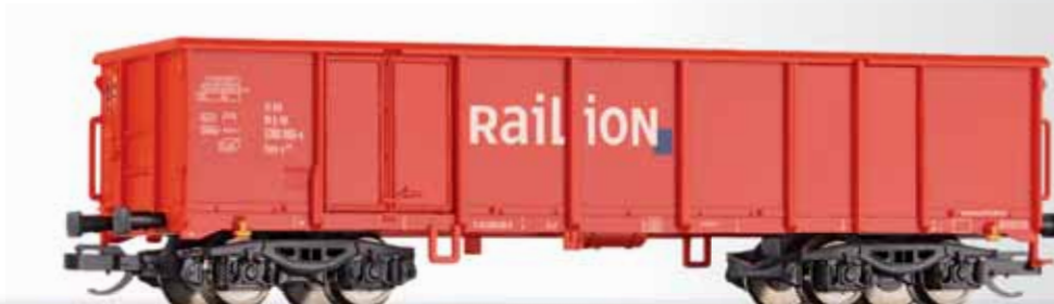
Offener Güterwagen Eaos-x 075 der DB AG Open freight car Eaos-x 075 of the DB AG

Voraussichtlich Ende 2012 als 3er Sets erhältlich: Art. 01607 – Bauart Zkz der DR, Art. 01608 – Bauart Ucs 909 der DB und Art. 01609 Bauart Ucs 909 der MEG. / expected at the end of 2012 there will be sets with three silo cars available: item-no. 01607 type Zkz of the DR, item-no. 01608 type Ucs 909 of the DB and item-no. 01609 type Ucs 909 of the MEG.