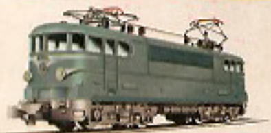
01005 Elektrische Schnellzuglok, grün/blau 44,—