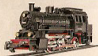
01001 C-Tenderlok 26,—