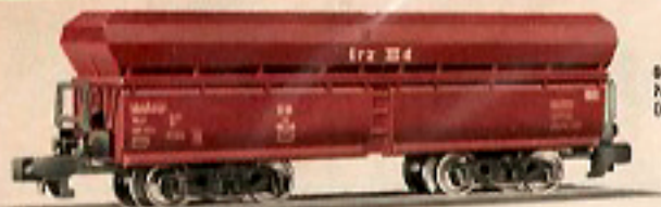
00514 Großraumgüterwagen, 4-achsiger; Modell der Deutschen Bundesbahn 00tz 50 DM 8,-