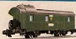
01201 Packwagen 5,—