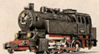
01004 C-Tenderlok, blau 22,—