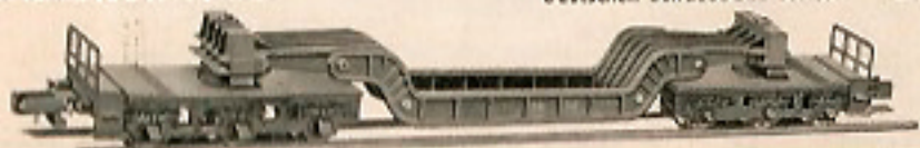
00520 Tieflader, 6-achsiger; Modell der Deutschen Bundesbahn SS1 53 DM 8,-