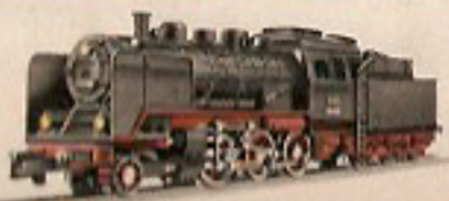
01141 Personenzuglok mit Tender 39,50