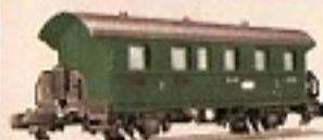
01200 Personenwagen 5,—