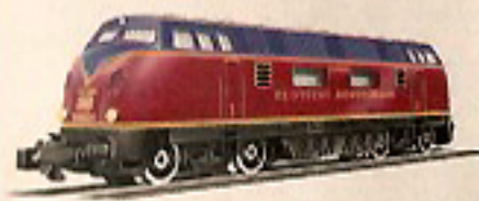
01002 Diesel-Lokomotive 40,—

Weitere Zugpackungen, Triebfahrzeuge und Wagen finden Sie in unserem Katalog!