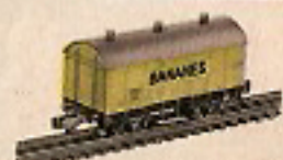
00244 Güterwagen „Bananes“ 5,50