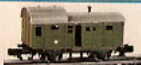
00235 Güterzug-Gepäckwagen (DB/Pwg) mit Schiebetüren 5,50