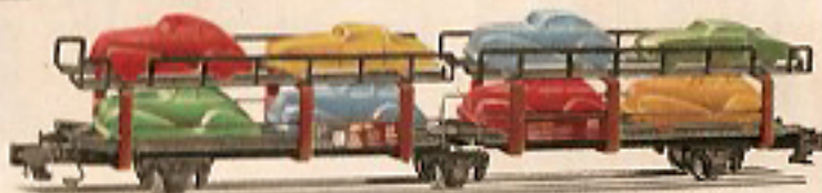
00515 Astrotransport- wagen mit 8 Autos beladen, 3-achsiger; Modell der Deutsch- Bundesbahn Offiz 55 DM 10,-