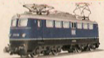
01006 Elektrische Schnellzuglok, blau 44,—