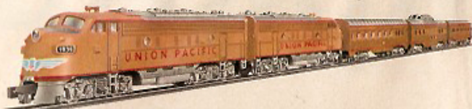
01141 Amerikanische „UNION-PACIFIC-RAILROAD“-Packung 120,— Diese Zugpackung enthält: 1 Doppel-Lokomotive, 1 beleuchtete D-Zug-Wagen, 17 Gleise (Gleiseval) und 1 Fahrpult.

Weitere Zugpackungen, Triebfahrzeuge und Wagen finden Sie in unserem Katalog!