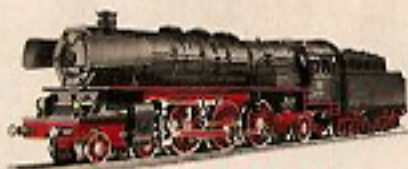
01003 Schnellzuglok mit Tender 34,—