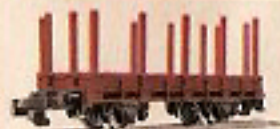
00245 Ringenwagen 4,—