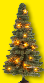
Beleuchtete Weihnachtsbäume 0, H0, TT, N, Z