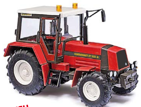
NEU HO 50408 Traktor Fortschritt ZT 323-A mit Winterblech, Rot