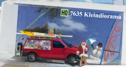
HO 7635 Kleindiorama