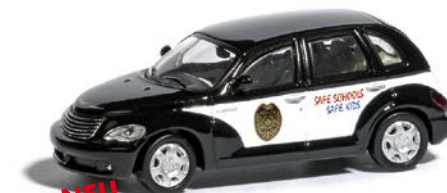
NEU HO 9838961 Chrysler PT Cruiser »School Resource Office Car«