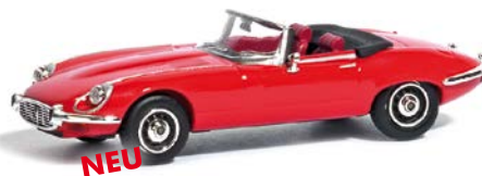
NEU HO 9838420 Jaguar E-Type Rot