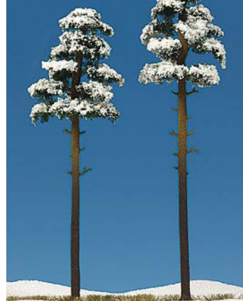
HO 6156 2 verschnittene Kiefern 195 und 210 mm hoch