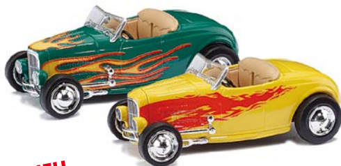
NEU HO 9838597 Ford Hot Rod Roadster sortiert in den Farben Gelb und Grün