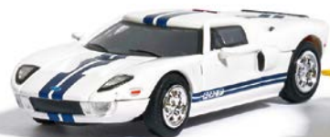
NEU HO 9838871 Ford GT sortiert in den Farben Weiß und Gelb