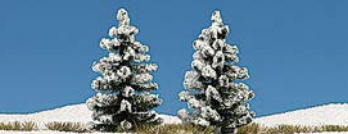
HO 6152 2 verschnittene Fichten 90 und 120 mm hoch