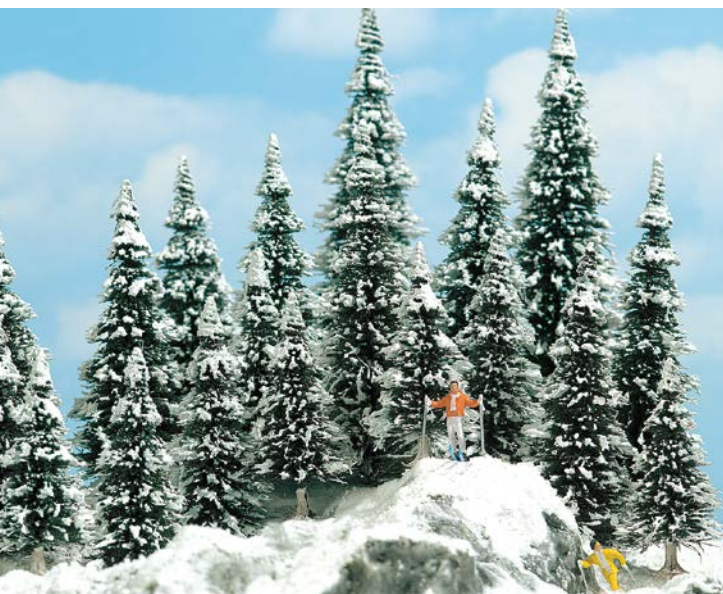
HO 6465 10 Schneetannen mit Zubehör

Inhalt: 10 weiße Wintertannen (Ī 60 - 135 mm), davon 1 Weihnachtsbaum mit bunten Kugeln sowie Vogelhaus, Schneemann und Schneepulver.