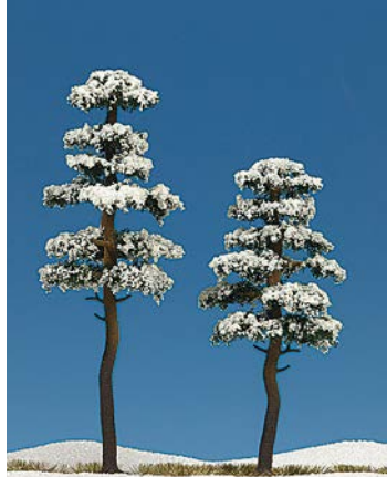
HO 6155 2 verschnittene Kiefern 130 und 160 mm hoch