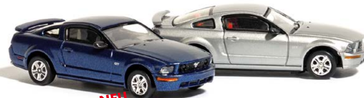
NEU HO 9838870 Ford Mustang GT sortiert in den Farben Blau und Silber