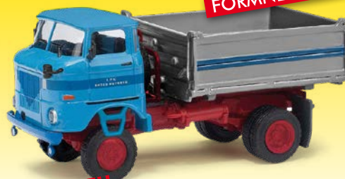
NEU HO 95130 IFA W50 2SK Zwei-Seiten-Kipper »LPG Roter Oktober«