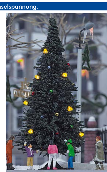
HO 5413 Weihnachtsbaum

Mit 7 Kerzendioden und Weihnachtskugeln. Ī 90 mm.