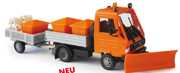
NEU HO 42217 Multicar »Winterdienst« mit Anhänger