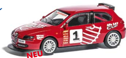
NEU HO 9838836 Alfa Romeo 147 »Cup Version 2001«