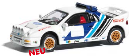
NEU HO 9838821 Ford RS200 »Rallyeversion«