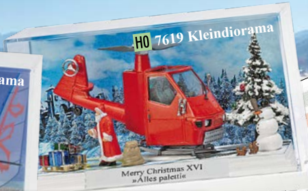
HO 7619 Kleindiorama