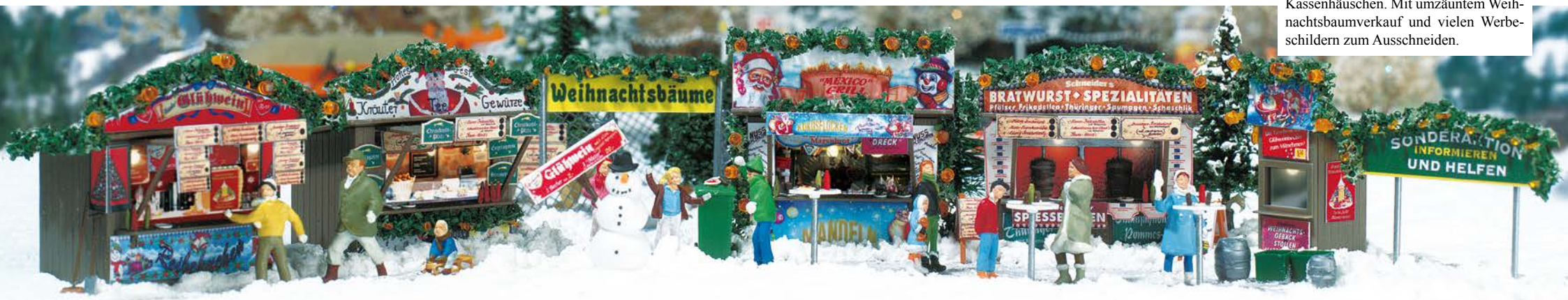
HO 1059 Weihnachtsmarkt Bausatz für einen kompletten Weihnachtsmarkt mit Verkaufsbuden und Kassenhäuschen. Mit umzäuntem Weihnachtsbaumverkauf und vielen Werbeschildern zum Ausschneiden.