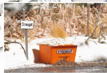
HO 1167 Ausstattungs-Set »Winter an der Straße« Alles für die »winterliche« Gestaltung von Straßen: Schneefangzäune in den Signalfarben Grün und Orange (jeweils 40 cm lang), zwölf Streugutbehälter für den Straßenrand, Schneemann sowie passende Hinweisschilder »Winterdienst« usw.