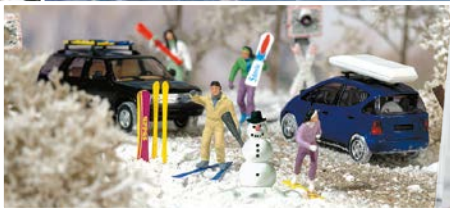
HO 6004 Winter-Set Snowboards, Carving-Ski, Dachträger und Dachbox. Mit Schneemann.