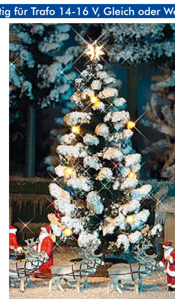
HO 5411 Weihnachtsbaum

Ī 90 mm. Mit 7 Kerzendioden, bunten Christbaumkugeln und Stern als Spitze.