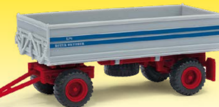
HO 95013 HW 80.11 »LPG Roter Oktober«