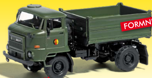
NEU HO 95515 IFA L60 2SK Zwei-Seiten-Kipper »NVA«