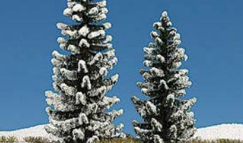
HO 6152 2 verschnittene Fichten 90 und 120 mm hoch