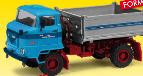
NEU HO 95513 IFA L60 2SK Zwei-Seiten-Kipper »LPG Roter Oktober«