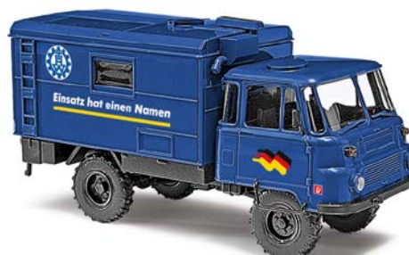
HO 50213 Robur LO 2002 A »THW«