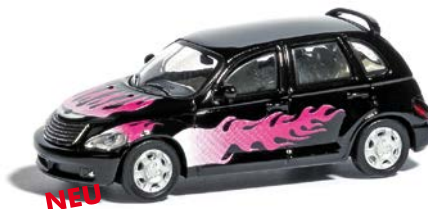
NEU HO 9838661 Chrysler PT Cruiser »Pink Flame«