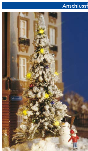
HO 5409 Weihnachtsbaum

Bausatz für 4 winterliche Laubbäume, jeweils ca. 165 mm hoch. Perfekt zum Einschneien mit Busch Schneepulver 7170 bzw. 7171.