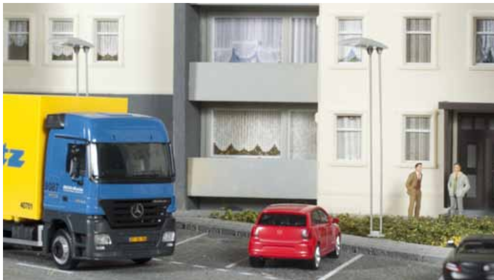
053532 Straßen- und Parkplatzleuchte großer Schirm, 11 x 8 mm (2 Stück) / Street and parking lot lights - big light fixture (2 pieces)