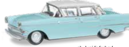
ab Juni lieferbar! delivery in June 2014 H0 1/87

024556-003 Opel Kapitän Farbneuheit: pastelltürkis / New colour: pastel turquoise