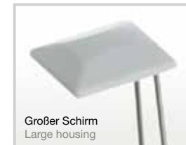
Großer Schirm Large housing