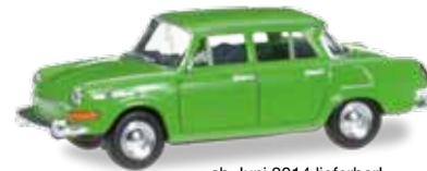
ab Juni 2014 lieferbar! delivery in June 2014 H0 1/87

024716-003 Skoda 1000 MB Farbneuheit: gelbgrün / New colour: yellow green