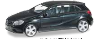
ab August 2014 lieferbar! delivery in August 2014 H0 1/87

038263-003 Mercedes-Benz A-Klasse Farbneuheit: blacksaphir metallic / New colour: blacksaphir metallic