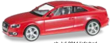
ab Juli 2014 lieferbar! delivery in July 2014 H0 1/87

023771-002 Audi A5 Coupé Farbneuheit: feuerrot / New colour: fire red