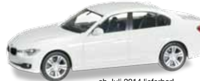
ab Juli 2014 lieferbar! delivery in July 2014 H0 1/87

024976-004 BMW 3er™ Limousine Farbneuheit: alpinweiß / New colour: alpin white