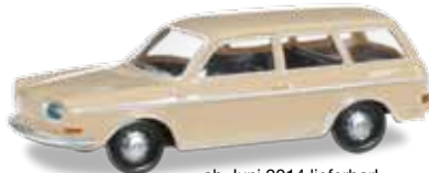
ab Juni 2014 lieferbar! delivery in June 2014 H0 1/87

024518-002 VW 411 Variant Farbneuheit: beige / New colour: beige