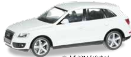
ab Juli 2014 lieferbar! delivery in July 2014 H0 1/87

024044-002 Audi Q5 Farbneuheit: reinweiß / New colour: pure white