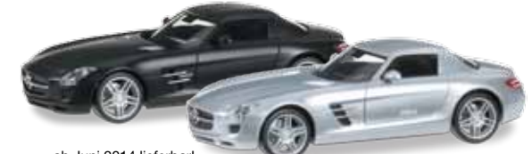
ab Juni 2014 lieferbar! delivery in June 2014 H0 1/87

024419-004 034418-004 Mercedes-Benz SLS AMG Farbneuheit: mattschwarz / New colour: matt black Farbneuheit: iridiumsilbermetallic / New colour: iridium silver metallic