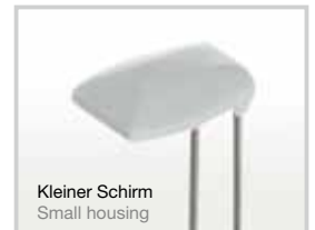
Kleiner Schirm Small housing