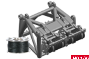
H0 1/87 9,50 € 053556 Zubehör Rollenpaket für 600 Tonnen Hakenflasche „Liebherr Raupenkran LR 1600/2“ / Accessories Roller Package for 8t hook block „Liebherr Raupenkran LR 1600/2“ Für den Einsatz der 600-Tonnen-Hakenflasche wird bei dem Liebherr Raupenkran LR 1600/2 ein weiterer Rollensatz benötigt, der farblich neutral gehalten ist und für alle Herpa-Krane dieser Baureihe verwendet werden kann. / To operate the 600 ton hook blocks, another roller set is needed for the Liebherr caterpillar crane LR 1600/2. It features neutral colors so they can be used on all Herpa cranes of this series.