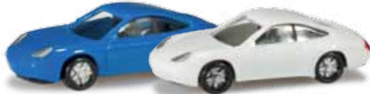
ab Dezember 2013 lieferbar! delivery in December 2013 N 1/160 15,00 €

065122-002 Porsche 911 2er Set Farbneuheit: blau/weiß / blue/white