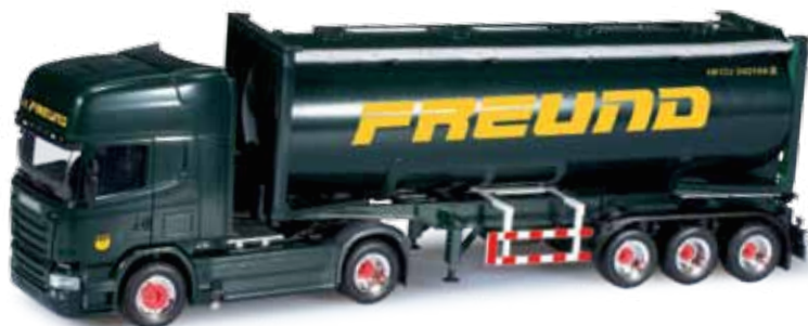
303248 Scania R 13 TL Streamline Drucksilocontainer-Sattelzug Scania R 13 TL Streamline silo container semitrailer „Spedition Freund“ In 2013 wurden von der Spedition Freund wieder 25 Scania Zugmaschinen angeschafft. Der neue Scania R 730 der aktuellen Baureihe zieht einen dunkelgrünen Siloaufleger des Unternehmens aus Frechen. / In 2013, the forwarder Freund once again purchased 25 Scania rigid tractors. The new Scania R 730 Topline of the current series pulls a dark-green silo trailer of the Frechen-based company.