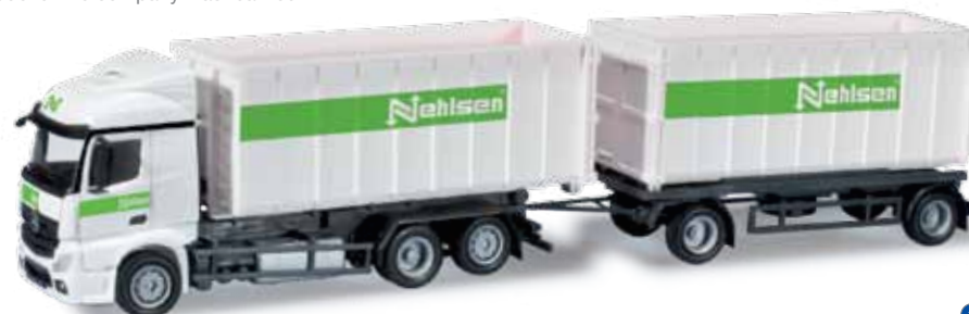
303347 Mercedes-Benz Actros Streamspace 2.3 Abrollmulden-Hängerzug / Mercedes-Benz Actros Streamspace 2.3 roll-off multibucket trailer „Nehlsen Gruppe“ Neben dem neuen Mercedes-Benz Econic wird auch dieser Mercedes-Benz Actros Streamspace 2.3 mit Abrollmulden der Nehlsen Gruppe als Herpa-Miniatur in einer einmaligen Auflage realisiert. / Next to the new Mercedes-Benz Econic, this Mercedes-Benz Actros Streamspace 2.3 with containers of the Nehlsen group is realized as one-time edition miniature model.