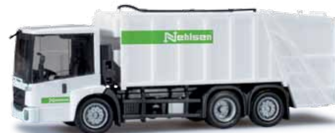
303217 Mercedes-Benz Econic 13 Pressmüllwagen / Mercedes Benz Econic 13 garbage truck „Nehlsen Gruppe“ Die Nehlsen-Gruppe mit Sitz in Bremen ist vornehmlich in den Bereichen Entsorgung und Abfalllogistik tätig und unterhält Standorte in Niedersachsen, Berlin, Brandenburg, Sachsen und Mecklenburg-Vorpommern. Neben dem neuen Econic Pressmüllwagen wird ein weiteres Modell dieses Unternehmen realisiert. / The Nehlsen group with headquarters in Bremen is mainly active in the areas disposal of waste and waste logistics and maintains subsidiaries in Lower Saxony, Berlin, Brandenburg, Saxony and Mecklenburg-Vorpommern. Next to the new Econic compactor vehicle, another model of the company was realized.