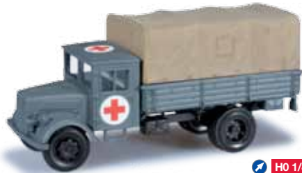
744737 Deutz Planen-LKW/ Deutz truck with canvas