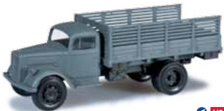
744744 Opel Blitz Hochpritschen-LKW Opel Blitz truck with canvas