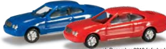
ab Dezember 2013 lieferbar! delivery in December 2013 N 1/160 15,00 €

065122-002 Porsche 911 2er Set Farbneuheit: blau/weiß / blue/white