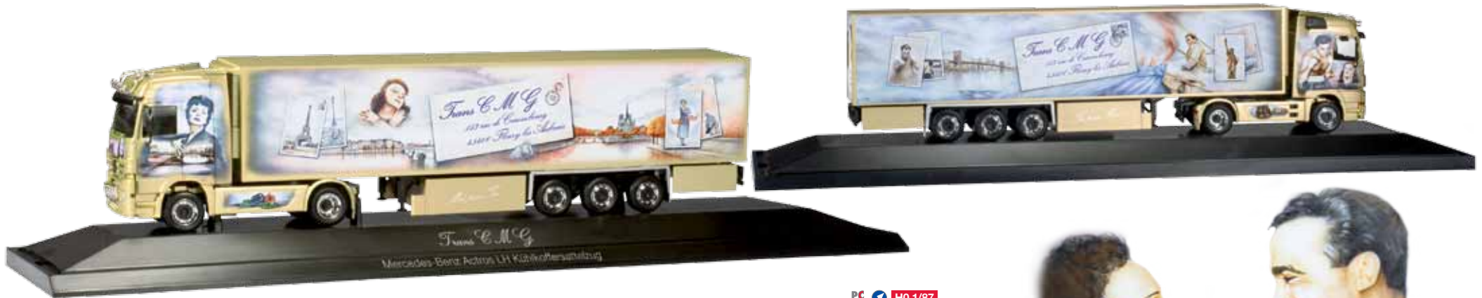
121514 Mercedes-Benz Actros LH Kühlkoffer-Sattelzug / Mercedes-Benz Actros LH refrigerated box semitrailer „Edith & Marcel“ (F) PC HO 1/87 59,00 €

Das französische Transportunternehmen Trans CMG hat sich bei der Künstlerin Isabell Chrysalid einen Sattelzug mit der Geschichte der Sängerin Edith Piaf und des Boxers Marcel Cerdan gestalten lassen. Das komplett grüngold-metallisch lackierte Herpa-Modell wird im aufwändigen Rasterverfahren mit den brillanten Motiven bedruckt und in der bekannten Vitrine an den Fachhandel ausgeliefert.