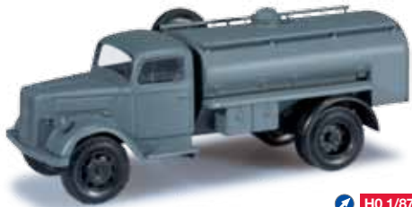
744720 Opel Blitz Tank-LKW / Opel Blitz truck with tank