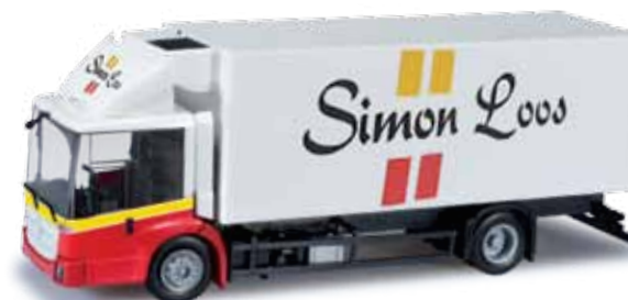
303309 Mercedes-Benz Econic 2013 Kühlkoffer-LKW / Mercedes-Benz Econic 2013 refrigerated box truck „Simon Loos“ (NL) Im Nahverkehrsbereich werden einige Mercedes-Benz Econic LKW mit Kühlkoffer-Aufbau von der niederländischen Firma Simon Loos eingesetzt. Die Herpa-Neuheit mit dem brandneuen Econic-Fahrerhaus erscheint in einmaliger Auflage. For local traffic, some Mercedes-Benz Econic trucks with refrigerated box trailers are operated by the Dutch company Simon Loos. The new Herpa model with the brand new Econic cab is released as one-time edition.