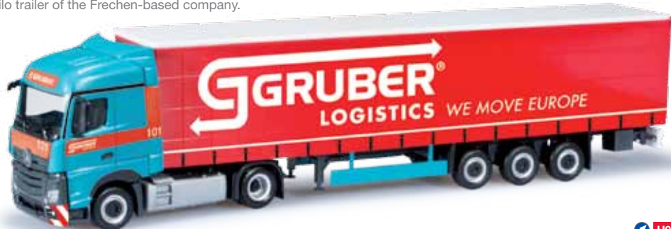
303378 Mercedes-Benz Actros Streamspace Lowliner-Sattelzug Mercedes-Benz Actros Streamspace Lowliner semitrailer „Gruber“ mit Sitz in Bozen (I) Über sieben Jahrzehnte ist die Gruber Logistik im Bereich Schwer- und Sondertransporte tätig. Der neue Mercedes-Benz Actros Streamspace mit Lowliner-Auflieger wird bei dem Unternehmen in großer Stückzahl europaweit eingesetzt. For over seven decades, Gruber Logistik has been conducting heavy and special transports. The new Mercedes-Benz Actros Streamspace with Lowliner trailer is operated Europe-wide in large numbers.