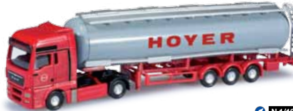
N 1/160 19,50 €

065283-002 Mercedes-Benz B-Klasse 2er Set Farbneuheit: rot/ultramarinblau / red/ultramarine blue