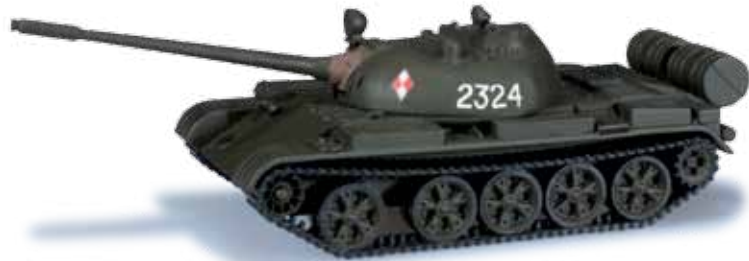
744768 Kampfpanzer T 55 / Fighting tank T 55 „Polen“