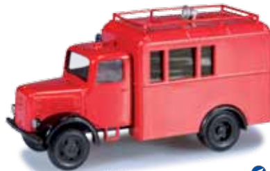
744751 Klöckner-Deutz Koffer-LKW Klöckner-Deutz truck with box