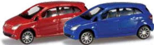
ab Dezember 2013 lieferbar! delivery in December 2013 N 1/160 15,00 €

065146-002 Mercedes-Benz CLK 2er Set Farbneuheit: blau/rot /blue/red