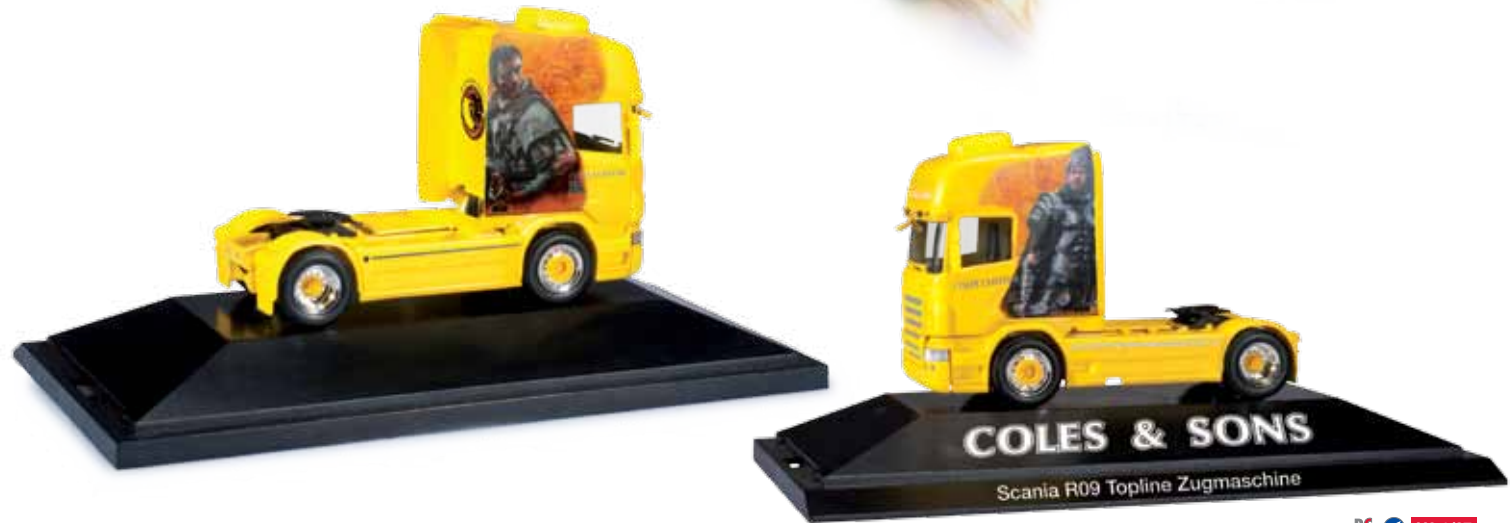
110679 Scania R '09 Topline Zugmaschine / Scania R '09 Topline rigid tractor „Coles & Sons“ (GB) PC HO 1/87 36,50 €

Das 1979 gegründete Transportunternehmen Coles & Sons ist in ganz Europa bekannt für seine schönen Zugmaschinen. Herpa realisiert zunächst das neueste Fahrzeug der Spedition, eine Scania R '09 Topline Zugmaschine in der bekannten Private Collection Vitrine. / All over Europe, the transport company Coles & Sons, established in 1979, is well known for its nice rigid tractors. Herpa initially realized the forwarder's latest vehicle, a Scania R '09 Topline rigid tractor in the well-known Private Collection showcase.