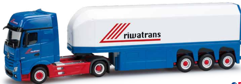
159401 Mercedes-Benz Actros Giga 2011 Glastransporter-Sattelzug / Mercedes-Benz Actros Giga 2011 glastruck semitrailer „Riwatrans“ Die fiktive Spedition Riwatrans erhält Zuwachs durch den neuen Mercedes-Benz Actros Gigaspace, der einen Langendorf Glastransporter zieht. / The fictitious forwarding company Riwatrans is enhanced by the new Mercedes-Benz Actros Gigaspace pulling a Langendorf glass transporter.