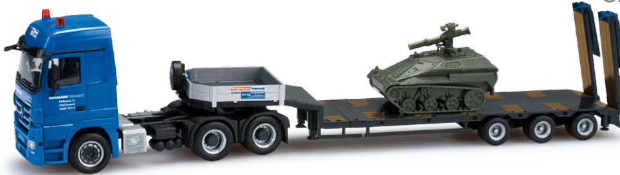
159289 Mercedes-Benz Actros LH '08 Semitiefhlade-Sattelzug mit Ladegut Wiesel / MAN TGX XXL low boy semi trailer with load tank Wiesel „Hegmann“ Mit einem Kleinpanzer Wiesel beladen erscheint ein neues Modell des Schwertransport-Spezialisten Hegmann Transit aus dem westfälischen Sonsbeck. Die dreiachsige Zugmaschine zieht einen dreiachsigen Semitiefhlader. / A new model of the heavy load specialist Hegmann Transit from Sonsbeck, Westphalia, is released loaded with a small Wiesel tank. The three-axle rigid tractor pulls a three-axle semi-flat-bed trailer.