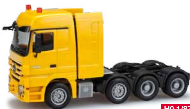
156615 HO 1/87 Mercedes-Benz Actros Schwerlastzugmaschine / Heavy duty, gelb / yellow 16,00 €