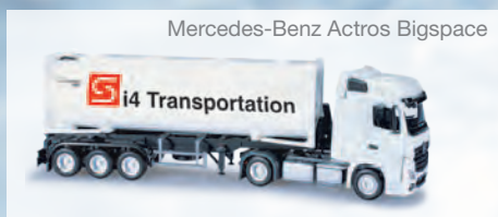
Mercedes-Benz Actros Bigspace