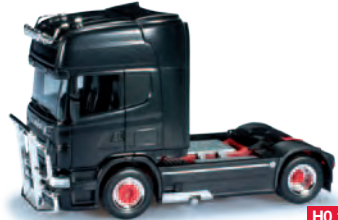
158008 HO 1/87 Scania R '09 TL, schwarz metallic / black metallic 16,00 €

Herpa MiniKits - Bausätze für Modelleisenbahner und Bastler Construction sets for hobbyists Neue Farben / New colours: