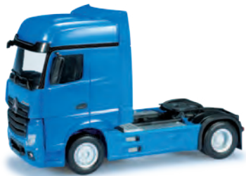
H0 1/87 12,50 €

159500 Mercedes-Benz Actros Bigspace Zugmaschine / rigid tractor Die entgegen dem Gigaspacer minimal kleinere Fahrerhausvariante Bigspace des neuen Mercedes-Benz Actros kommt bei dieser Solozugmaschine zum Einsatz, die mit einer Chassisverkleidung zunächst in blau ausgeliefert wird. The Bigspace cab variant of the new Mercedes-Benz Actros was used for this rigid tractor with blue chassis casing. The Bigspace cab is just slightly smaller than the Gigaspacer cab.