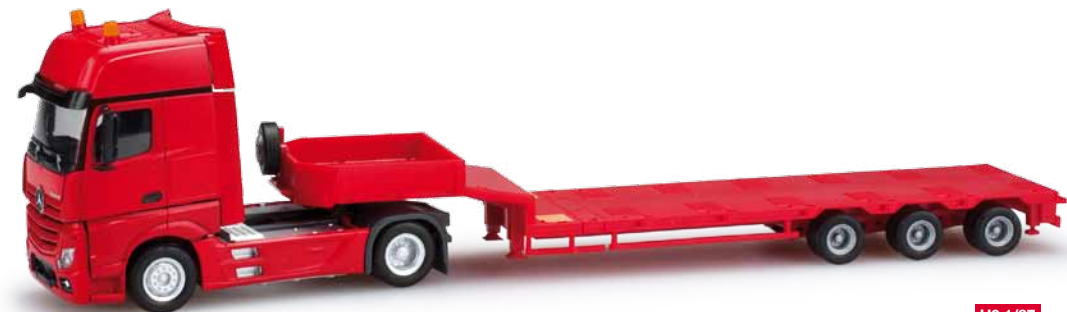
159296 Mercedes-Benz Actros Giga 2011 Semitiefhlade-Sattelzug / Mercedes-Benz Actros Giga 2011 low boy semi trailer Im Design der Herpa Baufahrzeugflotte erscheint der neue Mercedes-Benz Actros mit Gigaspace-Fahrerhaus und einem dreiachsigen Goldhofer Semitiefhladeauflieger mit beiliegenden Auffahrampen. / The new Mercedes Benz Actros with Gigaspace driver's cab and a three-axle Goldhofer semi-flat-bed trailer and enclosed ramps is released in the colors of Herpa's construction vehicle fleet.