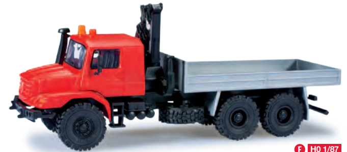
H0 1/87 32,50 €

159562 Mercedes-Benz Actros M '08 Meiller-Kipper 4a Mercedes-Benz Actros M '08 Meiller dump truck, 4 axles „Reinert Logistics“ Auch im Baustellenbereich ist die Firma Reinert aus Schleife in der Oberlausitz tätig. Der Mercedes-Benz Actros M der Baureihe MP2 ist mit der aktuellen Meiller Mulde im Design des Unternehmens unterwegs. Reinert from Schleife in the Oberlausitz also works in the construction sector. The Mercedes-Benz Actros M of the MP2-series is equipped with the current Meiller trough in company design.