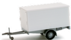
052221 HO 1/87 PKW-Anhänger, weiß / Car trailer, white 5,50 €