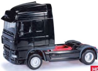
154703 HO 1/87 DAF XF 105 SC, schwarz / black 11,50 €