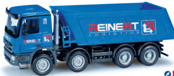
H0 1/87 19,50 €

159500 Mercedes-Benz Actros Bigspace Zugmaschine / rigid tractor Die entgegen dem Gigaspacer minimal kleinere Fahrerhausvariante Bigspace des neuen Mercedes-Benz Actros kommt bei dieser Solozugmaschine zum Einsatz, die mit einer Chassisverkleidung zunächst in blau ausgeliefert wird. The Bigspace cab variant of the new Mercedes-Benz Actros was used for this rigid tractor with blue chassis casing. The Bigspace cab is just slightly smaller than the Gigaspacer cab.