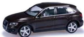
034043 HO 1/87 Audi Q5®, braun metallic / brown metallic 10,50 €