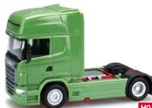
156851 HO 1/87 Scania R '09 TL, hellgrün / light green 11,50 €