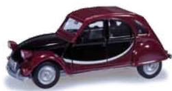
020817 HO 1/87 Citroën 2 CV Charleston, rot-schwarz / red-black 10,50 €