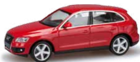
024044 HO 1/87 Audi Q5®, rot / red 9,50 €