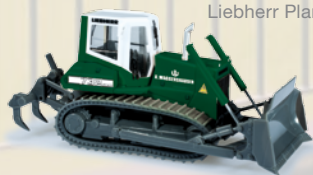
Liebherr Planierraupe / Bulldozer