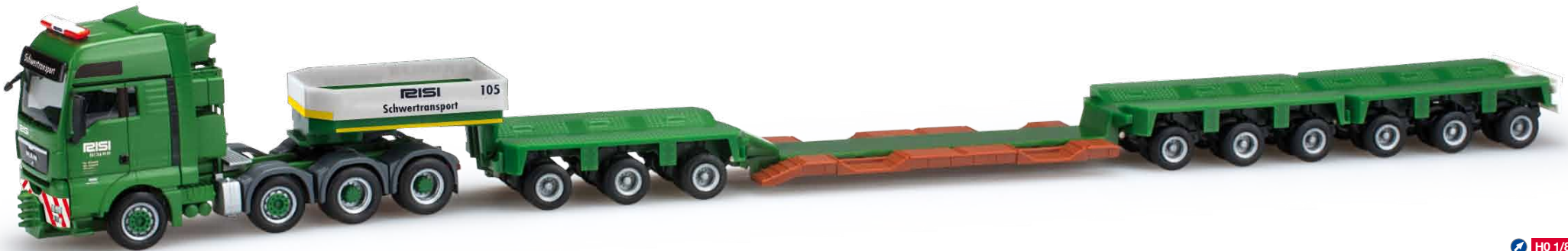
159371 MAN TGX XXL Tieflade-Sattelzug / MAN TGX XXL low boy semi trailer „Risi“ Das Schweizer Transport- und Bauunternehmen Risi setzt diesen MAN TGX Schwerlastzug mit Goldhofer Tieflader ein. Die Zugmaschine zieht insgesamt neun Achslinien mit einem Baggerbett. / The Swiss transport- and construction company Risi operates this MAN TGX heavy load truck with Goldhofer flat-bed trailer. The rigid tractor pulls nine center lines with a transporter bed.