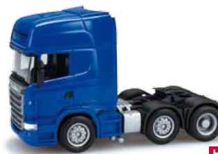
156998 HO 1/87 Scania R '09 TL, blau / blue 11,50 €