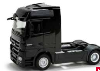
155168 HO 1/87 Mercedes-Benz Actros, schwarz / black 11,50 €