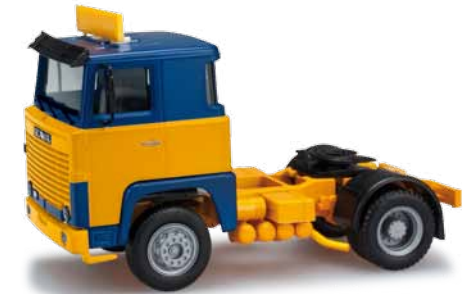
159302 Scania 141 Solozugmaschine / Scania 141 rigid tractor Als Solozugmaschine ergänzt der Scania 141 das Herpa Sortiment. Zunächst erscheint das Modell in blau-gelber Farbgebung. / The Scania 141 enhances the Herpa range as rigid tractor. The first model is released in blue and yellow.