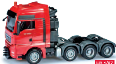
154970 HO 1/87 MAN TGX XXL 680 Schwerlastzugmaschine, rot MAN TGX XXL 680 rigid tractor heavy duty, red 16,00 €