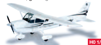
019200 HO 1/87 Cessna 172 Skyhawk 32,00 €