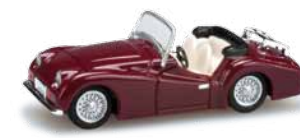
022316 HO 1/87 Triumph TR3, weinrot / wine red 8,00 €