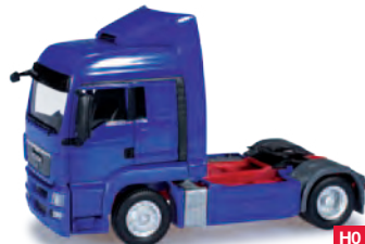
154147 MAN TGS, ultramarinblau / ultramarin blue 11,50 €