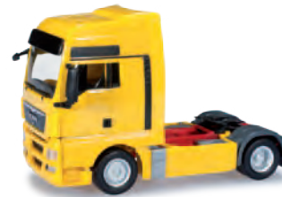
154086 MAN TGX XXL, gelb / yellow 11,50 €