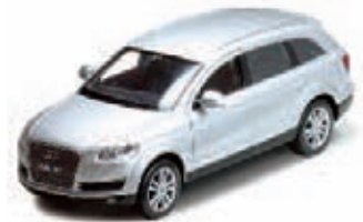
AUDI Q7 ART.NR.: 1618 FARBE: SCHWARZ ART.NR.: 1619 FARBE: SILBER