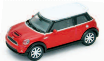
MINI COOPER S ART.NR.: 1668 FARBE: ROT ART.NR.: 1669 FARBE: GELB