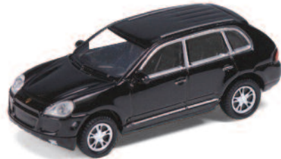
PORSCHE CAYENNE TURBO ART.NR.: 1614 FARBE: SCHWARZ