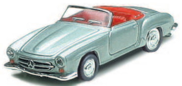
1955 MERCEDES-BENZ 190 SL ART.NR.: 1600 FARBE: SILBER