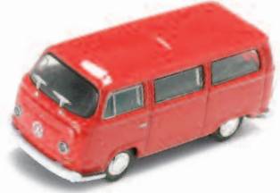
1972 VOLKSWAGEN T2 CAMPER VAN ART.NR.: 1635 FARBE: GELB