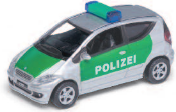
POLIZEI MERCEDES A KLASSE ART.NR.: 1641 FARBE: SILBER