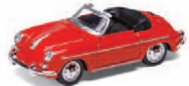
PORSCHE 356 B ART.NR.: 1608 FARBE: ROT ART.NR.: 1609 FARBE: SILBER