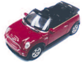
MINI COOPER S CABRIO ART.NR.: 1623 FARBE: ROT