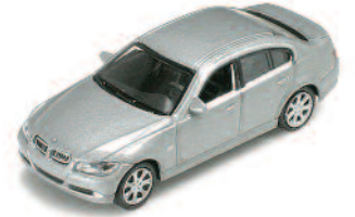
BMW 330 I ART.NR.: 1628 FARBE: GRAPHIT ART.NR.: 1629 FARBE: SCHWARZ