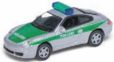
POLIZEI PORSCHE ART.NR.: 1642 FARBE: SILBER