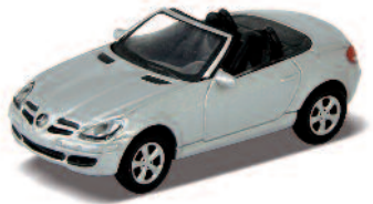
MERCEDES SLK 350 ART.NR.: 1604 FARBE: SILBER ART.NR.: 1605 FARBE: SCHWARZ