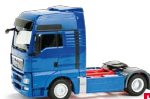
154086 HO 1/87 MAN TGX XXL, blau / blue 11,50 €