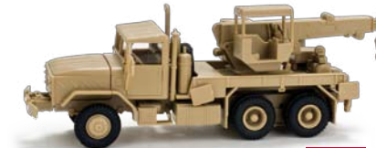
740609 HO 1/87 Kranwagen M 936 A1 US, desert / Crane truck M936 A1 US 13,00 €

Blick hinter die Kulissen bei Herpa: Tag der offenen Tür am 16. Juli 2011 in Diethenhofen Take a look behind the scenes at the Herpa Open House on July 16, 2011 in Diethenhofen, Germany Weitere Termine unter www.herpa.de/termine - Check for more events at www.herpa.de/dates