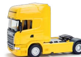
156851 HO 1/87 Scania R TL, gelb / yellow 11,50 €