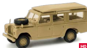
743266 HO 1/87 Landrover, desert 7,50 €