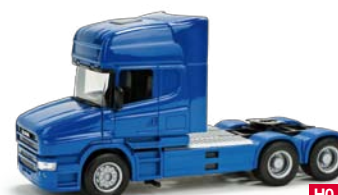
151726 HO 1/87 Scania Hauber TL, 3-achs, blau / blue 11,50 €