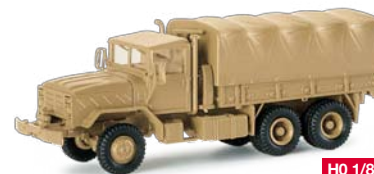
740593 HO 1/87 LKW M 923, Softtop mit Winde, desert / Softtop with winch 12,50 €