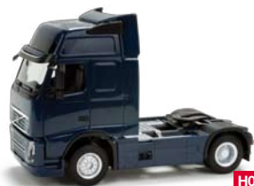
157391 HO 1/87 Volvo FH GL XL, dunkelblau / dark blue 11,50 €