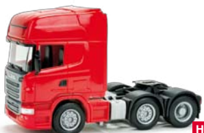
156998 HO 1/87 Scania R TL, 3-achs, rot / red 11,50 €