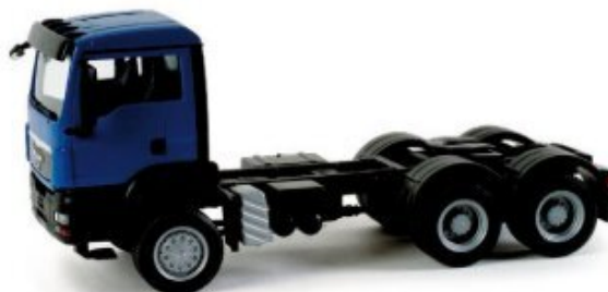
158305 | MAN TGS M Allrad-Zugmaschine, 3-achs 11,50 € HO 1/87 Das extrem lange Chassis kennzeichnet die neuen Allradzugmaschinen für Baufahrzeuge. Der MAN TGS wird zunächst mit blauem M Fahrerhaus ausgeliefert. / The new all-wheel tractors for construction vehicles are distinguished by their extra-long chassis. The MAN TGS will be delivered with a blue M driver's cab at first.