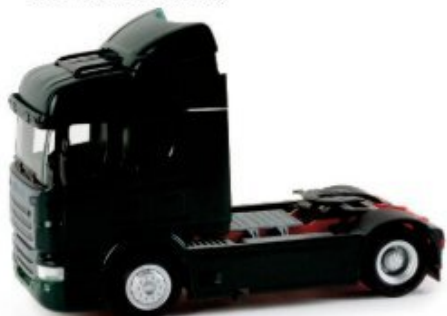
158237 | Scania R 09 Highline Zugmaschine 11,50 € HO 1/87 Die aktuelle Scania R 09 Zugmaschine mit mittelhohem Fahrerhaus ergänzt nun das Sortiment der Solozugmaschinen. Zunächst erscheint das Modell in dunkelgrün mit rotem Chassis. / The current Scania R 09 tractor with medium-high driver's cab enhances the rigid-tractor assortment. We start off with a model in dark green with red chassis.