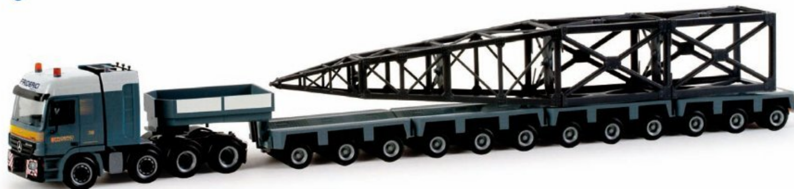
158176 | Mercedes-Benz Actros L '02 Tieflade-Sattelzug HO 1/87 Mercedes-Benz Actros L '02 low boy semitrailer „Friderici“ (CH) Mit zwölf aufgesetzten Achslinien stellt das Schweizer Transportunternehmen Friderici das Vorbild für einen neuen Schwertransporter. Das Modell ist schablonenlackiert, aufwändig bedruckt und mit einem Gittermast beladen. / The Swiss transport company Friderici provided the idea for this new heavy load transporter with twelve coupled center lines. The model was stencil painted, elaborately printed and loaded with a girder mast.