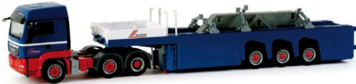
155618 | MAN TGS LX Betonfertigteiletransporter-Sattelzug mit Ladung (4 Hausteile) 32,50 € HO 1/87 F A Formneuheit! Beladen mit den vier Giebelteilen für das neue Herpa Fertighaus ergänzt ein Modell der Riwatrans-Serie den Fuhrpark für den Haustransport. Diesem Modell liegen die Verbindungsteile für die Seitenwände bei. / New type! A Riwatrans model loaded with four gable parts for Herpa's prefabricated house enhances the fleet. Included with this model are the connecting elements for the side walls.