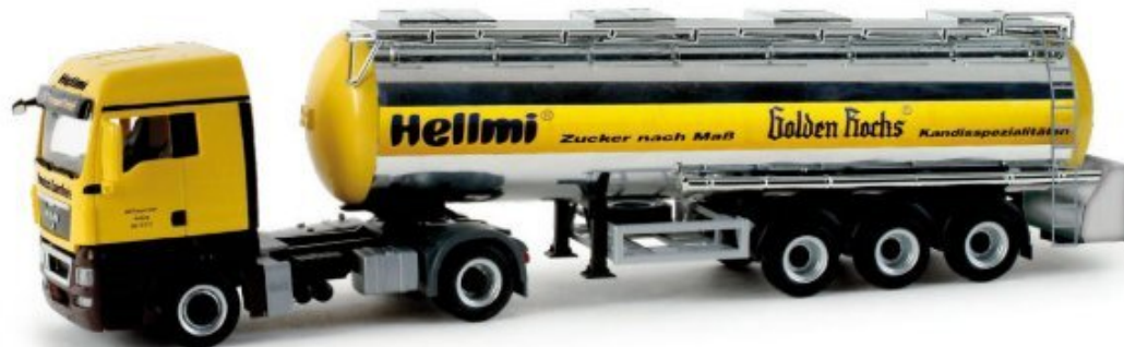
158220 | MAN TGX XLX Lebensmittelchromtank-Sattelzug / 24,50 € HO 1/87 F Formneuheit! Mit neuem Lebensmittelankaufleger nach FFB Vorbild erscheint der MAN Sattelzug der Hamburger Zuckertransport GmbH mit Werbung für Hellmi Zuckerprodukte. Der Chromtankaufleger hat einen Pumpenkasten heckseitig montiert. / New type! With the new FFB provisions tank trailer, we release the MAN semitrailer of the Zuckertransport GmbH from Hamburg with advertisement for Hellmi sugar products. The chrome-plated trailer has a pump box mounted in the rear.