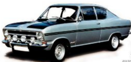
Vorbildfoto example photo