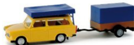
024280 | Trabant 601 Universal mit Dachzelt und Anhänger mit Plane / with roof-tent, trailer and tarpaulin gelb-blau / yellow-blue 13,50 € HO 1/87