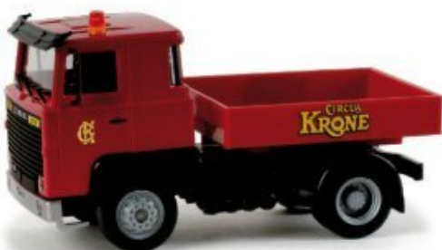
158275 | Scania 111 Zugmaschine mit Pritsche 15,50 € HO 1/87 Als klassisches Fahrzeug des Circus Krone erscheint der Scania 111 vorbildgerecht mit Fernverkehrskabine und Ballastpritsche. Das Modell ist vorbildgerecht bedruckt. / A classic Circus Krone vehicle, a Scania 111 is released with true-to-the-original long-distance cab and a ballast platform and also features the authentic prints.