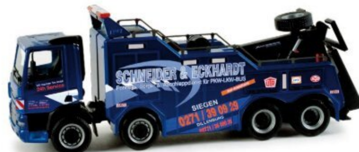
158268 | DAF CF Empl Bison „Schneider und Eckhardt“ 39,50 € HO 1/87 Hauptsitz des Bergeunternehmens Schneider & Eckhardt ist Siegen, eine weitere Niederlassung wird in Dillenburg unterhalten. Der DAF CF mit Aufbau der Firma Empl erscheint in limitierter Auflage. Headquarters of the rescue company Schneider & Eckhardt are in Siegen, another subsidiary is maintained in Dillenburg. The DAF CF with Empl superstructure will be released as limited edition.