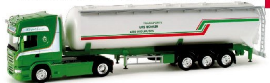
158329 | Scania R '09 Topline Silo-Sattelzug / Scania R '09 Topline semitrailer with bulk tank 24,50 € HO 1/87 A Der Fuhrpark des Schweizer Transportunternehmens Urs Bühler besticht durch besonders gepflegte Fahrzeuge, die zudem auffällig gestaltet sind. Als zweites Modell erscheint ein Scania mit Siloaufleger. The fleet of the Swiss transport company Urs Bühler captivates by its well tended vehicles which furthermore feature striking designs. The second model is a Scania with silo trailer.