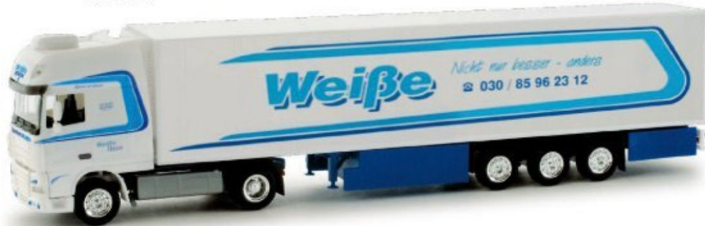
158336 | DAF XF 105 SSC Kühlkoffer-Sattelzug / DAF XF 105 SSC refrigerated semitrailer 24,50 € HO 1/87 A Mit einem außerordentlich gepflegten Fuhrpark ist die Spedition Weiße aus Berlin im Kühlverkehr tätig. Herpa realisiert den aktuellen DAF XF 105 SSC mit Kühlaufleger. / The forwarding company Weiße from Berlin operates an outstandingly well-tended fleet for refrigerated traffic. Herpa realized the current DAF XF 105 SSC with refrigerated trailer.