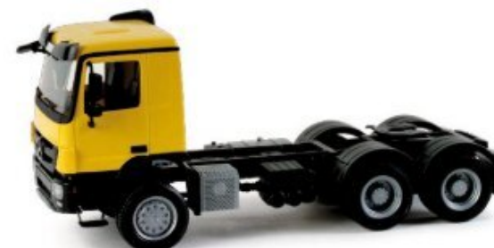
158299 | Mercedes-Benz Actros M 08 Allrad-Zugmaschine, 3-achs 11,50 € HO 1/87 Mercedes-Benz Actros M 08 all-wheel rigid tractor, 3 axes Mit neuem Allradchassis erscheint der aktuelle Mercedes-Benz Actros mit mittellangem M-Fahrerhaus. Zunächst wird das Modell mit gelbem Fahrerhaus ausgeliefert. / The current Mercedes Benz Actros with medium-long M-cab is released with new all-wheel chassis. We start off with a model with yellow driver's cabin.