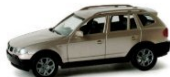
033220 | BMW X3™, metallic platinbronze / platinum-bronze 10,50 € HO 1/87