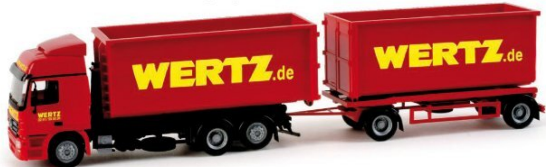
158282 | Mercedes-Benz Actros L '02 Abrollmulden-Hängerzug 24,50 € HO 1/87 A In dritter Generation ist die Wertz-Gruppe aus Aachen in den Bereichen Stahlhandel, Entsorgung, Containerdienste und Schwertransporte tätig. Der Mercedes Benz Actros Hängerzug mit Abrollmulden wird im Bereich Recycling eingesetzt. / The Wertz Gruppe from Aachen has been operating in the areas steel trade, waste disposal, container services and heavy loads in third generation. The Mercedes Benz Actros trailer with containers is operated for recycling operations.