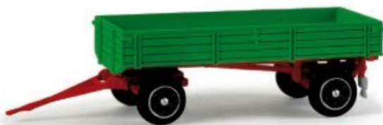
076425 | Landwirtschaftlicher Anhänger / Trailer agricultural 12,50 € HO 1/87 F Formneuheit! Passend zum Deutz D 40 L erscheint ein epochen-gerechter Anhänger, der für unterschiedliche Ladungen geeignet ist. Anhänger dieser Bauform waren in den 1960er Jahren sehr weit verbreitet. / New type! Suitable for the Deutz D 40 L, we release an era-appropriate trailer for various loads. Trailers like that were very common in the 1960s.