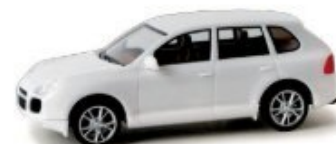
023153 | Porsche Cayenne weiß / white 9,50 € HO 1/87