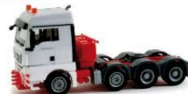
155397 | MAN TGX XXL 540 Schwerlastzugmaschine / Heavy duty rigid tractor weiß / white 16,00 € HO 1/87