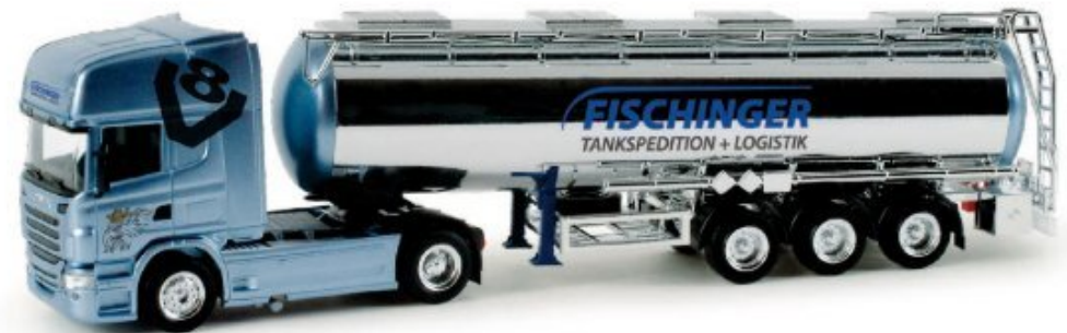
158244 | Scania R '09 TL Chromtank-Sattelzug / Scania R '09 TL chrome-plated semitrailer „Fischinger“ 26,50 € HO 1/87 A Die Spedition Fischinger ist seit über 50 Jahren im Bereich Tanktransporte tätig. Herpa realisiert ein aktuelles Fahrzeug aus dem Fuhrpark mit einer Scania R Topline Zugmaschine und dem neuen Chromtankaufleger. The forwarder Fischinger has been operating in the tank transport industry for over 50 years. Herpa realized a current vehicle from the fleet – a Scania R Topline tractor and the new chrome-plated trailer.