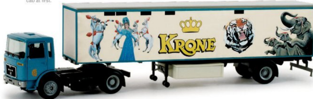
158312 | MAN F8 Koffer-Sattelzug / MAN F8 box semitrailer „Circus Krone“ 24,50 € HO 1/87 In der historisch blauen Farbgebung des Circus Krone erscheint ein klassisches Modell in einmaliger Auflage. Der MAN F 8 mit kurzem Fahrerhaus zieht einen einachsigen Auflieger, der mehrfarbig bedruckt wird. / We release a classic, one-time edition Circus Krone model in the historic colour blue. The MAN F 8 with short driver's cabin pulls a single-axle multi-colored trailer.