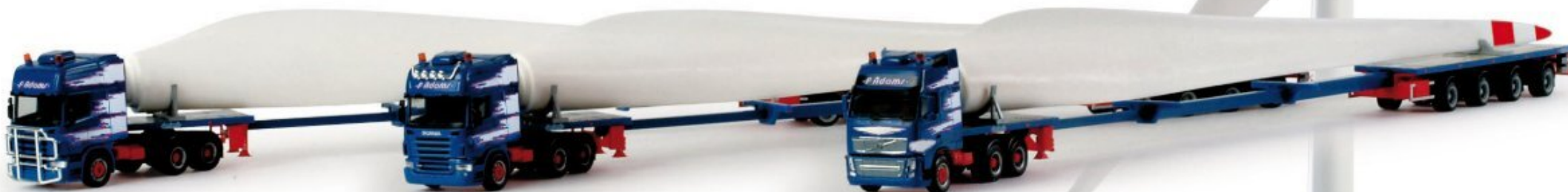
158251 | Schwerlastset Windflügeltransport mit drei Modellen / Heavy duty set with three trucks wind turbine transport „P. Adams“ (B) HO 1/87 Formneuheit! Die Herpa Windkraftanlage wächst weiter. Mit den Fahrzeugen in diesem Set werden die drei Rotorblätter, die jetzt mit entsprechenden Aufnahmen zur Komplettierung der Windkraftanlage ausgestattet sind, transportiert. Gezogen werden die drei Teletrailer von drei unterschiedlichen Zugmaschinen der Belgischen Spedition P.Adams. / New type! The Herpa wind power plant continues to grow. With the vehicles of this set, three rotor blades are transported which are equipped with the necessary slots to complete the wind power plant. The three teletrailers are pulled by three different tractors of the Belgian forwarding company P. Adams.