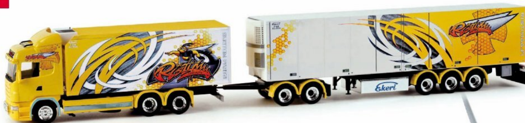
157964 | Scania R '04 HL Kühlkoffer-Gigaliner / Scania R '04 HL refrigerated semitrailer gigaliner „Ristimaa“ (SF) HO 1/87 Das finnische Transportunternehmen Ristimaa hat einen neuen Komplettzug gestalten lassen. Der Scania Highline Kühlkofferzug ist rundum mehrfarbig bedruckt und mit vielen Chromdetails ausgestattet. The Finnish transport company Ristimaa had a new tractor-trailer-combination designed. The Scania Highline refrigerated box trailer features multi-colored prints all around and many chrome-plated details.