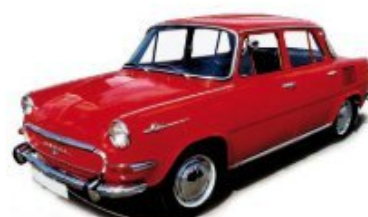
Vorbildfoto example photo