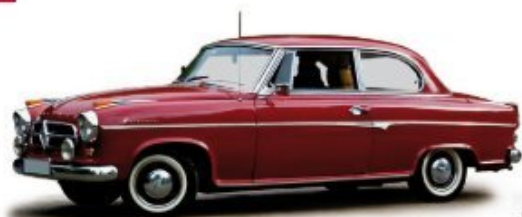
Vorbildfoto example photo