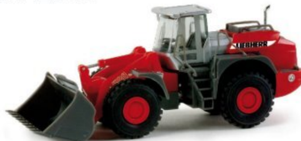
158183 | Liebherr Radlader L580 / Liebherr wheel loader L 580 25,00 € HO 1/87 In Ergänzung zur rot-silbernen Herpa Baufahrzeugflotte wird der schwere Liebherr Radlader L 580 in passender Farbgebung produziert. / To enhance the red-silver Herpa construction vehicle fleet, we produce the heavy Liebherr wheel loader L580 in matching colours.