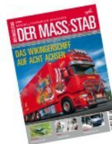
204651 | Die neue Ausgabe DER MASS:STAB The new issue DER MASS:STAB 6,50 €

In Ausgabe 6/10 lesen Sie / Some of the topics in issue 6/10: