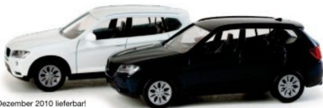
ab Dezember 2010 lieferbar! delivery in December 2010