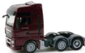
154413 | MAN TGX XLX Zugmaschine, 11,50 € HO 1/87 3-achs / 3 axles schwarzrot / black red