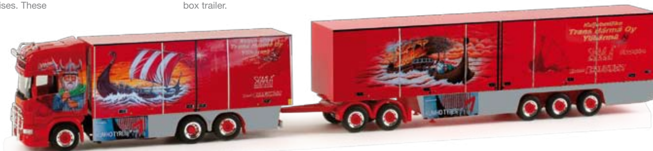
158107 | Scania R TL Kühlkoffer-Gigaliner / Scania R TL refrigerated box gigaliner 49,90 € H0 1/87 „Trans Härmä Oy / Viking“ (SF) In Finnland ist dieser auffällige Gigaliner im Bereich von Transporten unterwegs. Das aufwändige Fahrzeug wird als Modellhighlight mit viel Zubehör und aufwändiger Bedruckung gefertigt. / This flashy Gigaliner is operated for transports in Finland. The elaborate vehicle is manufactured as model highlight with lots of accessories and lavish prints.