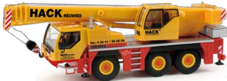
157483 | Liebherr Mobilkran LTM 1045/1 / Liebherr mobil crane LTM 1045/1 „Hack Autokrane“ 39,50 € H0 1/87 A Nach dem Semitielflade-Sattelzug der Firma Hack Schwerlastservice erscheint nun auch der Liebherr Mobilkran LTM 1045/1. Das aus über 100 Teilen bestehende Modell wird authentisch beschriftet. / After the semi-lowboy semitrailer of Hack heavy load services, we now also release the Liebherr mobile crane LTM 1045/1. The model consists of over 100 pieces and will feature the authentic labels.