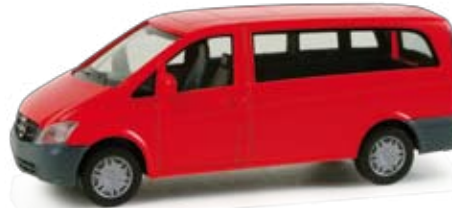
048910 | Mercedes-Benz Vito 2010 Bus 9,00 € H0 1/87 Formneuheit! Mit neuer Frontpartie präsentiert Mercedes-Benz zur IAA 2010 den neuen Mercedes-Benz Vito Modellpflege 2010. Der Bus erscheint zunächst mit roter Karosserie. New type! For the IAA 2010, Mercedes Benz presented the new Mercedes-Benz Vito model upgrading 2010 with a whole new front. The first bus model will be released in red. F