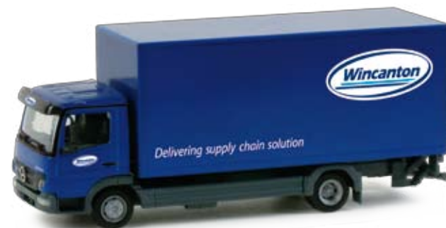
158039 | Mercedes-Benz Atego 2010 Koffer-LKW 19,50 € HO 1/87 F mit Ladebordwand / Mercedes-Benz Atego 2010 straight delivery truck with liftgate „Wincanton“ Formneuheit! Mit geänderter Frontpartie wurde zur IAA 2010 der neue Mercedes-Benz Atego präsentiert. Das Vorbild für das erste Modell stellt der internationale tätige Transportriese Wincanton. / New type! At the IAA 2010, the new Mercedes-Benz Atego was presented with modified front. The original of the first model is operated by the international transport giant Wincanton.