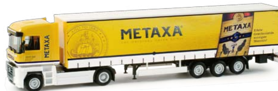
158138 | Renault Magnum Gardinenplanen-Sattelzug / Renault Magnum cutrain canvas semitrailer „Land / Metaxa“ 27,50 € H0 1/87 Mit einem seiner neuesten Sattelzüge wirbt die Spedition Bernhard Land aus Eystруп für den griechischen Weinbrand. Das auffällig gestaltete Modell erscheint in einmaliger Auflage. / The forwarding company Bernhard Land from Eystруп promotes the Greek brandy with one of his latest semitrailers. The elaborately designed model is released as one-time edition.