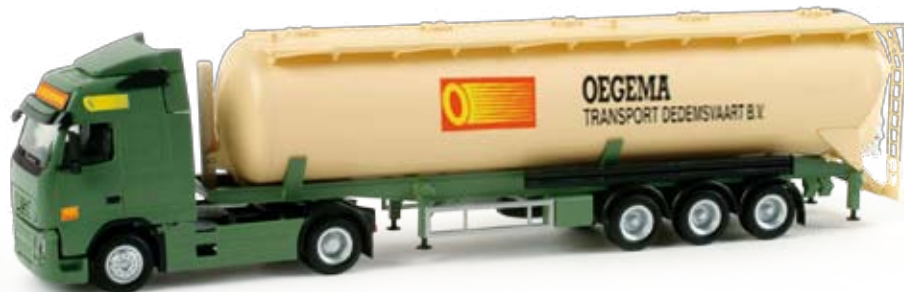
158084 | Volvo FH GL Silo-Sattelzug / Volvo FH GL semitrailer with bulk tank „Oegema“ (NL) 24,50 € HO 1/87 | Seit fast 90 Jahren ist das Transportunternehmen Oegema aus Dedemsvaart in Nordholland tätig. In einmaliger Auflage erscheint ein Silosattelzug mit Volvo Zugmaschine. / The transport company Oegema from Dedemsvaart in North Holland has been operating for almost 90 years. We release a one-time edition silo semitrailer with Volvo tractor.