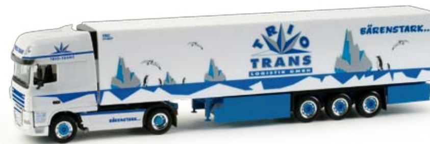
158169 | DAF XF 105 SSC Kühlkoffer-Sattelzug / DAF XF 105 SSC refrigerated semitrailer 24,50 € H0 1/87 „Trio Trans“ Die Friedberger Spedition Trio Trans setzt 20 Züge im Bereich der Thermotransporte ein. Aktuell erscheint ein DAF XF 105 SSC mit Kühlaufleger. / The forwarder Trio Trans from Friedberg operates 20 trucks for temperature-controlled transports. We currently release a DAF XF 105 SSC with refrigerated box trailer.