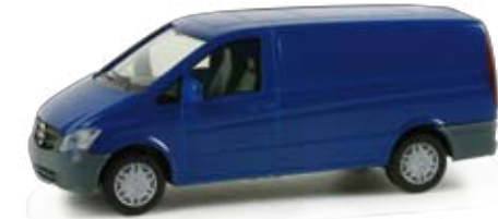
048927 | Mercedes-Benz Vito 2010 Kombi 9,00 € H0 1/87 Mercedes-Benz Vito 2010 station wagon Formneuheit! Mit neuer Frontpartie präsentiert Mercedes-Benz zur IAA 2010 den neuen Mercedes-Benz Vito Modellpflege 2010. Der Kombi erscheint zunächst mit ultramarinblauer Karosserie. / New type! For the IAA 2010, Mercedes Benz presented the new Mercedes-Benz Vito model upgrading 2010 with a whole new front. The van model will be released in ultramarine. F