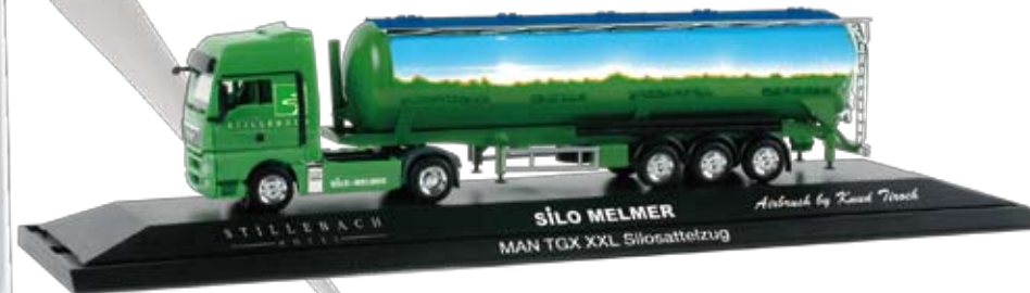
121330 | MAN TGX XXL Silo-Sattelzug / MAN TGX XXL semitrailer with bulk tank 49,90 € H0 1/87 PC A Airbrush Design by Knud Tiroch „Melmer Stillebach“ (A) Mit einem neuen MAN TGX XXL Silo-Sattelzug wirbt die Spedition Melmer für das familiäre Landhotel Stillebach im Pitztal. Der Sattelzug wird vorbildgerecht gestaltet und erscheint in der bekannten Sammlervitrine. / The forwarding company Melmer promotes the familial country hotel Stillebach in the Pitztal. The semitrailer is designed true to the original and will be released in the familiar collection showcase.