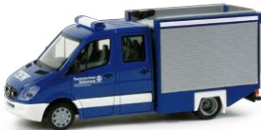
048934 | Mercedes-Benz Sprinter '06 Kraftwagen 17,50 € H0 1/87 „THW Kitzingen“ Formneuheit! Das THW im fränkischen Kitzingen setzt diesen Mercedes-Benz Sprinter als Gerätekraftwagen ein. Der Aufbau entspricht dem des Feuerwehr TSF, jedoch ohne Leiterbestückung auf dem Dach. / New type! The THW (German Federal Agency for Technical Relief) in Kitzingen, Franconia, operates this Mercedes-Benz Sprinter as equipment vehicle. The upper body matches the one of the fire brigade TSF, but without ladder on the roof. F ⚡