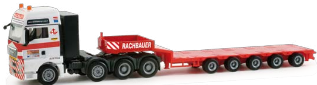
158145 | MAN TGX XXL Semitiefenflader-Sattelzug / MAN TGX XXL semi low boy trailer 32,50 € H0 1/87 „Rachbauer Special“ (A) Auf Spezialtransporte ist das in Salzburg beheimatete Sondertransportunternehmen ansässig. Als Miniaturmodell wird die aktuelle MAN TGX Schwerlastzugmaschine mit 5-achs Semitiefenflader realisiert. The special forwarder from Salzburg has specialized in abnormal loads. We release the current MAN TGX heavy load tractor with 5-axle semi-lowboy.