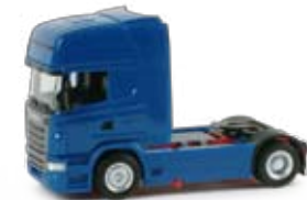
156851 | Scania R '09 TL Zugmaschine 11,50 € HO 1/87 blau / blue