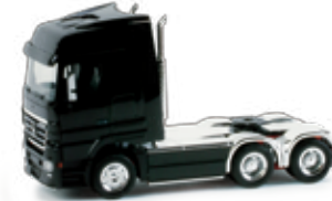
155571 | Mercedes-Benz Actros LH '02 16,00 € HO 1/87 Zugmaschine mit Chromverkleidung, 3-achs / 3 axles schwarz / black