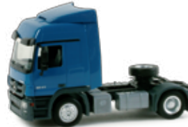
155458 | Mercedes-Benz Actros L 12,00 € HO 1/87 Zugmaschine auf Überführungsfahrt blau / blue