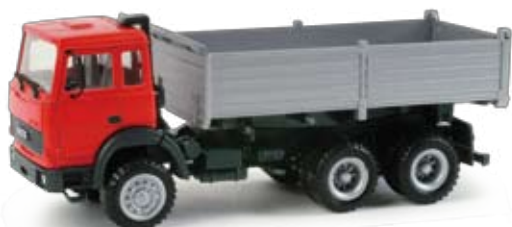
158060 | Iveco Baukipper, 3-achs / Iveco Contractor's 16,50 € HO 1/87 dump truck, 3 axles Mit epochengerechter Kippmulde ergänzt ein Klassiker der 1980er Jahre die neutrale Baufahrzeugflotte im Herpa Programm. / With an era-appropriate tipping trough, a classic enhances the neutral construction vehicle fleet of the 1980s.