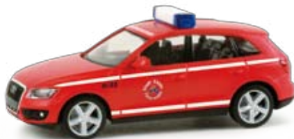
048842 | Audi Q5® „Feuerwehr Essen“ 13,50 € H0 1/87 Führungsfahrzeug für den Wachabteilungsleiter der Feuerwehr Essen, der 2010 mit der Kennung 9/33 in Dienst gestellt wurde. Das Modell erscheint mit authentischer Bedruckung. Guide vehicle for the department head of the fire brigade Essen, which was commissioned in 2010 with the identification 9/33. The model features the authentic prints. ⚡