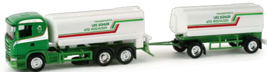
158053 | Scania R Std Benzintank-Hängerzug / Scania R Std fuel tank trailer „Urs Bühler“ (CH) 27,50 € HO 1/87 | Ein sehr breites Spektrum im Transportbereich deckt Urs Bühler Transporte aus Wolhusen in der Schweiz ab. Zunächst erscheint ein Benzintank-Hängerzug mit Scania Fahrerhaus. / Urs Bühler Transporte from Wolhusen in Switzerland covers a broad range in the transport area. At first, we release a refueling tank truck with Scania driver's cabin.