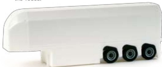
076401 | Langendorf Glastransportauflieger 10,50 € HO 1/87 Glastruck semitrailer In neutraler Farbgebung zur freien Gestaltung ergänzt der aktuelle Langendorf Innenlader das Sortiment der weißen Auflieger. / The current neutral-colored Langendorf inloader enhances the assortment of white trailers.