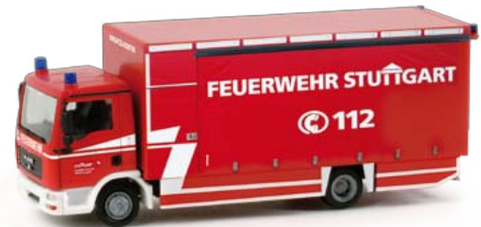
048873 | MAN TGL Koffer-LKW / MAN TGL straight 19,50 € H0 1/87 delivery truck „FW Stuttgart Einsatzlogistik“ Formneuheit! Als Logistikfahrzeug setzt die Feuerwehr Stuttgart diesen MAN TGL ein. Das Modell wird mit einer Ladebordwand ausgestattet und aufwändig bedruckt. / New type! The fire brigade Stuttgart operates this MAN TGL as logistics vehicle. The model is equipped with a hydraulic platform and features elaborate prints. F ⚡