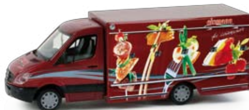
048866 | Mercedes-Benz Sprinter '06 Kühlfahrzeug 19,50 € HO 1/87 F Formneuheit! Der aktuelle Mercedes-Benz Sprinter hat einen neuen Tiefkühlaufbau erhalten. Das Modell erscheint im Design der Firma Eismann, die mittels dieser Fahrzeuge Tiefkühlkost direkt ins Haus liefert. / New type! The current Mercedes-Benz Sprinter has received a new freezer body. The model features the "Eismann" design; the company utilizes these trucks to deliver frozen food directly to the doorstep.