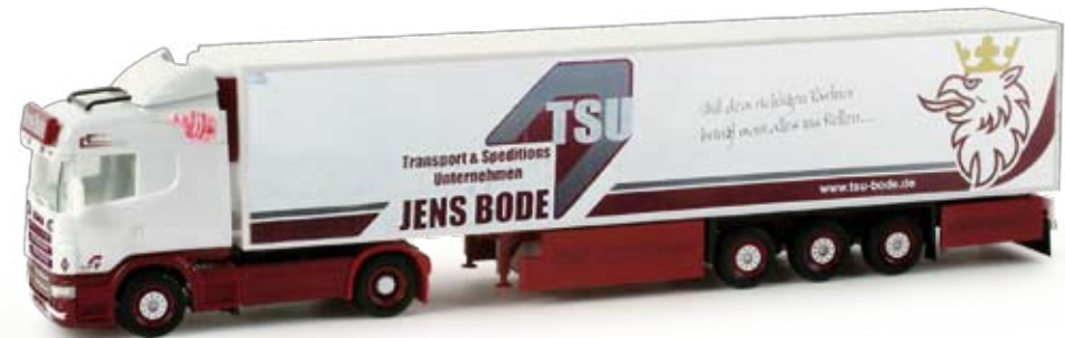
158114 | Scania R Highline Kühlkoffer-Sattelzug / Scania R Highline refrigerated box semitrailer „TSU Bode“ 26,50 € HO 1/87 | Als sechstes Modell der Spedition TSU Bode aus Tarnow erscheint das aktuellste Fahrzeug des Unternehmens, ein Scania R Highline mit auffälliger Farbgebung. / The sixth model of the forwarding company TSU Bode from Tarnow is the latest company vehicle, a Scania R Highline with eye-catching design.