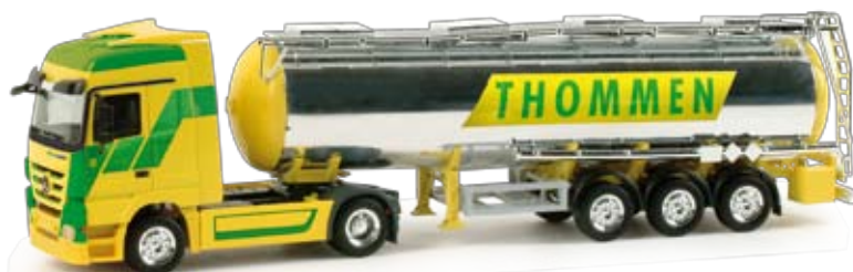
158121 | Mercedes-Benz Actros LH '08 Chromtank-Sattelzug / Mercedes-Benz Actros LH '08 chrome-plated tank semitrailer „Thommen“ (CH) 24,50 € H0 1/87 Die Thommen-Furler AG aus Rütli bei Büren in der Schweiz ist führend im Bereich Chemikalienversorgung, Umwelttechnik und Sonderabfallrecycling tätig. Das Modell erscheint mit dem neuen Chemietankaufleger. / The Thommen-Furler AG from Rütli near Büren in Switzerland is the leading company for chemicals supply, environmental technology and special waste recycling. The model is released with the new chrome tank trailer.