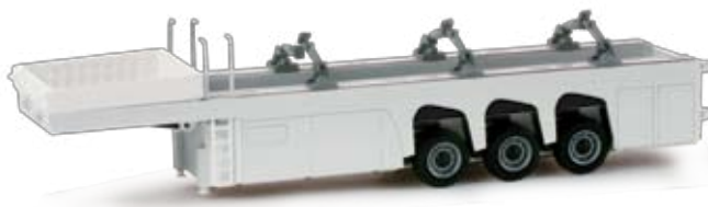
076418 | Langendorf Betonfertigteileauflieger 11,00 € HO 1/87 Cement part semitrailer In neutraler Farbgebung zur freien Gestaltung ergänzt der offene Langendorf Innenlader das Sortiment der weißen Auflieger. / The current neutral-colored Langendorf inloader enhances the assortment of white trailers.