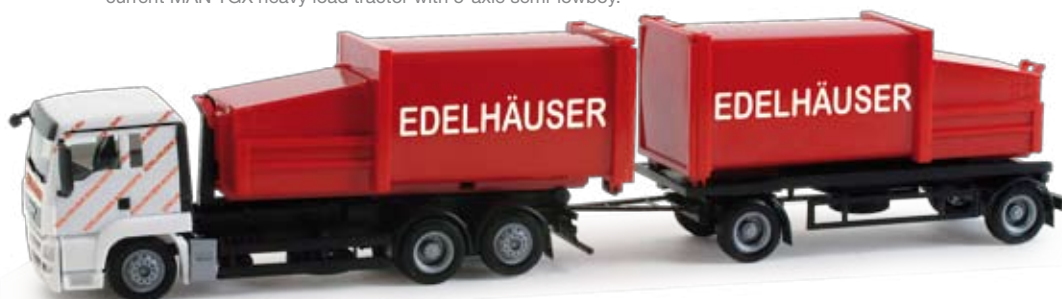
158152 | MAN TGS L Pressmüllcontainer-Hängerzug / MAN TGS L garbage trailer truck 24,50 € H0 1/87 „Edelhäuser“ Im fränkischen Ansbach ist der Entsorger Edelhäuser ansässig, der seine Pressmüllcontainer bei vielen Supermärkten und Industrieunternehmen aufstellt. Transportiert werden diese Behälter mittels MAN Hängerzügen. / The waste management company Edelhäuser with headquarters in Ansbach, Franconia, places its compactor containers at many super markets and industrial enterprises. These containers are transported with MAN trailers.