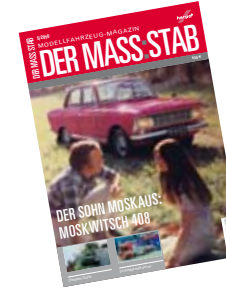
204620 | Die neue Ausgabe DER MASS:STAB 6,50 € The new issue DER MASS:STAB

3-achs Zugmaschinen mit Vorlaufachse (Neue Generation) Fifth-wheel 3 axles for rigid tractor with flow line axle (New generation) Zubehörset mit 15 Sattelteilern der aktuellen Zugmaschinen-Generation für 3-achs Sattelzugmaschinen mit Vorlaufachse (6x2). / Accessories set including 15 fifth-wheel couplings of the current rigid tractor generation for 3-axle semitrailers with pusher axle (6x2).