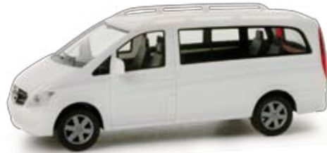
024570 | Mercedes-Benz Viano 2010 9,00 € H0 1/87 Formneuheit! Mit neuer Frontpartie präsentiert Mercedes-Benz zur IAA 2010 den neuen Mercedes-Benz Viano Modellpflege 2010. Der luxuriöse Familienvan mit Dachreling erscheint zunächst mit weißer Karosserie. / New type! For the IAA 2010, Mercedes Benz presented the new Mercedes-Benz Vito model upgrading 2010 with a whole new front. The luxurious family van including roof rails is premiered in white. F