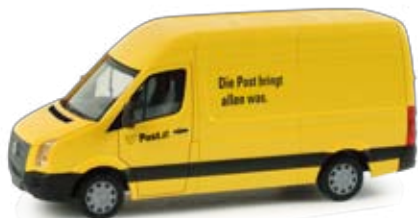
048880 | VW Crafter „Post Österreich“ (A) 12,00 € HO 1/87 Als Paketverteilerfahrzeug wird von der Post in Österreich der aktuelle VW Crafter eingesetzt. Das Modell erscheint in einer einmaligen Auflage. / The mail service in Austria operates the current VW Crafter as parcel service vehicle. The model is released as one-time edition.