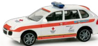
048859 | Porsche Cayenne „ÖRK“ (A) 14,50 € H0 1/87 Das Österreichische Rote Kreuz setzt diesen Porsche Cayenne mit auffälliger Gestaltung als Notarzt-Einsatzfahrzeug im Raum Salzburg ein. Das Modell wird vorbildgerecht mit einem transparenten Warnlichtbalken ausgeliefert. / The Austrian Red Cross operates this Porsche Cayenne in flashy design as emergency ambulance in the Salzburg area. The model will be delivered true to the original and with a transparent warning light. ⚡