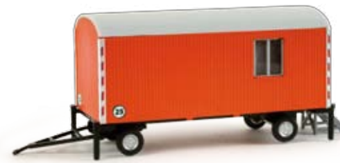
076395 | Bauwagen kommunal / Contractor's shed 12,50 € HO 1/87 Zweiachsiger Bauwagen in kommunaler Farbgebung ohne Ortsbezug. Ideale Ergänzung zum kommunalen Mercedes-Benz Axor Allradkipper 155649. / Two-axle site caravan in municipal design without geographical reference. Ideal addition for the municipal Mercedes-Benz Axor all-wheel dumper 155649.