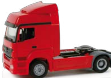
158015 | Mercedes-Benz Axor 2010 Zugmaschine, rot 11,50 € HO 1/87 | Mercedes-Benz Axor 2010 rigid tractor, red F Formneuheit! Die aktuelle Mercedes-Benz Axor Zugmaschine wird von Mercedes-Benz zur IAA 2010 mit geänderter Frontpartie präsentiert und erscheint zeitnah im Handelsprogramm. / New type! At the IAA 2010, the current Mercedes-Benz Axor rigid tractor was presented with a modified front and is now released in the retail collection.