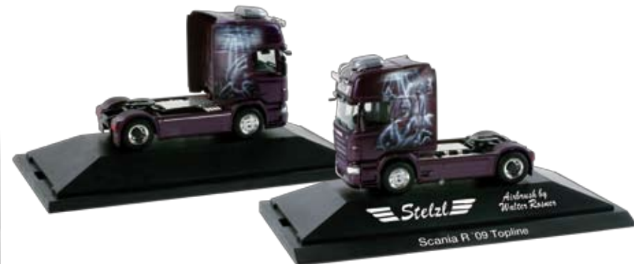
110402 | Scania R '09 Topline Zugmaschine „Stelzl“ 29,50 € H0 1/87 PC A Airbrush Design by Walter Rosner Walter Rosner hat für die Spedition Stelzl aus dem fränkischen Heideck eine Scania R '09 Topline Zugmaschine gestaltet. Die in violettmetallisch gehaltene Zugmaschine ist beidseitig mit künstlerischen Airbrush-Motiven gestaltet. Das Unternehmen Stelzl setzt über 20 Fahrzeuge im Italienverkehr ein. / For the forwarder Stelzl from Heideck, Franconia, Walter Rosner has designed a Scania R Topline tractor. The rigid tractor in violet metallic features different motifs on both sides. Stelzl operates over 20 vehicles for traffic to Italy.