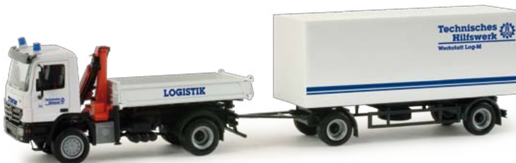
048958 | Mercedes-Benz Actros S Allradkipper mit Wechselkoffelhänger / Mercedes-Benz Actros S 4-wheel dump truck with semi van trailer „THW“ 24,50 € HO 1/87 F Zweiachsiger Mercedes-Benz Allradkipper mit Ladekran mit zweiachsigem Wechselkoffer-Anhänger für Materialtransporte im aktuellen Design des THW. / Two-axle Mercedes-Benz all-wheel dumper with loading crane and two-axle interchangeable box trailer for material transports in the current design of the THW (German Federal Agency for Technical Relief).