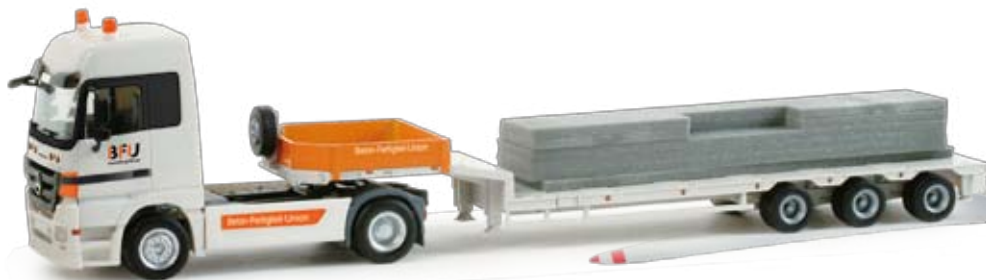
158091 | Mercedes-Benz Actros LH '08 Semitielflade-Sattelzug mit Hausteilen / Mercedes-Benz Actros LH '08 semi low boy trailer with load „BFU“ 34,50 € H0 1/87 F A Formneuheit! Mit den Betonteilen für die Zwischendecke ist der Tieflade-Sattelzug der Firma BFU beladen. Mit diesem Ladegut lässt sich das Herpa Einfamilienhaus weiter vervollständigen. / New type! The low-boy semitrailer of BFU is loaded with the concrete components for the intermediate ceiling. With this load, the Herpa family home can be further advanced.