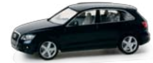
034043 | Audi Q5® 10,50 € HO 1/87 blaumetallic / blue metallic