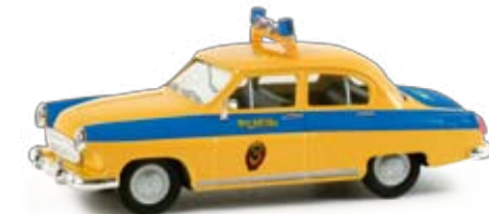
048897 | Volga M 21 „Verkehrspolizei“ 12,50 € H0 1/87 Die Verkehrspolizei in Russland hat den Volga M 21 bis in die 1990er Jahre eingesetzt. Das Modell besticht durch seine auffällige Farbgebung. / The traffic police in Russia operated this Volga M 21 in a flashy design until the 1990s. The model captivates by its coloring. ⚡