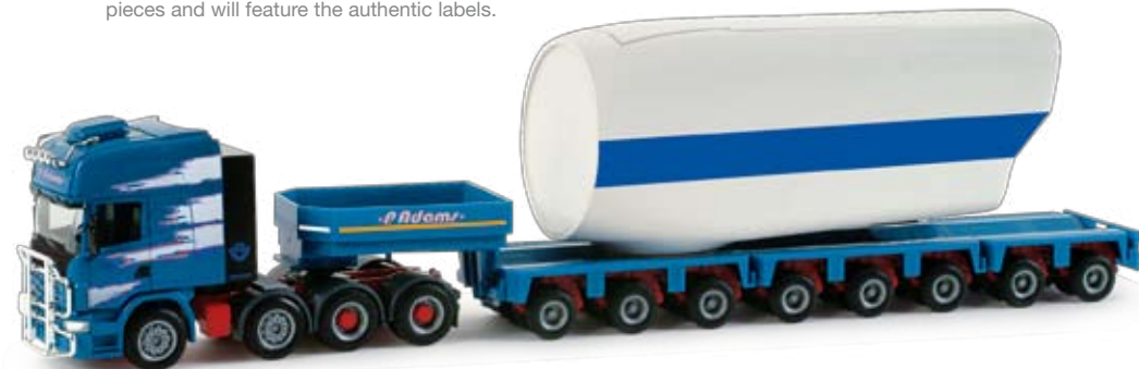
158077 | Scania R TL Tieflade-Sattelzug mit Turbinengehäuse / Scania R TL low boy trailer with turbine housing 49,50 € H0 1/87 F A Formneuheit! Herpa bringt eine komplette Windkraftanlage mit einer Gesamthöhe von 110 cm! Zunächst erscheint das Turbinengehäuse als Ladegut auf einem Modell der Belgischen Spedition P. Adams. Die Scania Zugmaschine ist mit einem neuen, geschlossenen Schwerlastturm ausgestattet. Es werden P. Adams Schwerlast-Modelle mit allen weiteren Komponenten und später ein Ergänzungssatz mit Motor und Beleuchtung folgen. / New type! Herpa releases an entire wind power station with a total height of 110 cm. To start with, we release the turbine housing as load on a model of the Belgian forwarding company P. Adams. The Scania tractor is equipped with a new, closed heavy duty tower. P. Adams heavy load models with all other components as well as an accessories set with motor and lighting will follow.