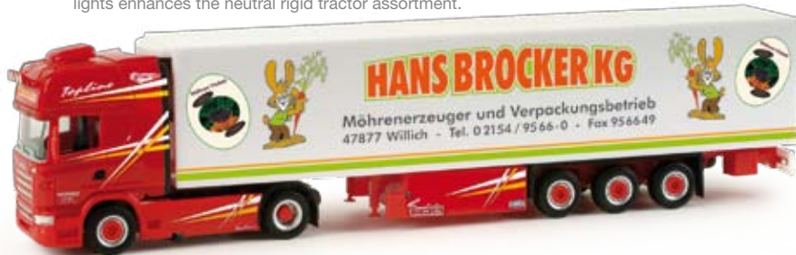
158046 | Scania R '09 TL Kühlkoffer-Sattelzug / Scania R '09 TL refrigerated box semitrailer „Brockner“ 29,50 € HO 1/87 | Mehr als 20 dieser auffälligen Sattelzüge setzt die Firma Brockner bundesweit für den Transport von Bio- und Lagermöhren ein. Das Modell wird vorbildgerecht sehr aufwändig bedruckt. / The Brockner company operates over 20 of these flashy semitrailers nationwide to transport organic carrots and carrots for storage. The model features the elaborate authentic prints.