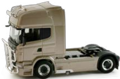
158008 | Scania R '09 Topline 730 Zugmaschine mit Zubehör, 16,00 € HO 1/87 | perlbeige metallic / Scania R '09 Topline 730 rigid tractor with accessories, pearl beige metallic Mit reichlich Zubehör ergänzt die aktuelle Scania R Topline Zugmaschine in der Topversion mit 730 PS, ausgestattet mit Rammenschutz, Chromfelgen und Topleuchten, das Sortiment der neutralen Zugmaschinen. / The current Scania R Topline tractor in the top version with 730HP equipped with fender, chrome rims and top lights enhances the neutral rigid tractor assortment.