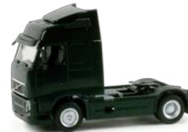
158022 | Volvo FH GL Zugmaschine, tannengrün 11,50 € HO 1/87 | Volvo FH GL rigid tractor, fir green Die aktuelle Volvo Globetrotter Zugmaschine mit niedrigerem Fahrerhaus ergänzt das Sortiment der Solozugmaschinen. The current Volvo Globetrotter tractor with lowered driver's cabin enhances the rigid tractor assortment.