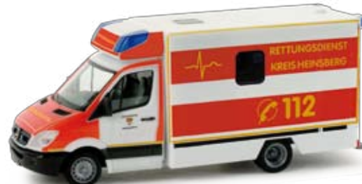
048941 | Mercedes-Benz Sprinter Fahrtec RTW 16,50 € H0 1/87 Mercedes-Benz Sprinter Fahrtec MICU „Rettungsdienst Heinsberg“ Der Rettungsdienst in Heinsberg im Dreiländereck D/B/NL setzt diesen Mercedes-Benz Sprinter mit Fahrtec-Aufbau ein. Das Modell ist vorbildgerecht am Heck mit einem auffälligen Streifendesign großflächig in gelb und rot bedruckt. / The rescue service in Heinsberg in the border triangle G/B/NL operates this Mercedes-Benz Sprinter with Fahrtec body. At the rear, the model features the original's flashy large-scale stripe design in yellow and red. ⚡