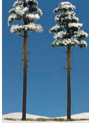
H0 6156 2 verschneite Kiefern 195 und 210 mm hoch