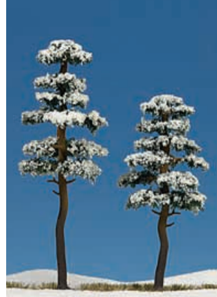
H0 6155 2 verschneite Kiefern 130 und 160 mm hoch