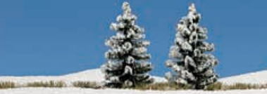
H0 6152 2 verschneite Fichten 90 und 120 mm hoch