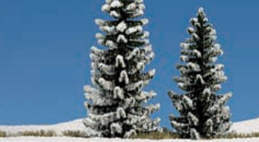
H0 6152 2 verschneite Fichten 90 und 120 mm hoch