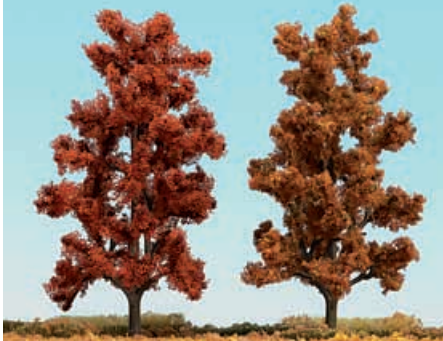
H0 6755 2 Laubbäume 150 mm hoch