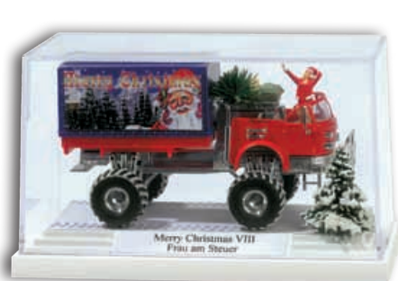
»Frau am Steuer«