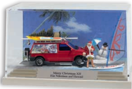
»Ein Nikolaus auf Hawaii«