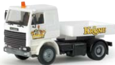
155816 | Scania 112 M Zugmaschine mit Ballastpritsche „Circus Krone“ 14,50 € Scania 112 M tractor with ballast platform Circus Krone Weiße Circus Krone-Zugmaschine mit Nilpferd-Motiv auf dem Pritschenheck / White Circus Krone-tractor with hippopotamus motif on the platform's rear end