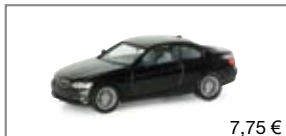
023924 | BMW 3er Coupé™, std. 7,75 €