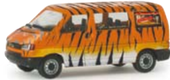
048170 | VW T 4 Bus „Circus Journal“ 13,50 € Fahrzeug des GIO-Verlag (Circus Journal), anzutreffen bei allen namhaften Circus-Gastspielen in Deutschland / Vehicle of the GIO-publishing house (Circus Journal), frequently represented at all well-known circus performances in Germany