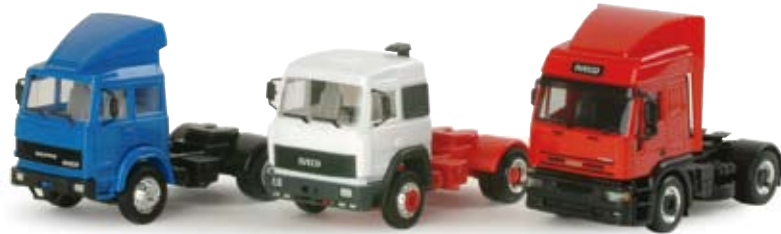
155724 | Zugmaschinen-Set „Iveco Magirus“ / Rigid tractor set „Iveco Magirus“ 36,50 € Set mit Iveco Turbo, Iveco Turbostar und Iveco Eurotech Zugmaschine. Limitierte Auflage 750 Stück / Set including Iveco Turbo, Iveco Turbostar and Iveco Eurotech tractor. Limited Edition of 750 pcs