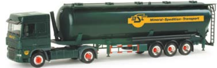
155755 | DAF XF 105 SC Silo-Sattelzug 60m³ „MST“ 24,50 € DAF XF 105 SC silo container semitrailer 60m³ “MST” Aktueller DAF XF 105 der Spedition MST aus Frechen, Tochtergesellschaft der Spedition Freund Current DAF XF 105 of the forwarding company MST from Frechen, subsidiary of the forwarding company Freund