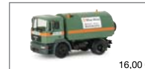
154895 | MAN F2000 Kehrmaschine „Max Wild“ 16,00 €