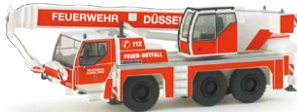
155632 | Liebherr Mobilkran „FW Düsseldorf“ 39,50 € Liebherr mobil crane "FW Düsseldorf" Formneuheit! Die Traverse an der Front, Staukästen und Leiter an der rechten Fahrzeugseite sowie ein Staukasten und eine Abdeckung am Fahrzeugheck wurden für die Feuerwehr-Variante des Liebherr Kran vorbildgerecht reproduziert. Dieses Modell erscheint im typischen weiß-leuchtroten Design der Feuerwehr Düsseldorf und wird ohne Gittermast ausgeliefert / Mold novelty! The traverse at the front, stow boxes and ladder on the right vehicle side, as well as one stow box and one covering in the rear were reproduced onto the original for the fire brigade variant of the Liebherr crane. This model is released in the typical white/luminous-red design of the fire brigade Düsseldorf and will be delivered without lattice jib