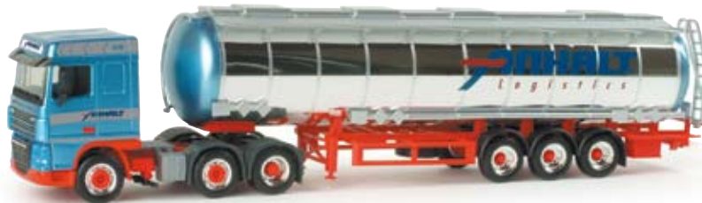
155779 | DAF XF 105 SC Chromtank-Sattelzug „Anhalt“ 29,50 € DAF XF 105 SC chromium tank semitrailer “Anhalt” Sechssachsiger Tanksattelzug nach Vorbild der Spedition Anhalt aus Rehm-Flehe-Bargen westlich von Rendsburg / Six-axle tank semitrailer based on the forwarding company Anhalt from Rehm- Flegde-Bargen, west of Rendsburg