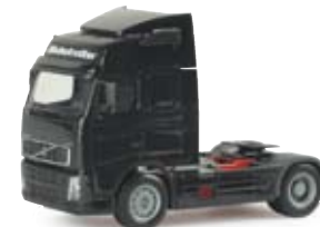
149365 | Volvo GL Zugmaschine, 2a schwarz / black 11,00 €