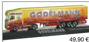
121132 | Scania R TL Schubboden Szg „Godelmann“ PC 49,90 €