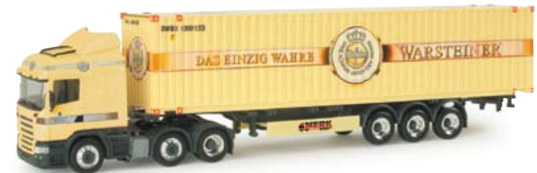
155878 | Scania R HL Container-Sattelzug „Warsteiner“ 27,50 € Scania R HL container semitrailer “Warsteiner” Scania R Highline 3-achs Zugmaschine mit 45ft. Containeraufleger der Brauerei Warsteiner. Container und Zugmaschine aufwändig mehrfarbig bedruckt / Scania R Highline 3-axe tractor with 45ft container trailer of the brewery Warsteiner. Container and tractor imprinted elaborately and with multiple colors