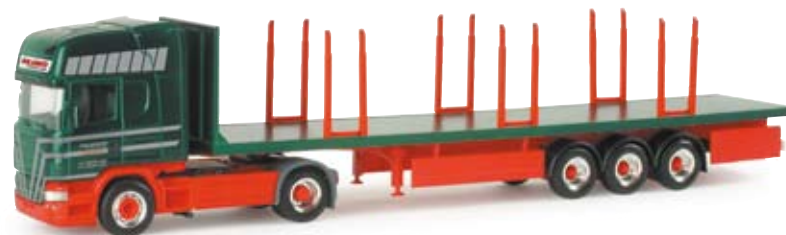
155809 | Scania R TL Rungen-Sattelzug „Kay Schultz“ 28,50 € Scania R TL stake semitrailer “Kay Schultz” Aufwändig lackiertes und bedrucktes Modell der Spedition Kay Schultz aus Eggebek, erstmals mit aufwändig lackiertem Rungenaufleger. Limitierte Edition 1.000 / Elaborately designed and printed model of the forwarder Kay Schultz from Eggebek, premiering an elaborately painted flatbed trailer. Limited of 1.000 pcs