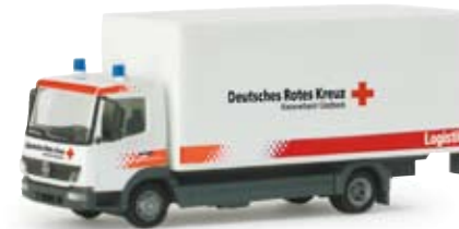
155823 | MB Atego 04 Koffer-LKW „DRK Gladbeck“ 19,50 € MB Atego 04 box truck „DRK Gladbeck“ Transportfahrzeug des DRK Gladbeck (NRW) mit auffälligem Design und beweglicher Ladebordwand Transport vehicle of the DRK Gladbeck (NRW) with striking design and movable liftgate