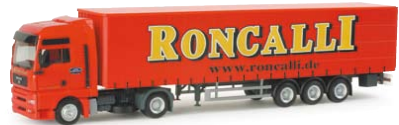
155892 | MAN TGA XXL Gardinenplanen-Sattelzug „Circus Roncalli“ 24,50 € MAN TGA XXL curtain canvas semitrailer "Circus Roncalli" Der MAN TGA Sattelzug des Circus Roncalli transportiert eine Wanderausstellung des Circus The MAN TGA semitrailer of the Circus Roncalli which transports a touring exhibition of the Circus