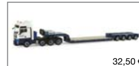
155069 | MAN TGX Pendel-X Sattelzug „Breuer & Wasel“ 32,50 €