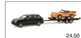
289580 | Porsche Cayenne mit 911 Turbo „Jägermeister“ 24,50 €