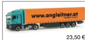
155038 | MAN TGX Gardinenplanen- Sattelzug „Angleitner“ 23,50 €