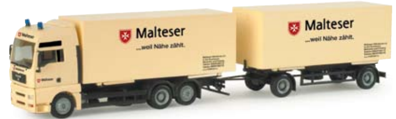
155717 | MAN TGA XXL Wechselkoffer-Hängerzug „Malteser Freising“ 24,50 € MAN TGA XXL interchangeable box trailer „Malteser Freising“ Die Malteser in Freising setzen diesen MAN Hängerzug mit Wechselkoffern für den Transport von Hilfsgütern nach Osteuropa ein / The Malteser in Freising operate this MAN trailer with interchangeable boxes to transport relief items to Eastern Europe