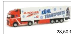
155052 | Volvo FH Kühlkoffer- Sattelzug „Kogler“ 23,50 €