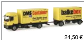
155014 | MB Actros Container- Hängerzug „DMS Balke“ 24,50 €