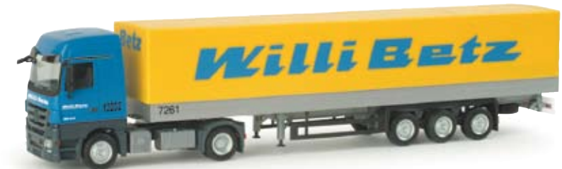
155854 | MB Actros LH 08 Planen-Sattelzug „Willi Betz“ 24,50 € MB Actros LH 08 canvas semitrailer “Willi Betz” Neue MB Actros LH MP3 Zugmaschine mit Planenaufleger der Spedition Betz aus Reutlingen / New MB Actros LH MP3 tractor with canvas-cover trailer of the forwarding company Betz from Reutlingen