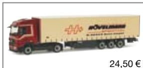
155236 | MB Actros 08 Gardinen- planen-Sattelzug „Hövelmann“ 24,50 €