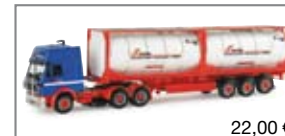
154864 | MB SK Container-Szg „Riwatrans“ 22,00 €