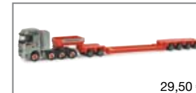
155229 | MB Actros Tieflade-Sattelzug „Bender“ 29,50 €