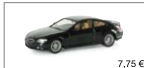
023931 | BMW 6er Coupé™, std. 7,75 €