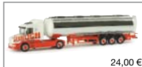
155045 | Scania Hauber Chromtank- Sattelzug „Röhlich“ 24,00 €