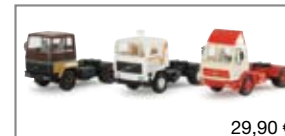
289528 | LKW-Set 30 Jahre Miniatur- modelle von Herpa 29,90 €