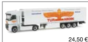
155342 | Renault Magnum Kühlkoffer- Sattelzug „Tur Abdin“ 24,50 €