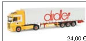
155274 | Scania R HL Gardinen- planen-Sattelzug „Dudler“ 24,00 €