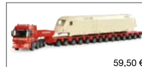
280341 | MB Actros Schwerlast- Sattelzug „Markewitsch“ 59,50 €