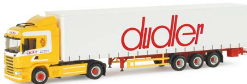
155274 | Scania R HL Gardinenplanen-Sattelzug „Dudler“ (CH) Scania R HL curtain canvas semitrailer “Dudler” (CH) Modell der Spedition Dudler aus Altenrhein in der Schweiz Model from the forwarding company Dudler from Altenrhein in Switzerland