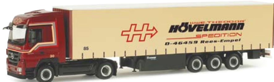
155236 | MB Actros LH 08 Gardinenplanen-Sattelzug „WWE. TH Hövelmann“ MB Actros LH 08 curtain canvas semitrailer “WWW. TH Hövelmann” Neuer MB Actros der Spedition Hövelmann aus Rees am Niederrhein New MB Actros from the forwarding company Hövelmann from Rees at the Lower Rhine