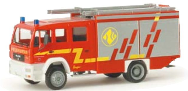
048033 | MAN LE 2000 LF 20/16 „Feuerwehr Herzogenrath“ MAN LE 2000 LF 20/16 „Feuerwehr Herzogenrath“ Löschfahrzeug der Feuerwehr Herzogenrath bei Aachen Fire engine of the fire brigade Herzogenrath near Aachen 16,50 €