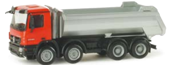
155205 | MB Actros S 08 Rundmuldenkipper MB Actros S 08 dumper Neuer MB Actros S 2008 / Ergänzung der Baufahrzeugserie New MB Actros S 2008 / Addition to the construction vehicle series 16,00 €