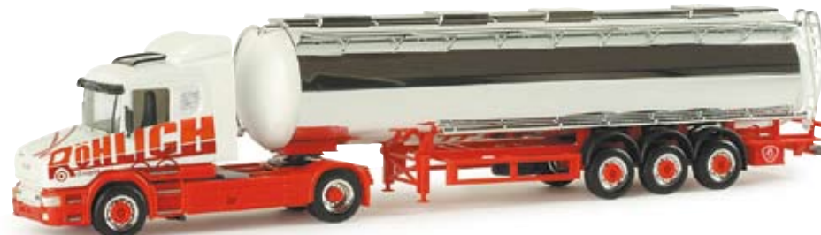
155045 | Scania Hauber Chromtank-Sattelzug „Röhlich“ Scania Hauber chromium plated semitrailer “Röhlich” Röhlich GmbH aus Marktoberdorf nahe Kaufbeuren Röhlich GmbH from Marktoberdorf near Kaufbeuren