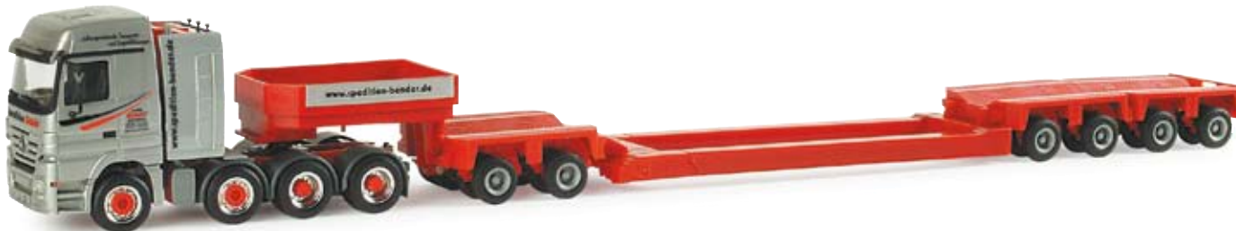
155229 | MB Actros Titan Tieflade-Sattelzug „Bender“ MB Actros Titan low boy semitrailer “Bender” MB Actros LH Titan der Spedition Bender aus Freudenberg MB Actros LH Titan from the forwarding company Bender from Freudenberg 29,50 €