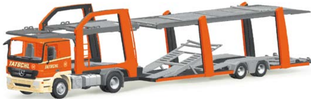
155182 | MB Actros L 08 Lohr Autotransporter „Tatschl“ (A) MB Actros L 08 Lohr car transporter “Tatschl” (A)