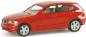
023290 | BMW 1er™ standard rubinrot / ruby red 7,25 €