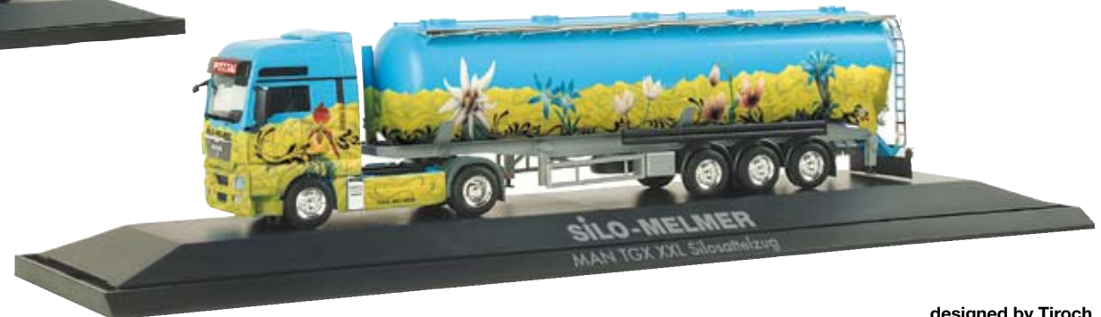
121125 | MAN TGX XXL Silo-Sattelzug „Melmer/Alpenblumen” (A) / MAN TGX XXL silo semitrailer “Melmer/Alpenblumen” (A)