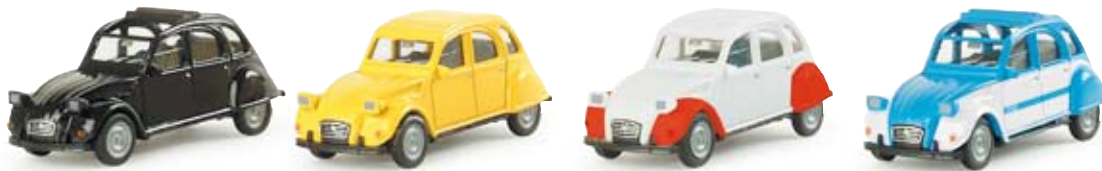
290982 | Set „60 Jahre Ente“ Set zum 60sten Jubiläum der Citroen 2 CV mit vier Modellen Set containing four models for the Citroen 2 CV's 60th anniversary 29,95 €