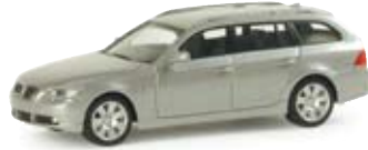
033268 | BMW 5er Touring™ metallic hell Silber / brilliant silver 8,00 €