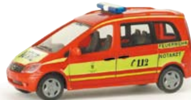
047937 | MB Vaneo „Feuerwehr München“ Notarzteinsetzfahrzeug der Berufsfeuerwehr München Emergency ambulance from the municipal fire brigade Munich 11,50 €