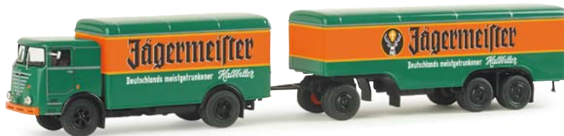
155243 | Büssing LU 11/16 Koffer-Hängerzug „Jägermeister“ Büssing LU 11/16 box trailer “Jägermeister” Büssing LU 11/16 mit Kofferaufbauten nach Vorbild im Jägermeister-Design Büssing LU 11/16 with box body in Jägermeister design 22,50 €