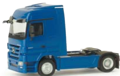
155168 | MB Actros LH 08 Solozugmaschine MB Actros LH 08 rigid tractor