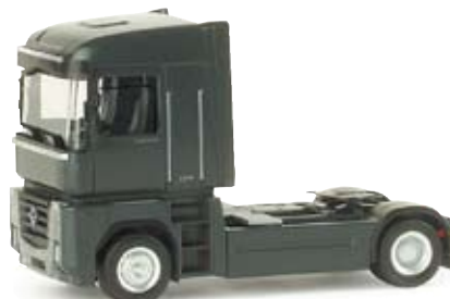
155199 | Renault Magnum 08 Solozugmaschine Renault Magnum 08 rigid tractor