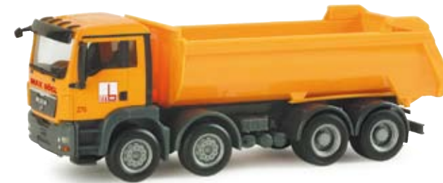
155151 | MAN TGS M Rundmulden-LKW „Max Bögl“ MAN TGS M dump truck „Max Bögl“ Neuer MAN TGS der Firma Max Bögl Latest MAN TGS of the Max Bögl company