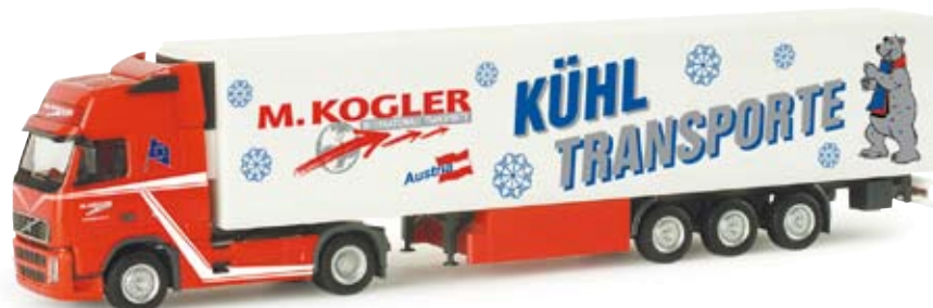
155052 | Volvo FH GI XL Kühlkoffer-Sattelzug „Kogler Kühltransporte“ (A) Volvo FH GI XL refrigerated box semitrailer “Kogler Kühltransporte” (A) Transportunternehmen aus Kirchbichl (A) mit Niederlassung in Gornau / Sachsen Forwarding company from Kirchbichl (Austria) with subsidiary in Gornau / Saxony