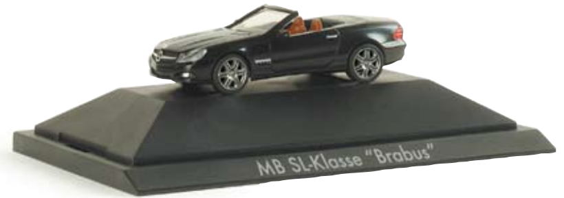
101844 | Mercedes-Benz SL-Klasse „Brabus“ New MB SL-class in Brabus design 16,50 €