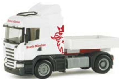
155311 | Scania R HL Zugmaschine „Circus Krone“ Scania R HL rigid tractor „Circus Krone“ Aktuellste Zugmaschine des Circus Krone Latest tractor of the Circus Krone