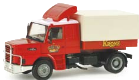
155250 | Scania Hauber Zugmaschine „Circus Krone“ Scania Hauber generation rigid tractor „Circus Krone“ Ergänzung der Circus Krone Serie Addition to the Circus Krone series