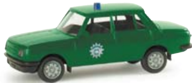
047975 | Wartburg 353 '85 „Polizei Grenzschutzdienst Ost“ Nachwendefahrzeug des Grenzschutzdienst Post-Wende-vehicle of the border patrol 10,00 €