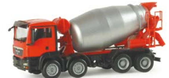
155298 | MAN TGS M Betonmischer-LKW MAN TGS M concrete mixer truck Ergänzung der Baufahrzeugserie Addition to the construction vehicle series 16,50 €