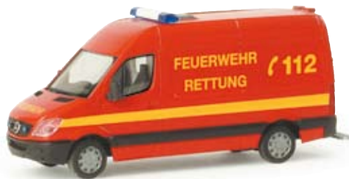
048026 | MB Sprinter 06 RTW Feuerwehr (neutral) Ergänzung der neutralen Feuerwehr-Serie Addition to the neutral fire brigade series 11,00 €