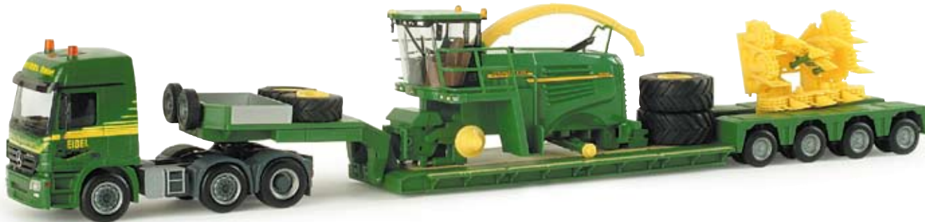
155137 | MB Actros L 02 Tieflade-Sattelzug „Spedition Eibel“ mit John Deere Feldhächsler MB Actros L 02 low boy semitrailer “Spedition Eibel” with John Deere field chopper Partnerunternehmen von John Deere mit Sitz in Budenbach / Rheinland Pfalz Partner company of John Deere with headquarters in Budenbach / Rhineland-Palatinate 69,50 €