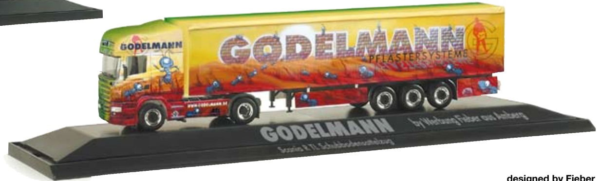
121132 | Scania R TL Schubboden-Sattelzug „Godelmann” / Scania R TL walking floor semitrailer “Godelmann”