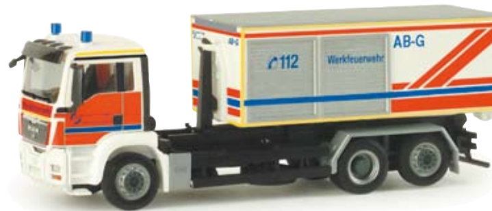
047944 | MAN TGS M Abrollcontainer-LKW „Werkfeuerwehr Salzgitter“ MAN TGS M roll-of container truck Werkfeuerwehr Salzgitter“ Wechselladerfahrzeug der Werkfeuerwehr der Salzgitter AG Interchangeable loading system from the Salzgitter AG's plant fire brigade 17,50 €