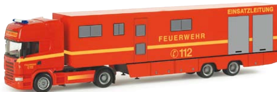
155120 | Scania R TL Koffer-Sattelzug ELW 3 „Feuerwehr“ Scania R TL box semitrailer ELW 3 „Feuerwehr“ Ergänzung der neutralen Feuerwehr-Serie Addition to the neutral fire brigade series