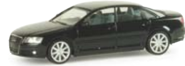
033367 | Audi A8® Limousine metallic tiefgrünperleffekt / deep green pearl effect 8,50 €