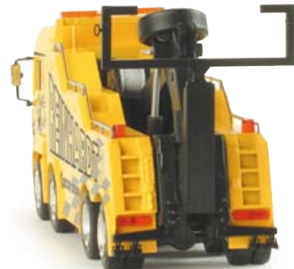
155175 | MAN TGA LX Empl Wrecker „Reinhardt“ MAN TGA LX Empl Wrecker „Reinhardt“