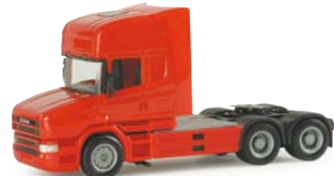
151726 | Scania Hauber Topline Zugmaschine rot / red 11,00 €