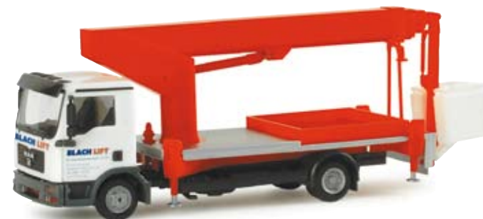
155281 | MAN TGL Hubsteiger „Blach Lift“ MAN TGL Hubsteiger „Blach Lift“ MAN TGL Hubsteiger der Firma Blach aus Ansbach MAN TGL tower ladder from the Blach company from Ansbach