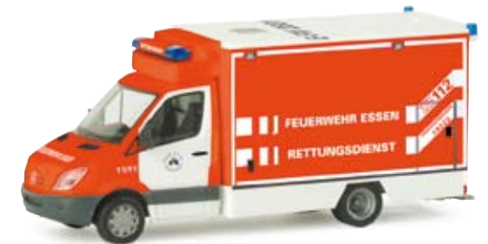
047982 | MB Sprinter 06 RTW „Feuerwehr Essen“ Neuer Fahrtec RTW der Feuerwehr in Essen (NRW) New RTW of the fire brigade in Essen (NRW) 16,50 €