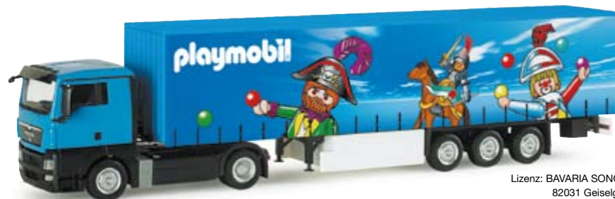
154710 | MAN TGX XL Gardinenplanen-Sattelzug "Playmobil" 24,50 € MAN TGX XL curtain canvas semitrailer "Playmobil" Der erste von verschiedenen Transportfahrzeugen der Playmobil aus Dietenhofen / The first of several transportation vehicles of Playmobil from Dietenhofen