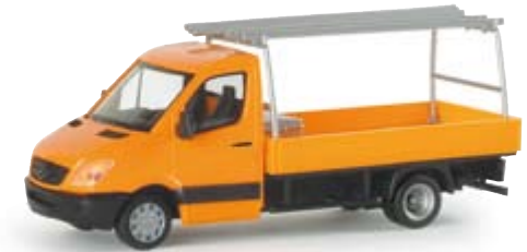
047814 | MB Sprinter 06 Pritsche mit Aufbau/Ladung 14,50 € MB Sprinter 06 Pick-up with load MB Sprinter 06 Pritsche mit Zwillingbereifung, neuen Aufbauten und Ladung (Leiter, Rohre, Kiste, Schaufel, Besen) MB Sprinter 06 pick-up with double tires and new super- structure and cargo (ladder, pipes, box, shovel, broom)