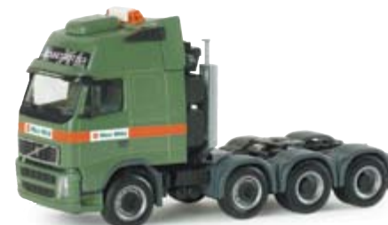
154901 | Volvo FH Gl. XL Zugmaschine "Max Wild" 16,50 € Volvo FH Gl. XL rigid tractor "Max Wild" 4-achsige Solozugmaschine der Spedition Max Wild aus Berkheim / 4-axle rigid tractor of the forwarding company Max Wild from Berkheim