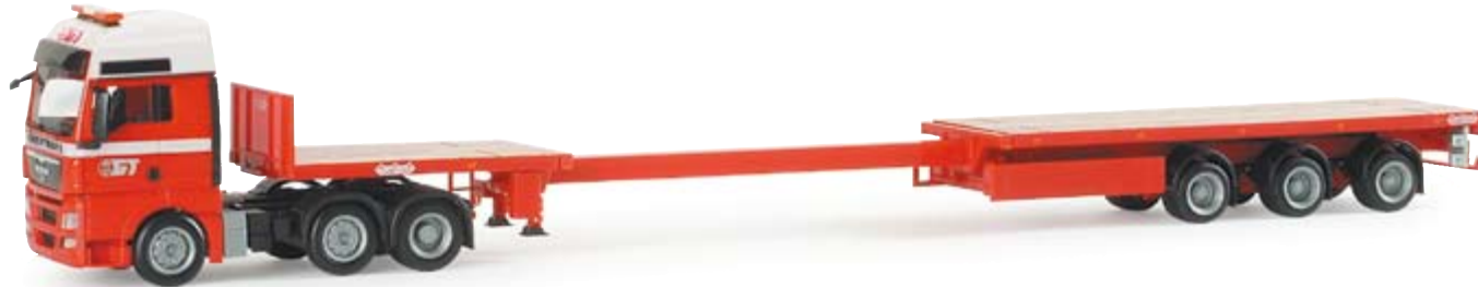
154826 | MAN TGX XXL Teletrailer-Sattelzug "Geertrans" (B) 32,50 € MAN TGX XXL teletrailer semitrailer "Geertrans" (B) Geertrans ist ein Tochterunternehmen der Essers Group aus Belgien / Geertrans is a subsidiary of the Belgian Essers Group