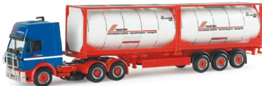
154864 | MB SK '94 HD Container-Sattelzug "Riwatrans" 2x20 ft. Tankcontainer 22,00 € MB SK '94 HD container semitrailer "Riwatrans" 2x20 ft. tank container MB SK '94 Hochdach Zugmaschine mit 2x20 ft. Tankcontainer / MB SK '94 with raised roof tractor with 2x20ft. tank trailer