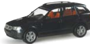
033220 | BMW X3™ metallic 7,25 € schwarzmetallic / black metallic