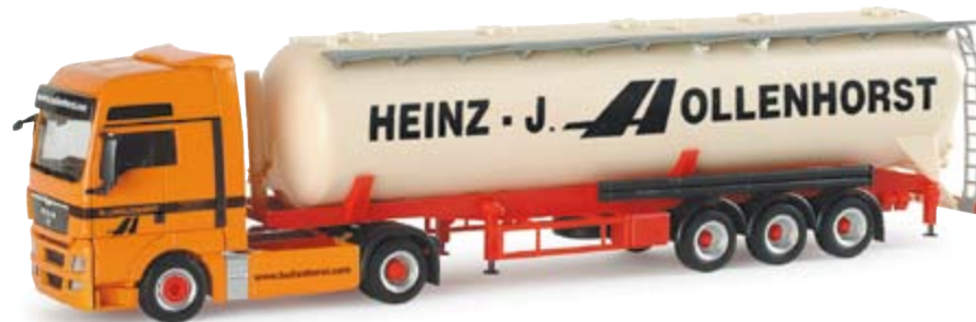
154833 | MAN TGX XXL Silo-Sattelzug "Hollenhorst" 23,50 € MAN TGX XXL silo semitrailer "Hollenhorst" Spedition Hollenhorst aus Appelhülsen bei Münster, erster MAN TGX XXL der Spedition mit Siloauffieger Forwarding company Hollenhorst from Appelhülsen near Münster, the company's first MAN TGX XXL with silo trailer