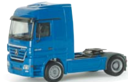
152952 | MB Actros LH Chromline 11,00 € Zugmaschine verkehrsblau / traffic blue