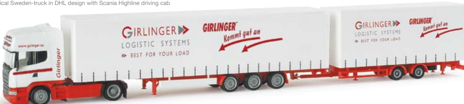
154802 | Scania R TL Gigaliner-Sattelzug "Girlinger" 32,50 € Scania R TL Gigaliner semitrailer "Girlinger" Gigaliner der Spedition Girlinger aus Völklingen bei Saarbrücken / Gigaliner of the forwarding company Gerlinger from Völklingen near Saarbrücken

DHL ist eine eingetragene Marke der DHL International GmbH/DHL Operations B.V.