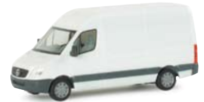
047081 | MB Sprinter 06 Kasten Hochdach 7,75 € weiß / white