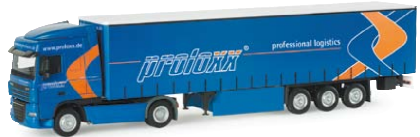
154789 | DAF XF 105 SC Gardinenplanen-Sattelzug "ProloxX" 23,50 € DAF XF 105 SC curtain canvas semitrailer "ProloxX" ProloxX Spedition aus Crimmitschau bei Zwickau setzt MB und DAF bundesweit ein / forwarding company ProloxX from Crimmitschau near Zwickau operates MBs and DAFs Germany-wide