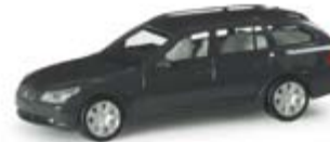
023269 | BMW 5er™ Touring standard 6,75 € anthrazit / anthracite