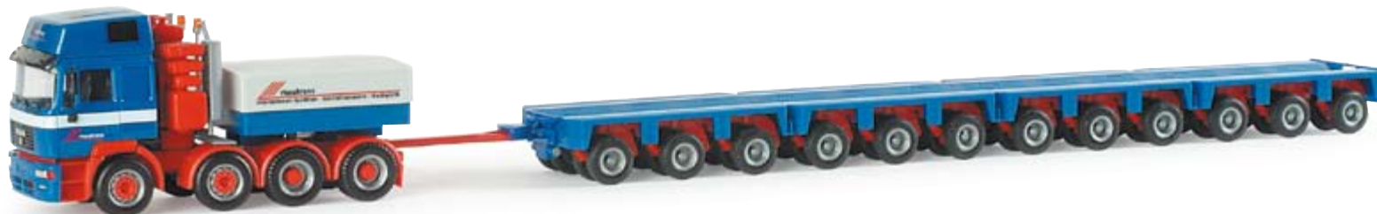
154857 | MAN F2000 Schwerlast-Sattelzug "Riwatrans" 29,50 € MAN F2000 low-boy semitrailer "Riwatrans" MAN E 2000 EVO Zugmaschine mit 12 gezogenen Goldhofer Achslinien / MAN E 2000 tractor with 12 trailed Goldhofer axles