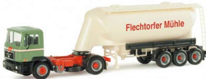
154796 | MAN F 90 Eutersilo-Sattelzug "Wandt" 23,50 € MAN F 90 bulk semitrailer "Wandt" Modell eines Fahrzeugs der Spedition Wandt aus den 80er Jahren mit Siloaufleger / 80s model with silo trailer from the forwarding company Wandt