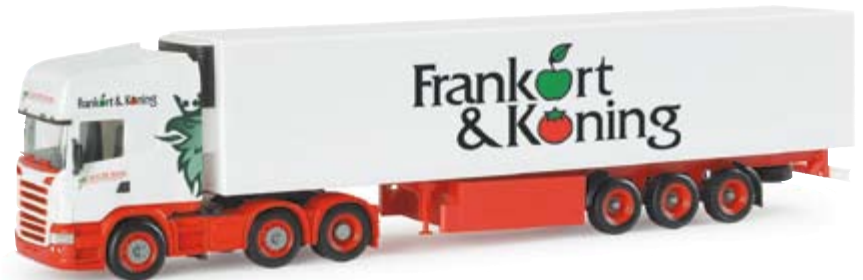
154680 | Scania R TL Kühlkoffer-Sattelzug "De Waal" (NL) 27,50 € Scania R TL refrigerated box semitrailer "De Waal" (NL) Spedition De Waal aus Heeswijk / NL fährt mit sechs Zügen Früchte für Frankort und Koning in Europa six truck-trailer combinations of the forwarding company De Waal from Heeswijk / NL which transport fruit for Frankort and Koning in Europe