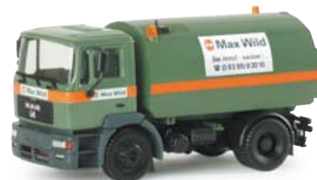
154895 | MAN F2000 Kehrfahrzeug "Max Wild" 16,00 € MAN F2000 road sweeper "Max Wild" Kehrfahrzeug für Baustellen der Fa. Max Wild aus Berkheim / street cleaner for construction sites of the Max Wild company from Berkheim