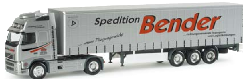
154819 | Volvo FH Gl. XL Gardinenplanen-Sattelzug "Bender" 24,50 € Volvo FH Gl. XL curtain canvas semitrailer "Bender" Spedition Bender aus Freudenberg (Sauerland), weiteres Modell folgt in 2008 / Forwarding company Bender from Freudenberg (Sauerland), another model will follow in 2008