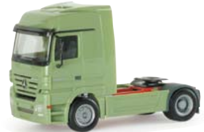
148795 | MB Actros LH Zugmaschine 11,00 € lindgrün / green