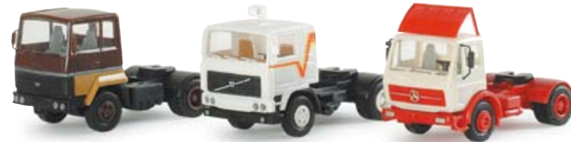
289528 | Zugmaschinen-Set "30 Jahre Miniaturmodelle von Herpa" 29,90 € Set mit drei der ersten Zugmaschinen von Herpa mit den ersten LKW-Felgen / Set with three of the first Herpa tractors with the first truck rims