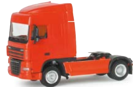
154703 | DAF XF105 SC Zugmaschine 11,00 € DAF XF105 SC rigid tractor Solozugmaschine der neuen DAF 105 Space Cab / rigid tractor of the new DAF 105 Space Cab