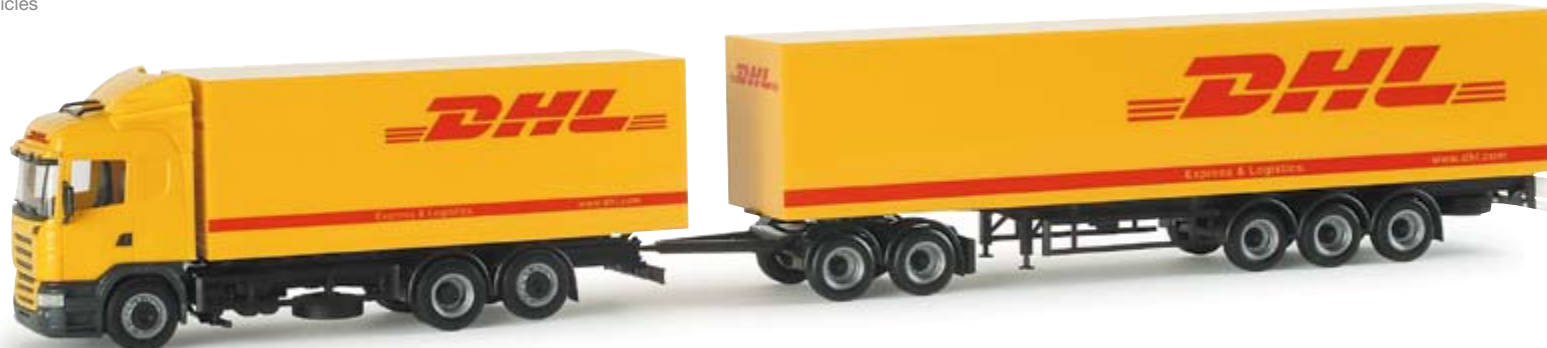
154697 | Scania HL Koffer-Hängerzug "DHL" (S) 32,50 € Scania HL box trailer "DHL" (S) Typischer Schwedenzug im Design von DHL mit Scania Highline Fahrerhaus / Typical Sweden-truck in DHL design with Scania Highline driving cab

DHL ist eine eingetragene Marke der DHL International GmbH/DHL Operations B.V.