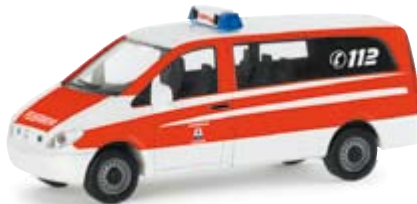
047852 | MB Vito VRW "Feuerwehr Itzehoe" 11,00 € Vorausrüstwagen der Feuerwehr in Itzehoe / forward rescue vehicle of the municipal fire brigade Itzehoe