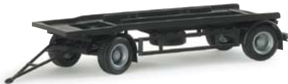
076289 | Anhänger für Abrollbehälter 8,25 € Trailer for roll-off container Soloanhänger für den Transport von Abrollbehältern rigid tractor for container transport