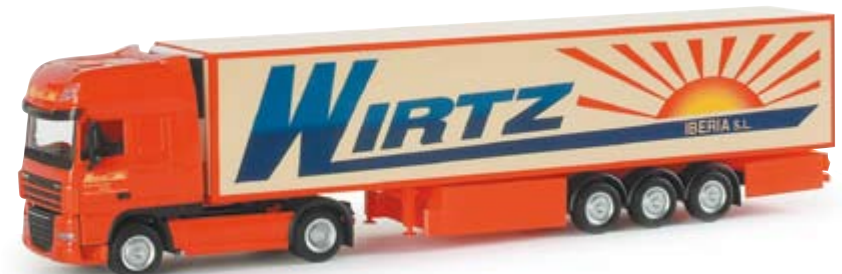
154727 | DAF XF 105 SSC Kühlkoffer-Sattelzug "Wirtz Iberia" (E) 24,50 € DAF XF 105 SSC refrigerated box semitrailer "Wirtz Iberia" (E) Tochtergesellschaft der Spedition Wirtz aus Bornheim mit Sitz in Spanien / Subsidiary of the forwarding company Wirtz from Bornheim with headquarters in Spain