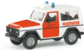
047845 | MB G-Modell "Feuerwehr Stuttgart" 11,00 € Einsatzleitwagen der Berufsfeuerwehr Stuttgart operation control vehicle of the municipal fire brigade Stuttgart