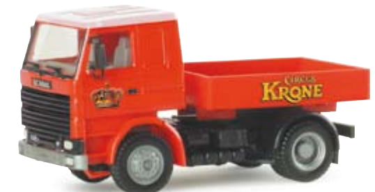
154925 | Scania 142 Zugmaschine "Circus Krone" 14,50 € Scania 142 rigid tractor "Circus Krone" Beginn der Serie Circus Krone, Scania 142 Zugmaschine mit Ballastpritsche / Beginning of the Circus Krone series, Scania 142 tractor with ballast pick-up