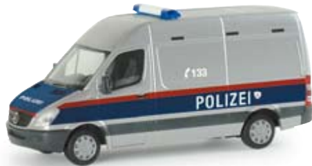
047807 | MB Sprinter Bus "Polizei" (A) 12,25 € Gefangenentransportfahrzeug der Österreichischen Polizei prisoner transport vehicle of the Austrian police