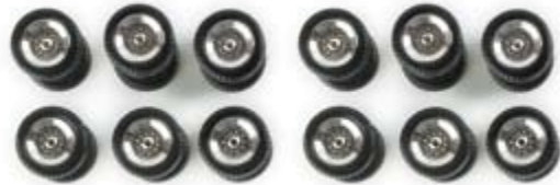
052702 | Radsätze Meusburger verchromt (x12) 7,25 € Wheel set Meusburger chromium plated (x12) Radsätze des Meusburger-Auflieger mit Zwillingbereifung und verchromten Felgen / wheel set of the Meusburger trailer with double tires and chromium-plated rims