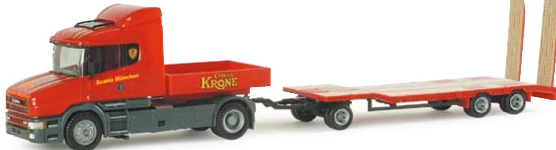
154918 | Scania Hauber Zugmaschine mit TU 3 "Circus Krone" 22,00 € Scania Hauber rigid tractor with TU 3 "Circus Krone" Beginn der Serie Circus Krone, Scania Hauber mit Goldhofer TU3 Anhänger Beginning of the Circus Krone series, Scania Hauber with Goldhofer TU3 trailer