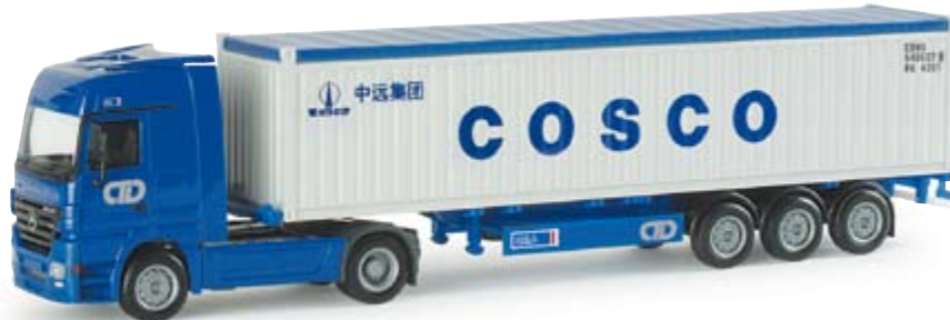
154765 | MB Actros LH 02 Container-Sattelzug 40ft. Open Top "COSCO" 23,50 € MB Actros LH 02 container semitrailer 40ft. open top "COSCO" Fahrzeug der Hamburger Firma Container Transport Dienst mit 40 ft. Open Top Container der Firma COSCO / Vehicle of the Container Transport Dienst from Hamburg with 40ft. Open Top Container from COSCO