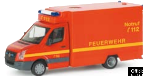
047838 | VW Crafter RTW Fahrtec "Feuerwehr" 16,50 € Ergänzung der neutralen Feuerwehr-Serie im Herpa Programm mit VW Crafter Kabine / Addition to the neutral Herpa fire brigade series with VW Crafter cabin