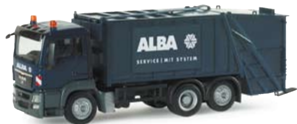
154772 | MAN TGS M Pressmüllwagen "Alba Berlin" 18,00 € MAN TGS M refused collection vehicle "Alba Berlin" Pressmüllwagen der Berliner Entsorgungsfirma Alba mit neuem MAN TGS M Fahrerhaus / garbage truck of the waste management company Alba from Berlin with new MAN TGS M driving cab