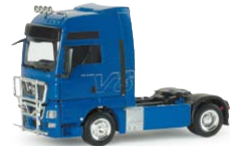
154734 | MAN TGX XXL V8 Zugmaschine mit Rammschutz 13,50 € MAN TGX XXL V8 rigid tractor with ram protection Die neue MAN TGA XXL Zugmaschine mit neuem Rammschutz und Lampenbügel the new MAN TGA XXL tractor with new ram protection and light clamps