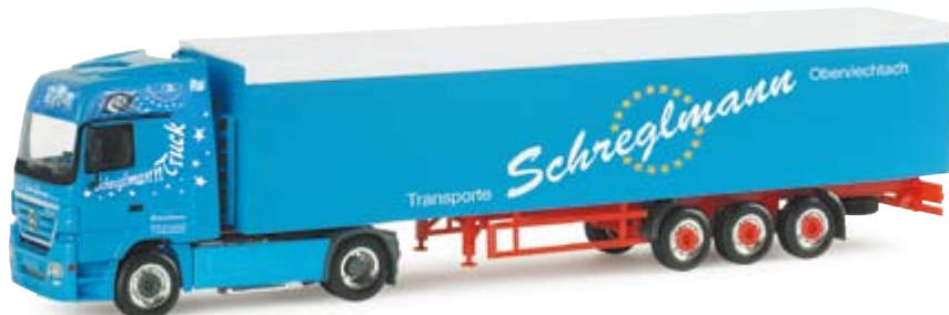
154741 | MB Actros LH 02 Schubboden-Sattelzug "Schreglmann" 24,50 € MB Actros LH 02 walking floor semitrailer "Schreglmann" Spedition Schreglmann aus Oberviechtach (Bayern), erstes Modell einer Serie aufwändiger Fahrzeuge Forwarding company Schreglmann from Oberviechtach (Bavaria), first model of a series of elaborate vehicles