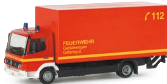
047869 | MB Atego 04 Koffer-LKW Ladebordwand "Feuerwehr" 18,00 € Aktueller MB Atego mit Kofferaufbau und Ladebordwand / Current MB Atego with box trailer and liftgate