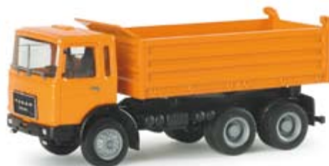
154758 | Roman Diesel Baukipper 15,00 € Roman Diesel dump trailer Roman Diesel als Baukipper mit Kögel Mulde in kommunalorange / Roman Diesel as construction site dumper with Kögel trough in municipal orange