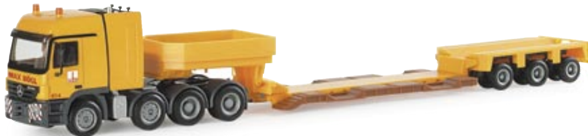
154024 | MB Actros L 02 TITAN Schwerlast-Sattelzug "Bögl" MB Actros L 02 TITAN heavy duty semitrailer "Bögl" www.herpa.de?154024