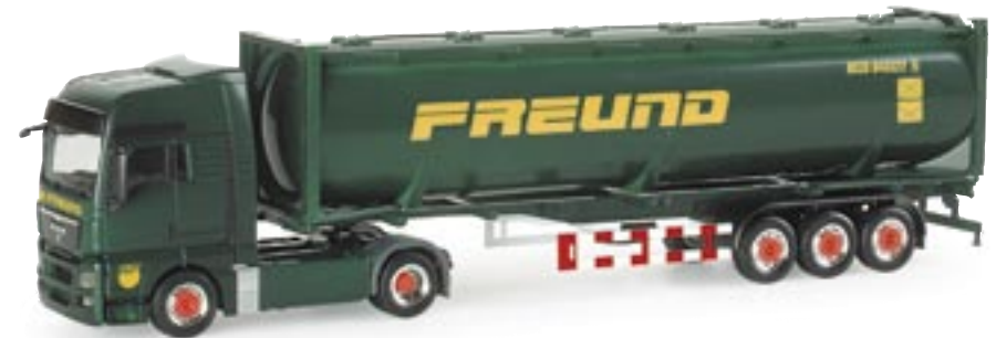
153867 | MAN TGX XXL 40ft. Drucksilo-Sattelzug "Freund" MAN TGX XXL 40ft. silo semitrailer "Freund" www.herpa.de?153867 neue Fahrerhausgeneration / new MAN truck generation