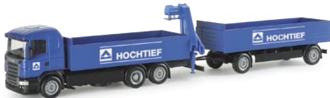
154017 | Scania R Standard Baustoff-Hängerzug mit Ladekran "Hochtief" Scania R standard pick-up trailer "Hochtief" www.herpa.de?154017