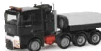
148627 | MAN TGA XL 16,00 € Schwerlast-Zugm. / schwarz www.herpa.de?148627