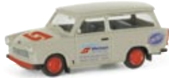
047555 | Trabant 601 Universal "Spedition Wormser" 7,75 € www.herpa.de?047555