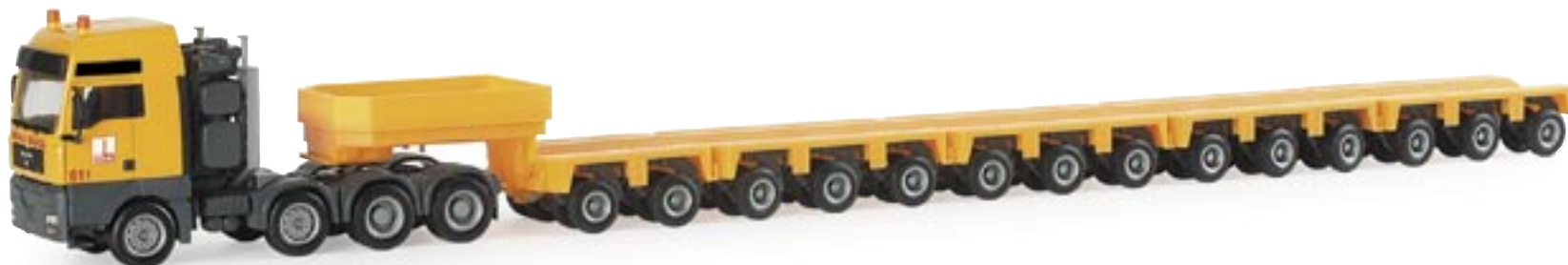
154048 | MAN TGA XXL 4a mit Schwerlast-Sattelzug "Bögl" MAN TGA XXL 4a with heavy duty semitrailer "Bögl" www.herpa.de?154048