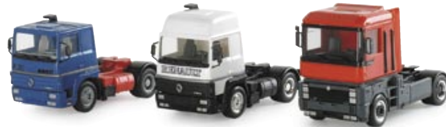
154055 | Set Renault R 310 / Renault R 390 / Renault Magnum www.herpa.de?154055