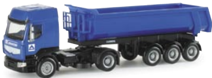
154000 | Renault Premium Rundmulden-Sattelzug "Hochtief" Renault Premium dump semitrailer "Hochtief" www.herpa.de?154000 neuer Auflieger 3-achs / new trailer 3-axle