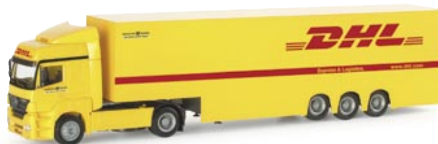
153966 | MB Axor II Doppelstock-Sattelzug "DHL" MB Axor II two storied box semitrailer "DHL" www.herpa.de?153966