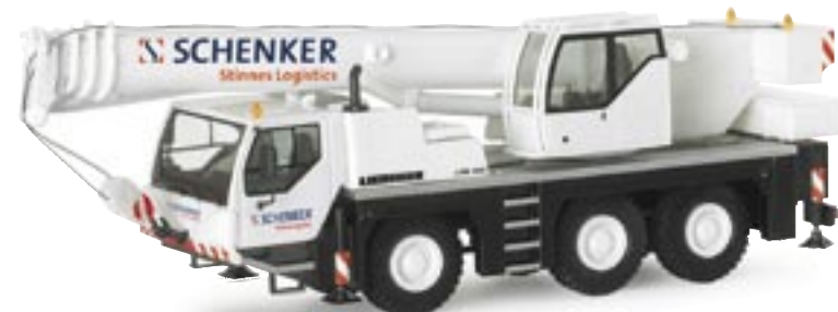
153881 | Liebherr Mobilkran LTM 1045/1 "Schenker" Liebherr mobile crane LTM 1045/1 www.herpa.de?153881