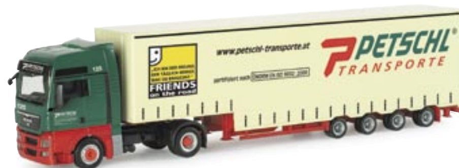
153843 | MAN TGX XXL Volumen-Sattelzug "Petschl" (A) MAN TGX XXL volume semitrailer "Petschl" (A) www.herpa.de?153843