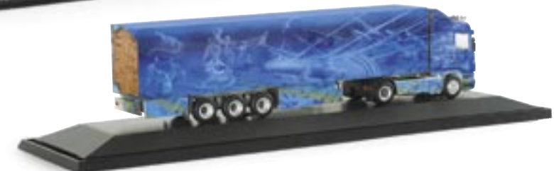
121019 | Scania R HL Kühlkoffer-Sattelzug "Mühl/Geister der Südsee" PC Scania R HL refrigerated box semitrailer "Mühl/Geister der Südsee" www.herpa.de?121019