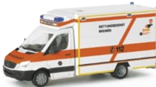
047579 | MB Sprinter 06 RTW Fahrtec "Feuerwehr Bremen" 16,50 € www.herpa.de?047579 neue Form / new mold