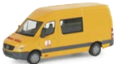
047616 | MB Sprinter 06 Halbbus "Bögl" www.herpa.de?047616 neue Form / new mold MB Sprinter Halbbus