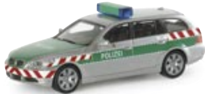
047586 | BMW 5er™ Touring "Autobahnpolizei Berlin" 10,25 € www.herpa.de?047586