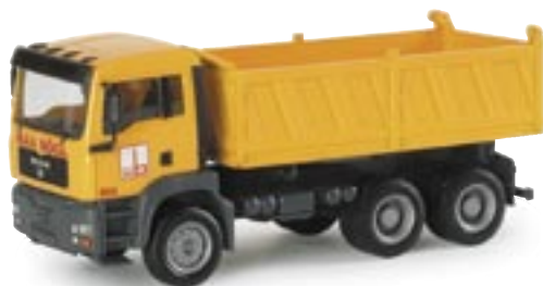
154031 | MAN TGA M Meiler-Kipper-LKW MAN TGA M dump truck www.herpa.de?154031