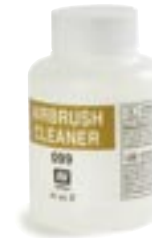
371049 | Herpa Color "Airbrush Cleaner" | www.herpa.de?371049 3,95 €