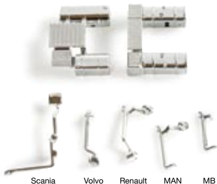
052573 | Sidepipes für LKW (3 Set) 7,50 € www.herpa.de?052573