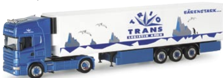
153942 | Scania 4er TL Kühlkoffer-Sattelzug "TRIO-TRANS" Scania 4er TL refrigerated box semitrailer "TRIO-TRANS" www.herpa.de?153942