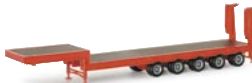
075879 | Tiefladefahrgestell feuerrot 9,25 € www.herpa.de?075879