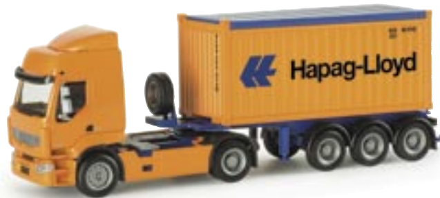
153652 | Renault Premium 20ft. Container-Sattelzug "Hapag Lloyd" Renault Premium 20ft. container semitrailer „Hapag Lloyd“ www.herpa.de?153652 neuer Container / new container