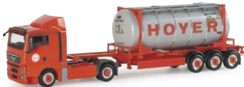
153935 | MAN TGX XL 20ft. Tankcontainer-Sattelzug "Hoyer" MAN TGX XL 20ft. tank container semitrailer "Hoyer" www.herpa.de?153935 neue Fahrerhausgeneration / new MAN truck generation