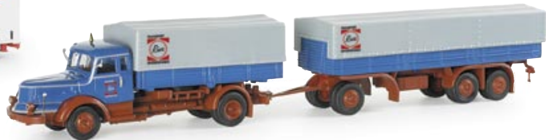
153904 | Krupp Titan Planen-Hängerzug "Riwatrans" Krupp Titan canvas trailer "Riwatrans" www.herpa.de?154079