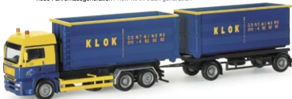
153980 | MAN TGA LX Abrollmulden-Hängerzug "Klok" (NL) MAN TGA LX dump trailer "Klok" (NL) www.herpa.de?153980