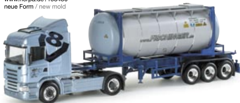
153898 | Scania R HL Tankcontainer-Sattelzug "Fischinger" Scania R HL container semitrailer "Fischinger" www.herpa.de?153898