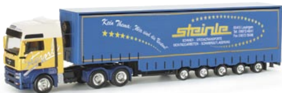
153430 | MAN TGA XXL Volumen-Sattelzug "Steinle" MAN TGA XXL volume semitrailer "Steinle" www.herpa.de?153430 neue Form / new mold