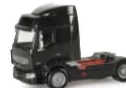
152969 | Renault Premium 11,00 € Solo-Zugmaschine / schwarz www.herpa.de?152969