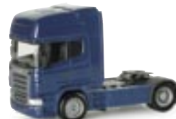
150422 | Scania R TL Zugm. 11,00 € kobaltblau www.herpa.de?150422