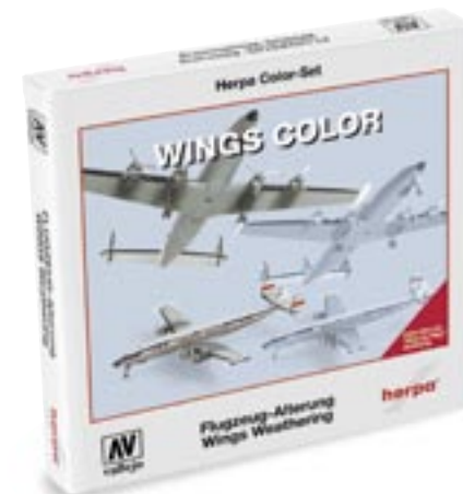
371025 | Herpa Color-Set "Wings" 29,90 € www.herpa.de?371025