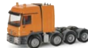
150651 | MB Actros L02 Titan 16,00 € Schwerlast-Zugm. / orange www.herpa.de?150651