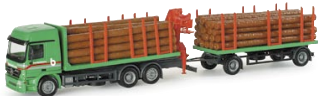
153997 | MB Actros LH 02 Rungen-Hängerzug mit Holz "Bockelmann" MB Actros LH 02 stanke trailer with wood "Bockelmann" www.herpa.de?153997