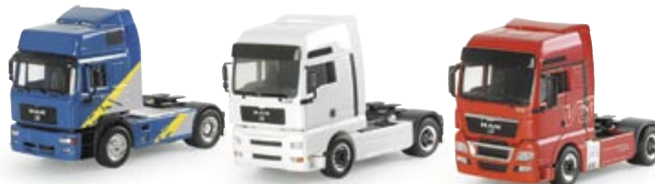
154062 | Set MAN F2000 EVO / MAN TGA XXL 5Star / MAN TGX XXL V8 www.herpa.de?154062