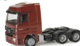
150460 | MB Actros LH 02 Zugm. 11,00 € weinrot www.herpa.de?150460