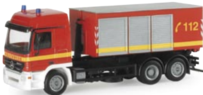
047609 | MB Actros L 02 Abrollcontainer-LKW "Feuerwehr" 16,00 € www.herpa.de?047609