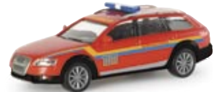
047593 | Audi A6® Allroad "TU München" 10,75 € www.herpa.de?047593