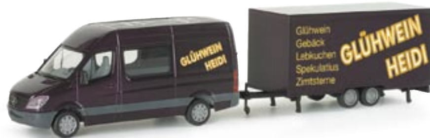
047562 | MB Sprinter 06 Halbbus mit Anhänger "Glühwein-Heidi" 19,50 € www.herpa.de?047562 neue Form / new mold MB Sprinter Halbbus