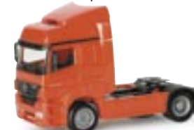
150675 | MB Axor Solo-Zugm. 11,00 € verkehrsrot www.herpa.de?150675