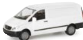
046008 | MB Vito Kasten reinweiß 7,00 € www.herpa.de?046008