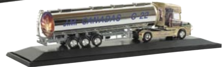
121002 | Scania Hauber TL Chromtank-Sattelzug "Canadas Freedom" (E) PC Scania Hauber TL chromium tank semitrailer "Canadas Freedom" (E) www.herpa.de?121002