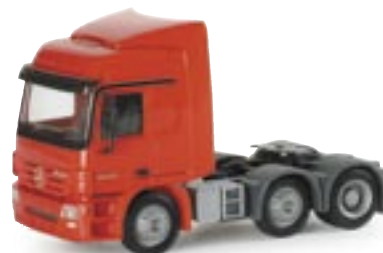
153874 | MB Actros L 02 Zugmaschine 3a rot www.herpa.de?153874