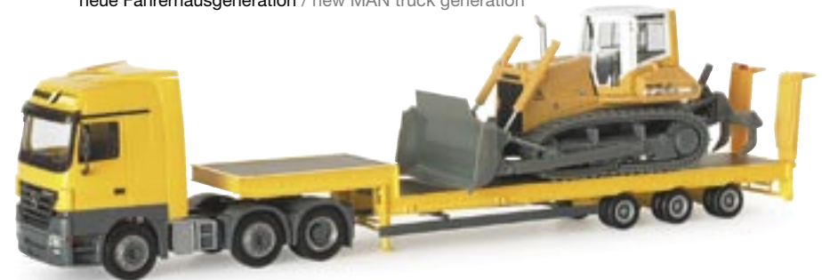
153973 | MB Actros LH 02 Tieflade-Sattelzug mit Planierdraupe "Friedsped" MB Actros LH 02 low boy semitrailer with bulldozer "Friedsped" www.herpa.de?153973