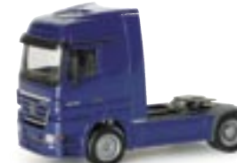
152952 | MB Actros LH 02 11,00 € Solo-Zugmaschine / nachtblau www.herpa.de?152952