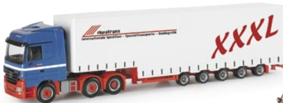
153959 | MB Actros LH 02 Volumen-Sattelzug "Riwatrans" MB Actros LH 02 volume semitrailer "Riwatrans" www.herpa.de?153959 neue Form / new mold