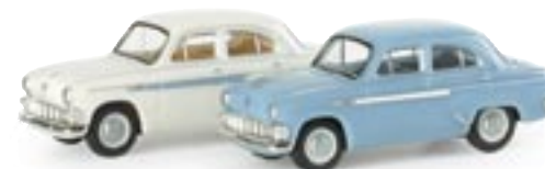
065511 | TT-2er Set / Moskwitsch 403 1: i20 (cremeweiß / hellblau) 10,00 € www.herpa.de?065511 neue Form / new mold