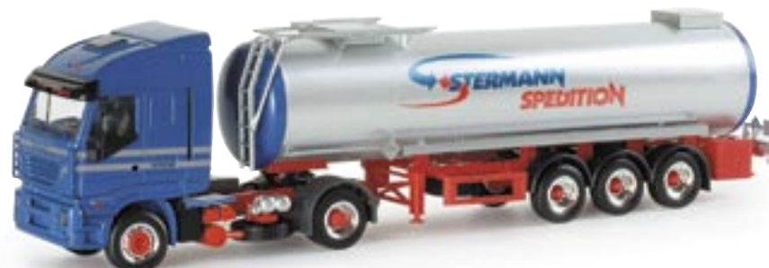
154079 | Iveco Stralis Bitumentank-Sattelzug "Stermann" Iveco Stralis tank semitrailer "Stermann" www.herpa.de?153904