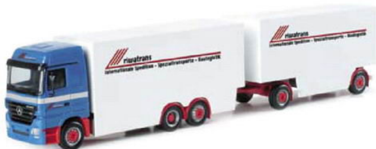
150873 II MB Actros LH 02 Koffer-Hängerzug „Riwatrans“ MB Actros LH 02 box trailer „Riwatrans“