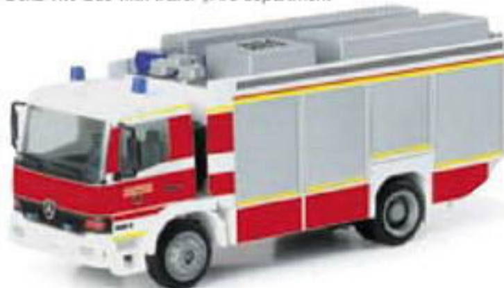
046565 || MB Atego RW 2 „Feuerwehr Düsseldorf“