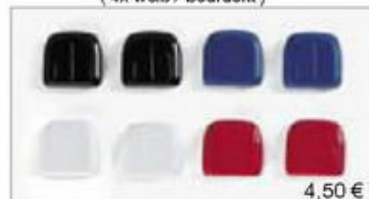
052214 || Standklimaanlage (2x rot / 2x weiß / 2x blau / 2x schwarz)