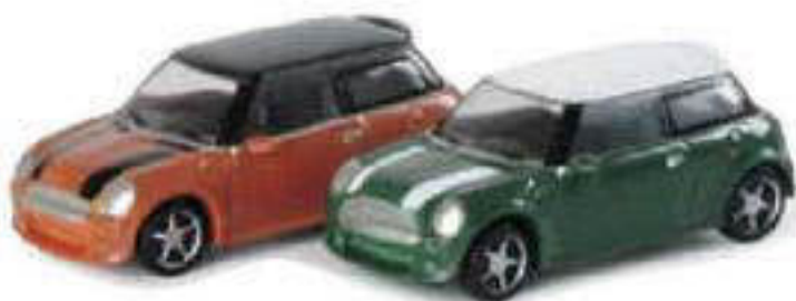
065252 || 2er-Set „Mini Cooper S™“ (1:160)

A new car is the latest addition to the range of 1/160 scale (N-track) models. The last Mini Cooper S™ is released in racing green, with a white roof, and flamenco orange, with a black roof, which come in a set. Of course, both models feature rollable wheels.