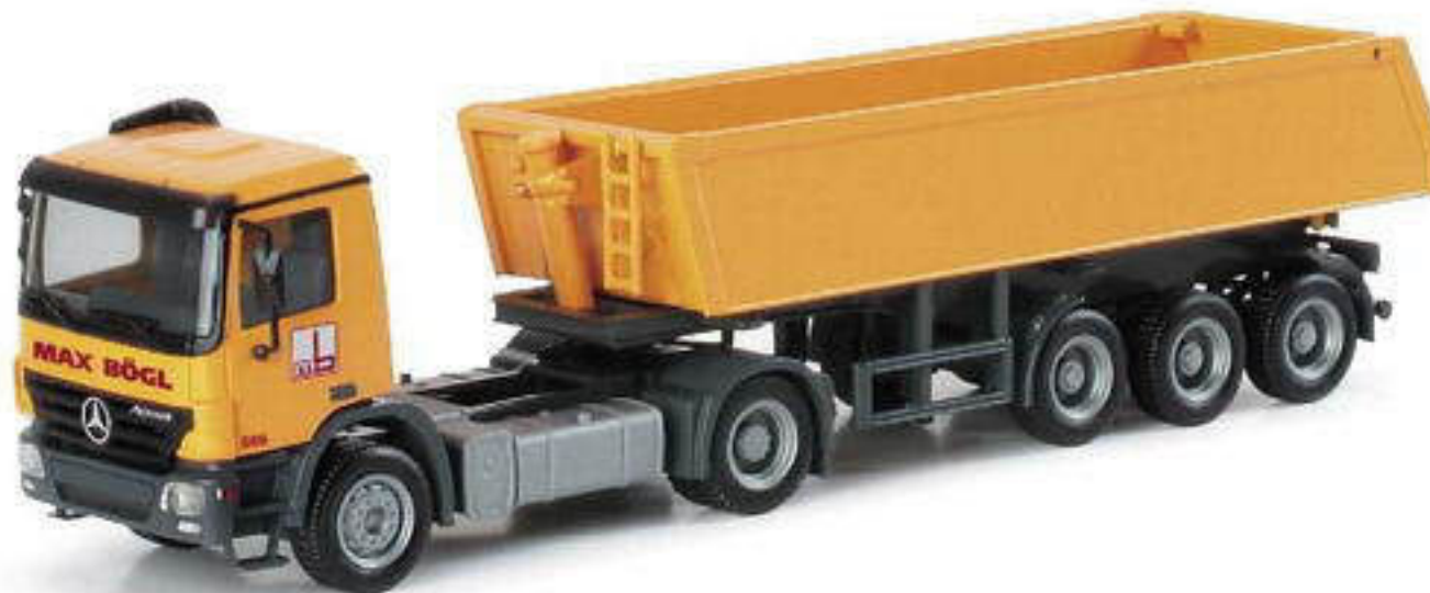
151030 || MB Actros S 02 Baukipper-Sattelzug „Bögl“ MB Actros S 02 dump semitrailer „Bögl“