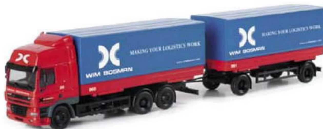
150941 II DAF CF Wechselpritschen-Hängerzug „Wim Bosman“ (NL) DAF CF interchangeable pick-up trailer „Wim Bosman“ (NL)