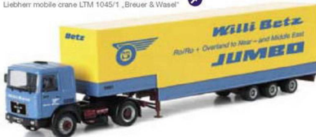
150927 || MAN F 8 Jumboplanen-Sattelzug „Willi Betz“ MAN F 8 jumbo tarp semitrailer „Willi Betz“