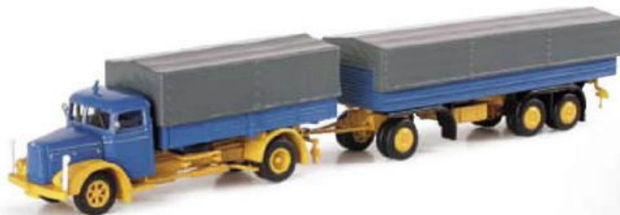
150996 || MAN F 8 Planen-Hängerzug MAN F 8 canvas trailer