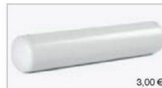
075923 || Ladegut Röhre