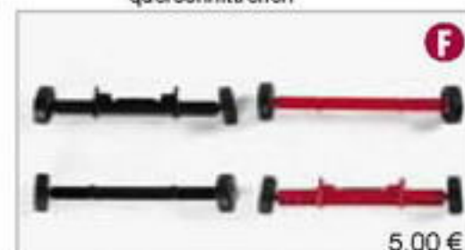
052269 || Stützräder für Euroauflieger