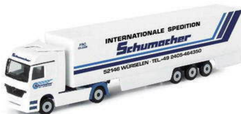
065245 || MB Actros LH Koffer-Sattelzug „Schumacher“ (1:220) MB Actros LH box semitrailer „Schumacher“ (1:220)