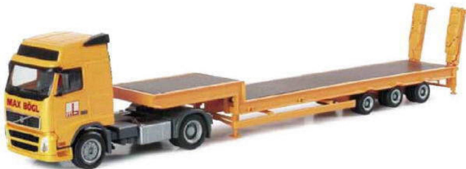
151047 || Volvo FH GI Tieflade-Sattelzug mit Rampen „Bögl“ Volvo FH GI lowboy semitrailer