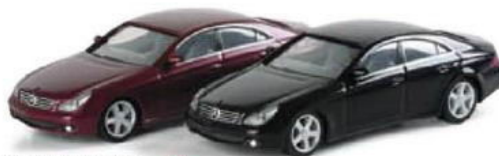
023313 || Mercedes Benz CLS Coupé std. F 033312 || Mercedes Benz CLS Coupé met.