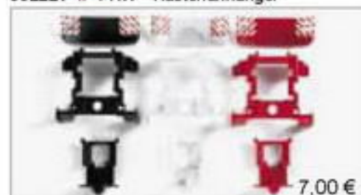
052238 || Registerstoßstange MAN TGA