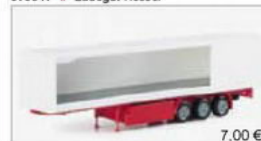
075954 || Gardinenplanenaufleger 3a (mit offener Plane)