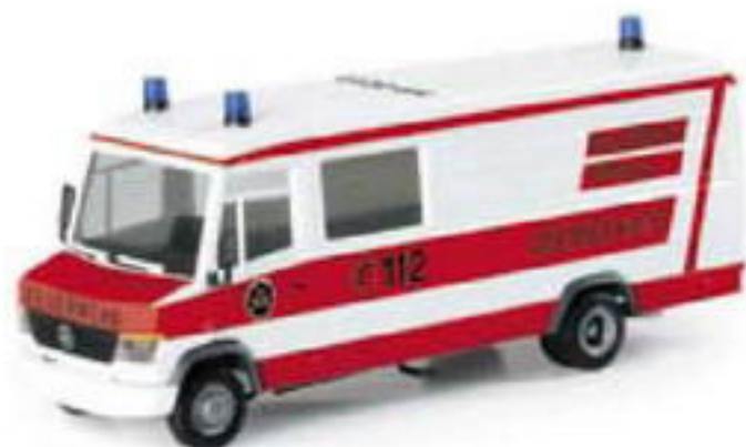
046510 II Mercedes Benz Vario Kasten „Feuerwehr Bremen“