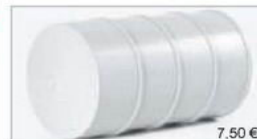
075947 || Ladegut Kessel