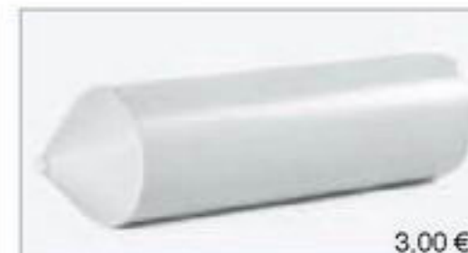
075930 || Ladegut Silo