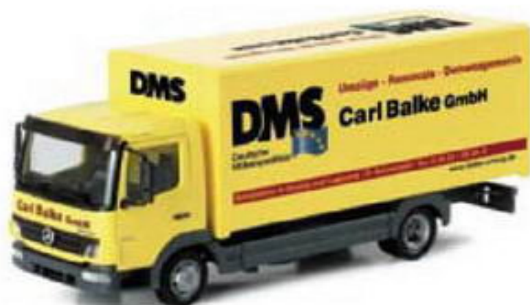
150989 || MB Atego 04 Koffer-LKW „DMS Balke“ MB Atego 04 box transporter „DMS Balke“