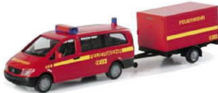
046541 || Mercedes Benz Vito Bus mit Anhänger „Feuerwehr“ Mercedes Benz Vito Bus with trailer „Fire department“