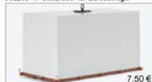
075916 || Ladegut Kiste