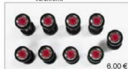
052252 || Radsatz für Lowliner (mit Nieder querschnittreifen)