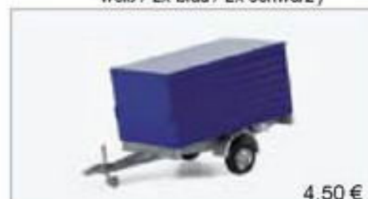
052221 || PKW - Kastenanhänger