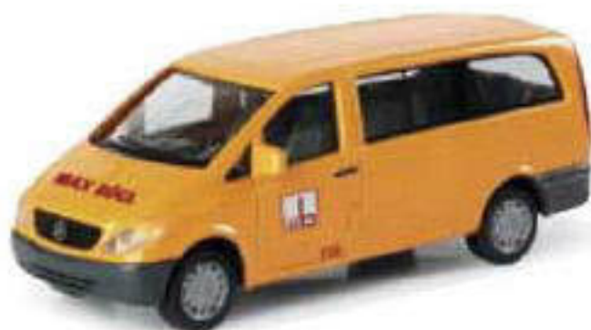
046572 || MB Vito Bus „Bögl“