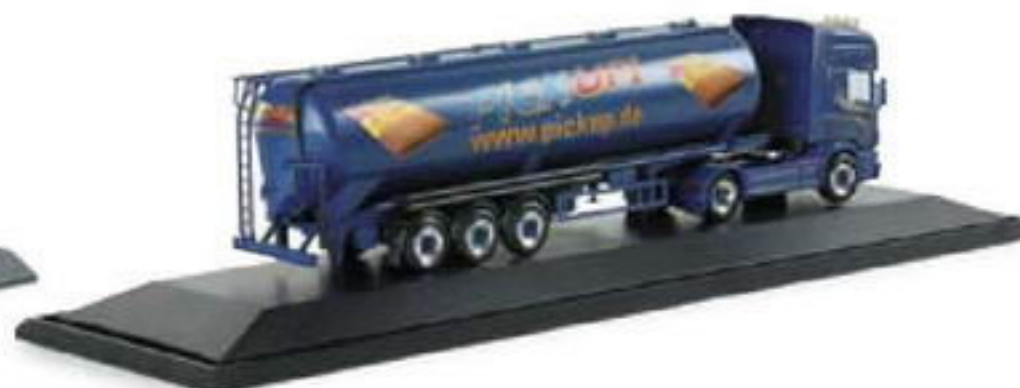
120661 II Scania TL Silo-Sattelzug „Bontjes Spedition / Bahlsen Pick Up!“ 49,50 €

Nach langer Pause erscheint wieder einmal ein Modell mit Werbung von Bahlsen im Herpa -Programm. Der Scania Silo-Sattelzug wird von Bontjes aus Soltau eingesetzt. Während die Zugmaschine mit goldenen Schriftzügen des Unternehmers gestaltet ist, trägt der Siloaufleger die Werbung für den Doppelkeksriegel Pick Up! aus dem Hause Bahlsen .