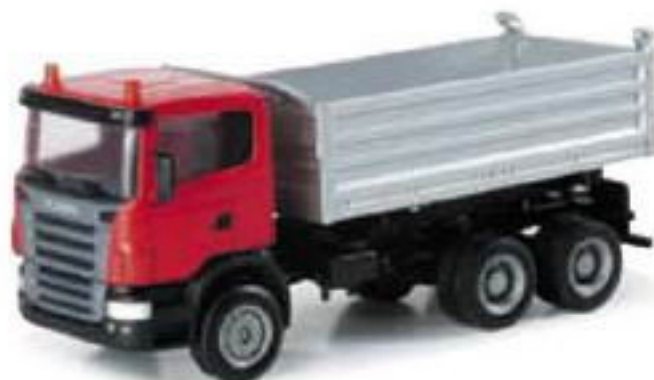
150897 || Scania R CR16 (mittellang) Baukipper Scania R CR16 (mid-size) construction site dumper

Truck Center Hauser (TCH) is based in the Rhine-Main area town of Dieburg. The truck rental specialist offers almost any kind of truck, including roll-off container trailers. TCH displayed this MAN TGA LX and an MAN TGA XL at the International Automobile Fair for commercial vehicles in Hanover. This model is released with red containers.