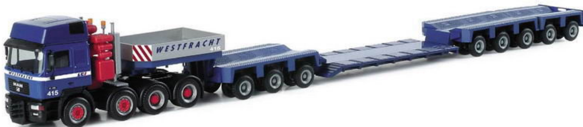
150958 || MAN E 2000 Evo Tieflade-Sattelzug „Westfracht“ MAN E 2000 Evo lowboy semitrailer „Westfracht“

This MAN E 2000 Evo lowboy semitrailer is operated nationwide by Westfracht , headquartered in Essen. Following the release of the construction material trailer, this lowboy is released as a limited edition.