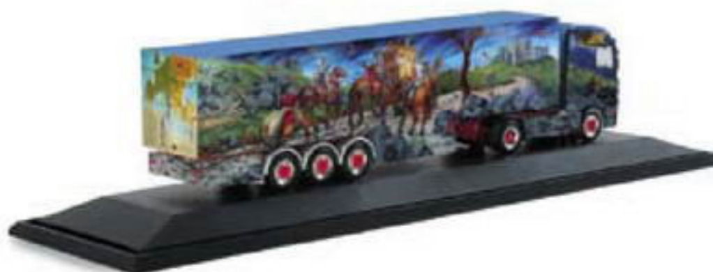
120685 II MB Actros LH 02 Kühlkoffer-Sattelzug „Herpa präsentiert N°4: Die Kreuzzüge“ 49,50 €