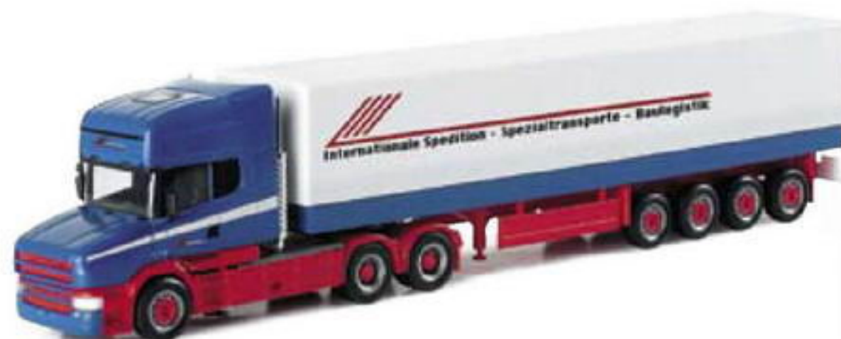
151009 II Scania Hauber TL 04 Planen-Sattelzug „Riwatrans“ Scania Hauber TL 04 cava semitrailer „Riwatrans“