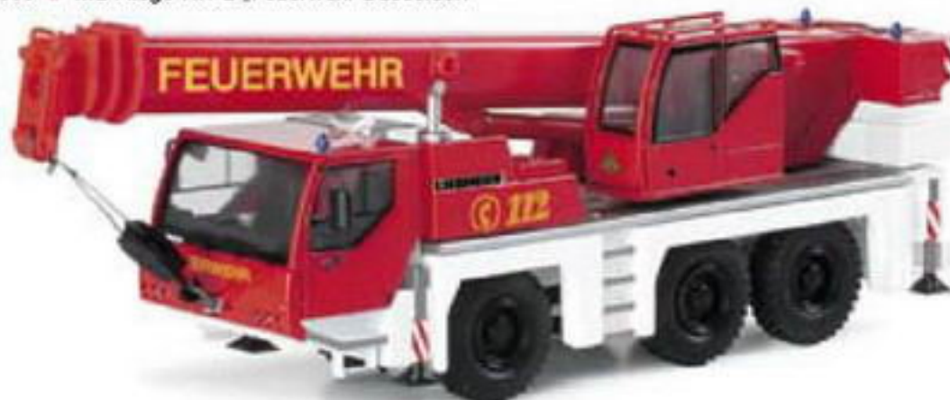
150972 || Liebherr Mobilkran LTM 1045/1 „Feuerwehr“ Liebherr mobile crane LTM 1045/1 „Fire department“

Die „neutrale“ Feuerwehr im Herpa -Programm erhält Zuwachs durch einen Mercedes Benz Vito der aktuellen Generation mit einem Gerätekofter-Anhänger. Das Gespann erscheint mit gelben Designstreifen passend zu dem kompletten Löschzug.