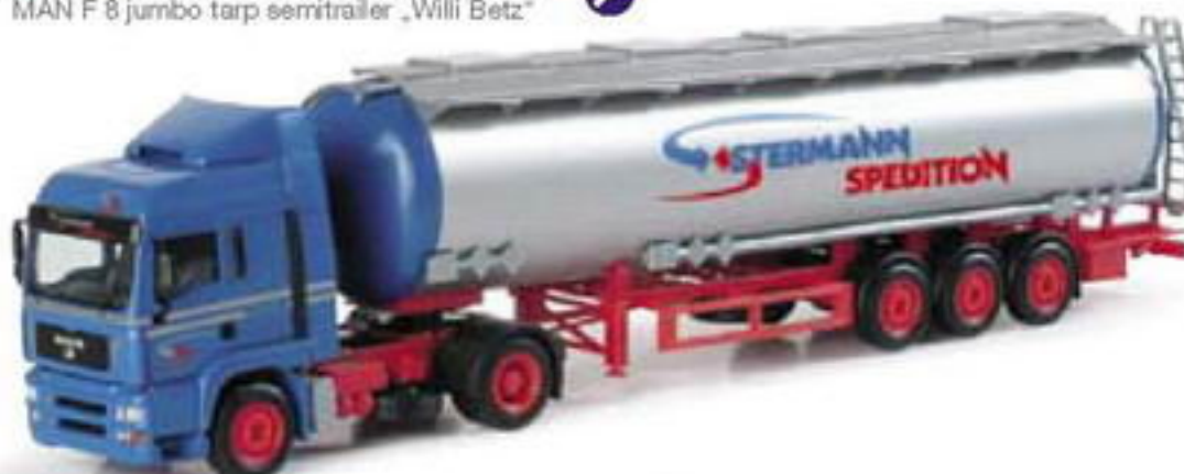
150965 || MAN TGA LX Jumbotank-Sattelzug „Stermann“ MAN TGA LX jumbo tank semitrailer „Stermann“