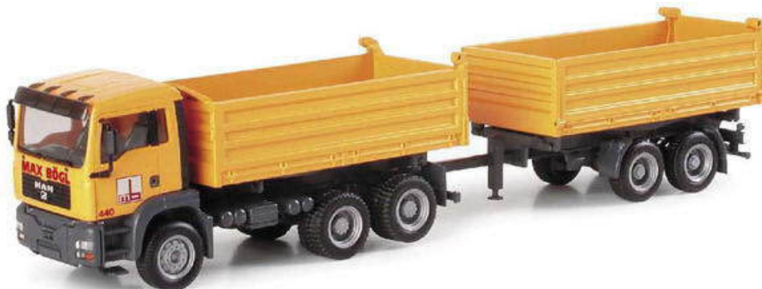
151023 || MAN TGA M Baukipper-Hängerzug „Bögl“ MAN TGA M construction site dumper „Bögl“

The series of miniature models based on vehicles operated by Max Bögl is extended by four new attractive models. There are the new MB Vito bus, two dump trucks, and a new Volvo with a low-boy semitrailer, featuring ramps for transporting construction vehicles.