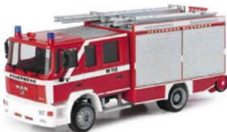
046527 II MAN M 2000 Evo LF 20/16 „Feuerwehr Nürnberg“