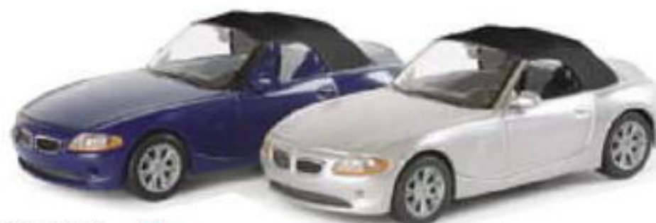
023320 || BMW Z4™ Softtop std. F 033329 || BMW Z4™ Softtop met.