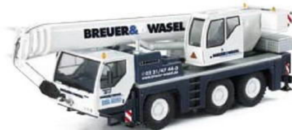
150910 || Liebherr Mobilkran LTM 1045/1 „Breuer & Wasel“ Liebherr mobile crane LTM 1045/1 „Breuer & Wasel“