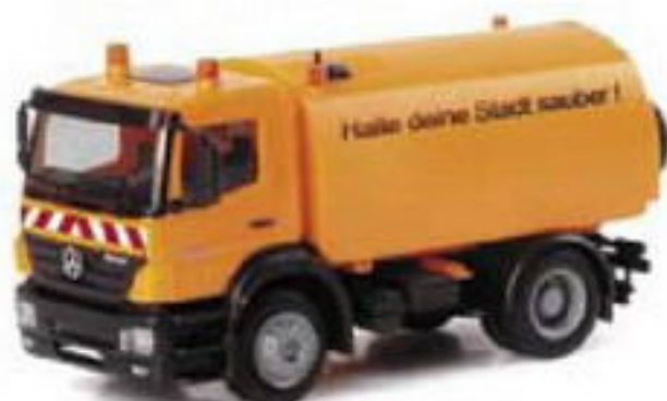
150903 || MB Axor 04 Kehrfahrzeug MB Axor municipal street sweeper

Herpa continues the series of construction vehicles models, featuring a metal chassis with this mid-size cabin Scania R truck, equipped with a Kögel dumper payload. The chassis features the typical Scania gas tanks and pressurized air tanks.