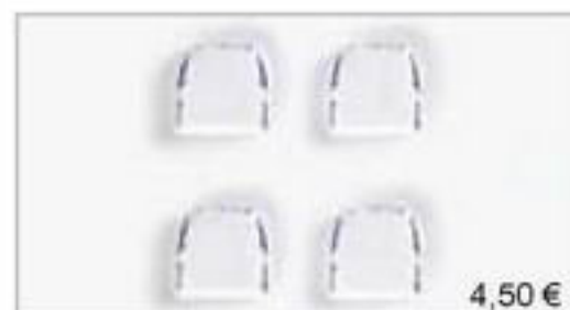
052207 || Standklimaanlage (4x weiß / bedruckt)

No matter what you are looking for, the collection supplement 2005 offers you a wide range of items, such as load for your heavy-duty transport truck, trailers for your cars, additional items for your trucks, and many, many more. Until mid-2005, more items from all ranges, as well as rigid tractors and various trailer types will complement the collection. We are sure there is something useful for everyone.