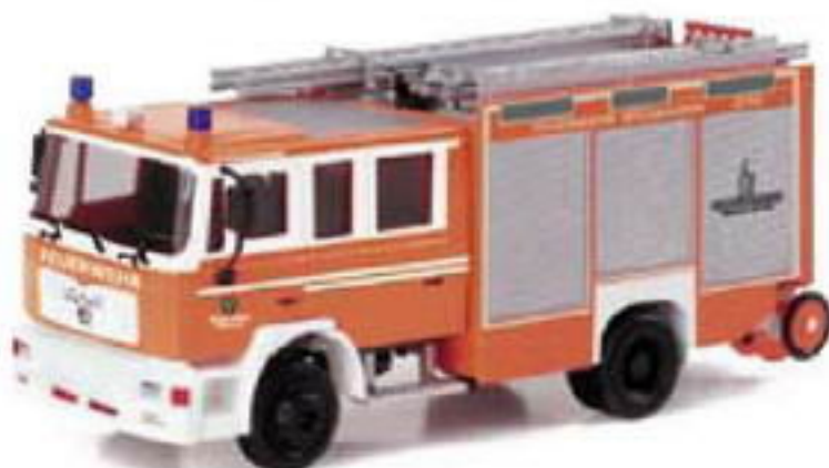
046534 II MAN M 2000 Evo LF 20/16 „Feuerwehr Wiesbaden“