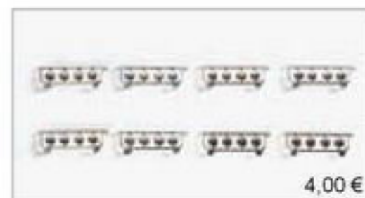
052245 || Lampenbügel (für Stoßstange) verchromt