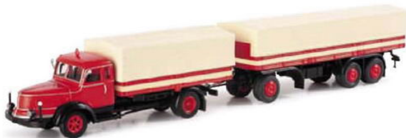
150934 || Krupp Titan Planen-Hängerzug Krupp Titan canvas trailer