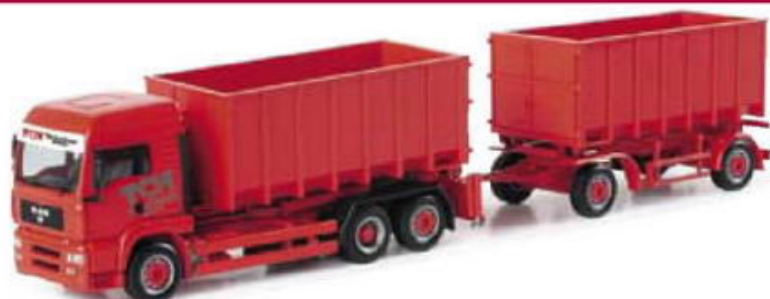
150842 || MAN TGA LX Abrollmulden-Hängerzug „TCH“ MAN TGA LX roll-off container trailer „TCH“