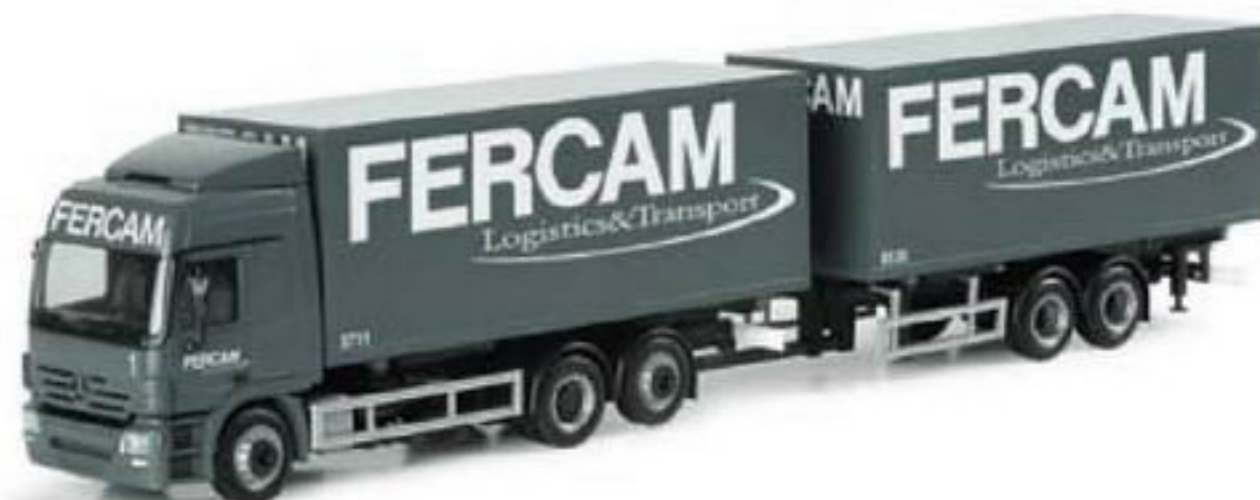
151016 II MB Actros L 02 Wechselkoffer-Hängerzug „Fercam“ (I) MB Actros L 02 interchangeable box trailer „Fercam“ (I)

Today's regular MB Actros L 02 trailer with interchangeable box containers is now released with the new design of Fercam from Bolzano, Italy. It looks much like the full-size vehicle, and is released as a one-time edition model.