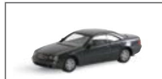
032889 || MB CL-Klasse Coupé met.