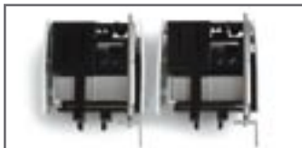
052320 || Schwerlastturm MB Titan mit Verkleidung (2Stück)