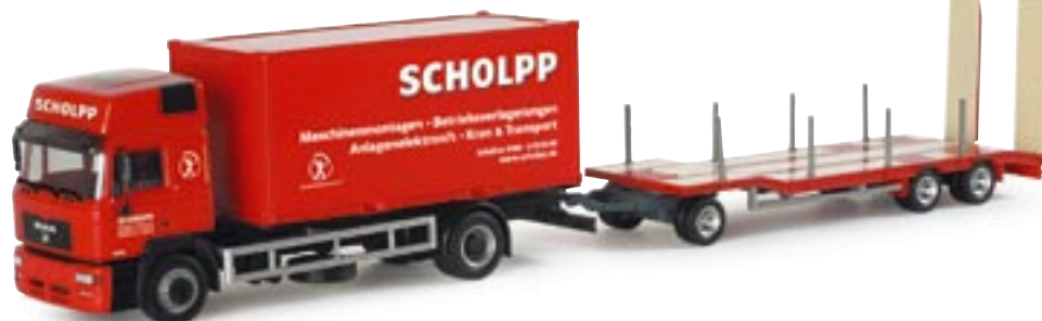
151313 || MAN F2000 HD Container-LKW mit TU 3 „Scholpp“ MAN F2000 HD container truck with TU 3 „Scholpp“