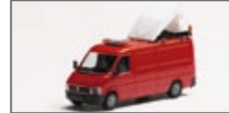
045391 || VW LT2 BF 3