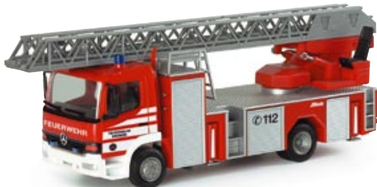
046640 || MB Atego DLK 23/12 „Feuerwehr Bremen“