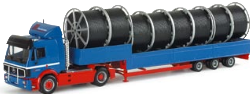
151238 || MB SK '88 Jumbopritschen-Sattelzug „Riwatrans“ MB SK '88 pick-up semitrailer „Riwatrans“