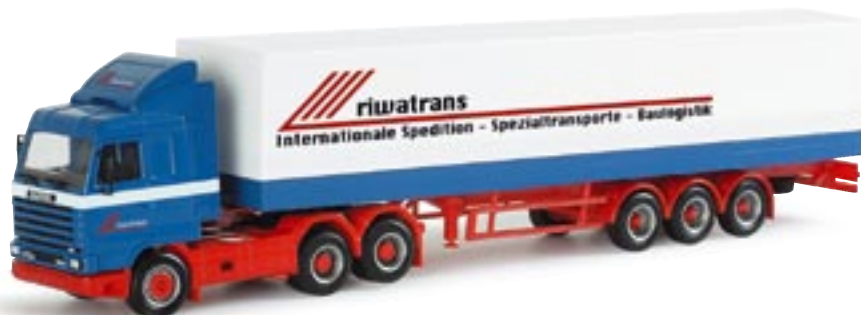
151252 || Scania SL Planen-Sattelzug „Riwatrans“ Scania SL canvas semitrailer „Riwatrans“