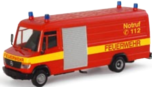
046060 || MB Vario lang LRF „Feuerwehr“

As of the late 1960s, the Wartburg 353 was operated by East Germany's police, featuring one single blue flashing light. The Herpa model is authentically painted in two colors, and carries the relevant printings.