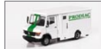
046268 || MB Vario Geldtransporter „Prodiac“