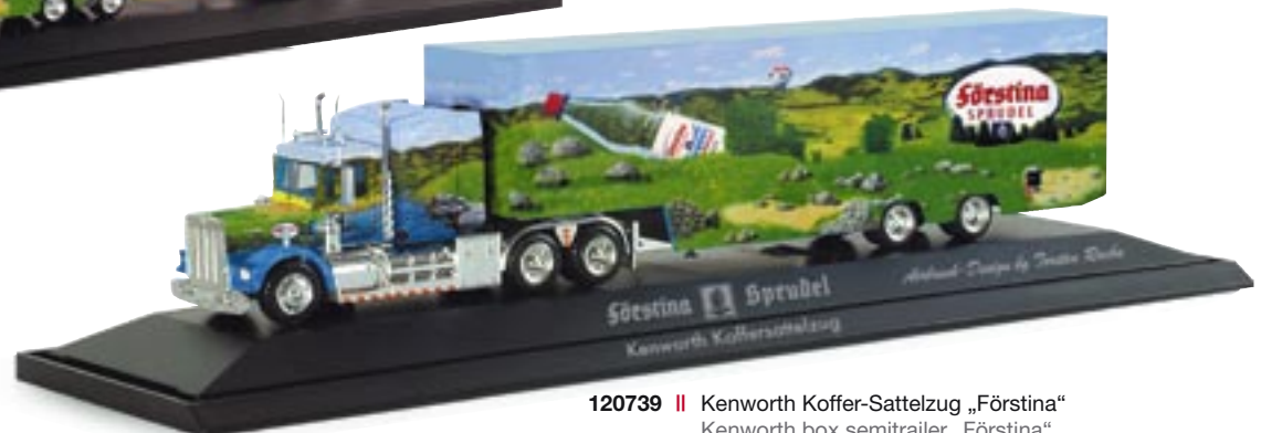
120739 || Kenworth Koffer-Sattelzug „Förstina“ Kenworth box semitrailer „Förstina“