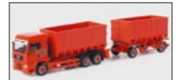
150842 || MAN TGA LX Abrollmulden-Hängerzug „TCH“