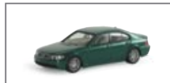
033053 || BMW 7er met.