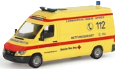
046718 || MB Sprinter facelift RTW „DRK Landkreis Oder-Spree“