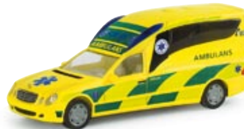
046053 || MB Binz A2003 „Rettungsdienst Schweden“ (SE)