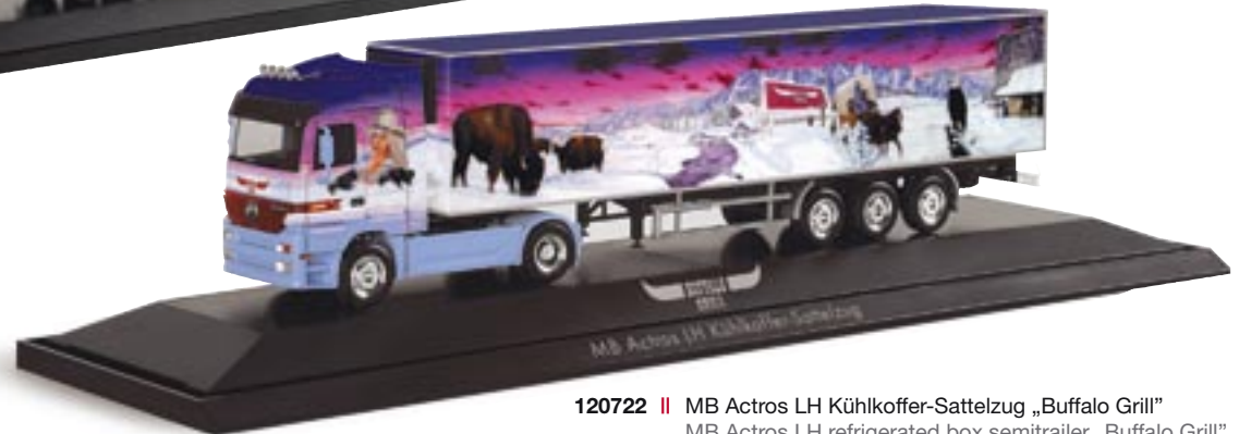
120722 || MB Actros LH Kühlkoffer-Sattelzug „Buffalo Grill“ MB Actros LH refrigerated box semitrailer „Buffalo Grill“