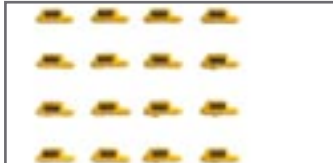
052306 || Taxischilder (20Stück)