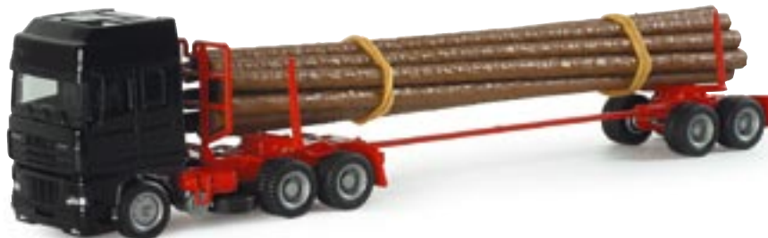
151283 || DAF XF SSC Holztransporter-Sattelzug DAF XF SSC transporter with load of wood