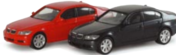
023351 || BMW 3er Limousine™ std. 033350 || BMW 3er Limousine™ met.