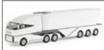
151412 || Fulda Truck, weiß