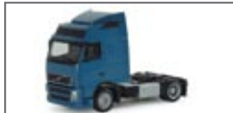
151429 || Volvo GL Lowliner Zugmaschine