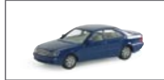
022699 || MB S-Klasse std.