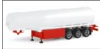
076012 || Benzintankauflieger Willig 3a