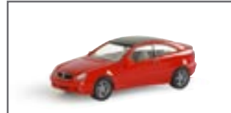
023009 || MB C-Klasse Sportcoupé std.