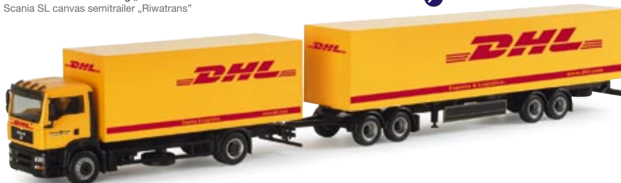
151269 || MAN TGA M Koffer-Hängerzug „DHL“ MAN TGA M box trailer „DHL“