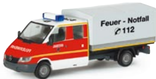
046633 || MB Sprinter Pritsche/Plane Doppelkabine „Feuerwehr Düsseldorf“

The latest LRF (a combined fire and rescue vehicle), based on an original operated by Essen's city fire department, is released as a generic version. The combination of both fire fighting and rescue modules is very successful. The specialized companies Ziegler and Binz are responsible for the new concept, design and manufacturing of this vehicle.