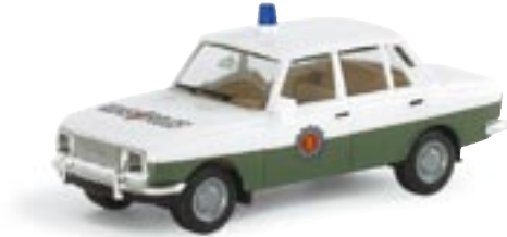
046701 || Wartburg 353 '66 „Volkspolizei“