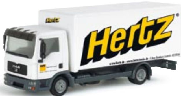
151276 || MAN TGL Koffer-LKW „Hertz“ MAN TGL box type truck „Hertz“