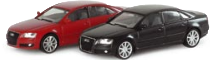
023368 || Audi A8 Limousine ® facelift std. 033367 || Audi A8 Limousine ® facelift met.