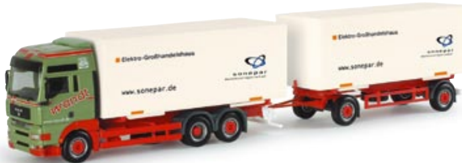
151245 || MAN TGA XXL Wechselkoffer-Hängerzug „Wandt“ MAN TGA XXL interchangeable box semitrailer „Wandt“