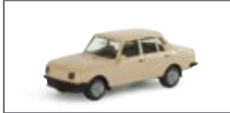
022705 || Wartburg 353 85