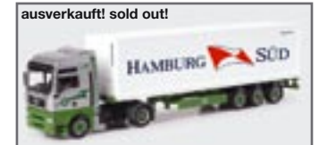
ausverkauft! sold out! 150811 || MAN TGA Container-Sattelzug „EKB/Hamburg-Süd“