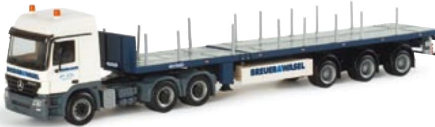
151337 || MB Actros L 02 Nootboom Teletrailer-Sattelzug „Breuer & Wasel“ MB Actros L 02 Nootboom teletrailer semitrailer „Breuer & Wasel“