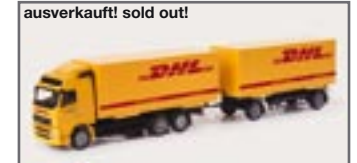
ausverkauft! sold out! 150798 || Volvo FH Gl. Wechselkoffer-Hängerzug „DHL“