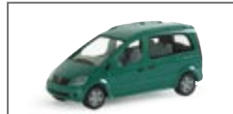
023092 || MB Vaneo std.