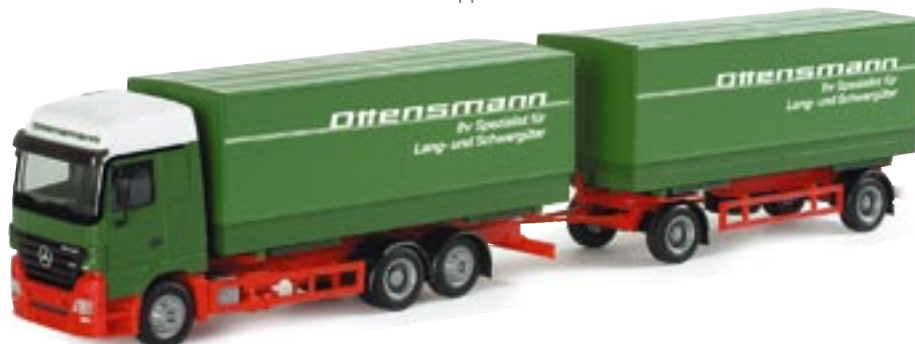
151320 || MB Actros LH 02 Wechselpritsche-Hängerzug „Ottensmann“ MB Actros LH 02 interchangeable pick-up trailer „Ottensmann“