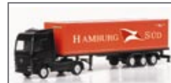
065191 || MB Actros Container-Sattelzug „Hamburg Süd“ (N, 1:160)