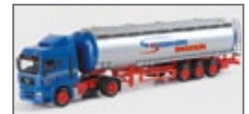
150965 || MAN TGA LX Jumbotank-Sattelzug „Stermann“