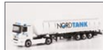
149143 || MB Actros Jumbotanksattelzug „Nordtank“