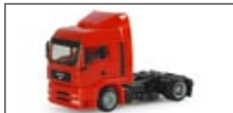
151436 || MAN TGA LX Lowliner Zugmaschine