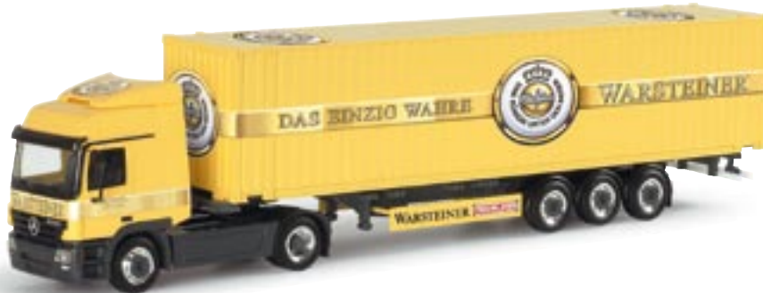
151344 || MB Actros L 02 45ft. Highcubecontainer-Sattelzug „Warsteiner/Merck“ MB Actros L 02 45ft. high cube container semitrailer „Warsteiner/Merck“