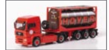
150521 || MAN TGA LX Container-Sattelzug „Hoyer“