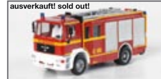
ausverkauft! sold out! 046084 || MAN ME 2000 HLF 2000 „Feuerwehr“