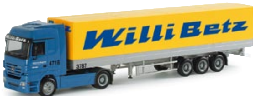
151306 || MB Actros LH 02 Planen-Sattelzug „Willi Betz“ MB Actros LH 02 canvas semitrailer „Willi Betz“