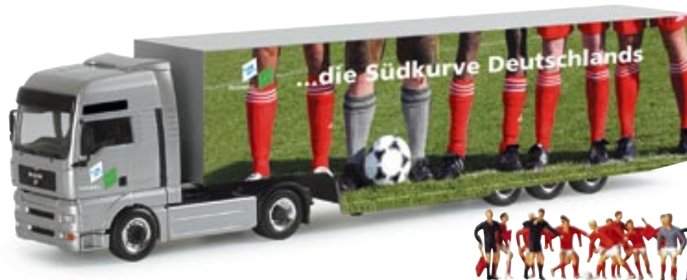
151573 || MAN TGA XXL Koffer-Sattelzug „Südkurve“ (mit 12 Preiserfiguren) MAN TGA XXL box semitrailer „Südkurve“ (with 12 Preiser figures)