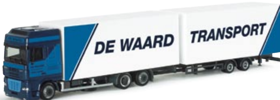
151382 || DAF XF SSC Volumenkoffer-Hängerzug „De Waard“ (NL) DAF XF SSC volume box trailer „De Waard“ (NL)