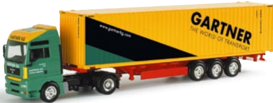
151078 || MAN TGA XXL 45ft. Highcubecontainer-Sattelzug „Gartner KG“ (A) MAN TGA XXL 45ft. high cube container semitrailer „Gartner KG“ (A)