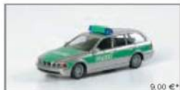
040919 BMW 5er Touring™ „Polizei Berlin“