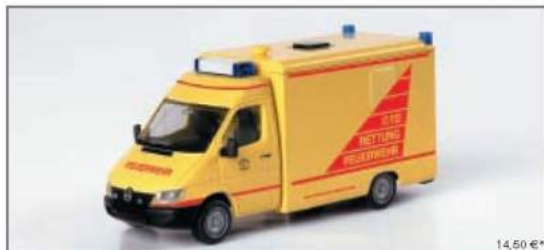
046312 Mercedes-Benz Sprinter Infektionsrettungswagen „FW Hamburg“