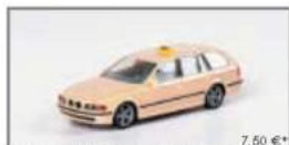
044905 BMW 5er Touring™ „Taxi“