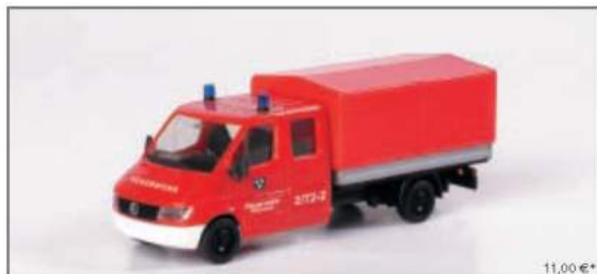
046329 Mercedes-Benz Sprinter Doppelcabine Pritsche/Plane „Feuerwehr Wiesbaden“