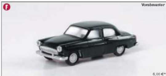
023203 Volga M 21 standard