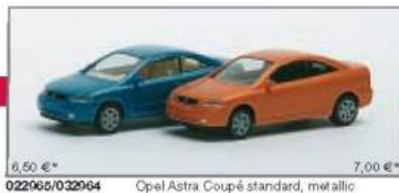
022065/032064 Opel Astra Coupé standard, metallic