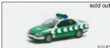
045438 Opel Omega B „Polizei Düsseldorf“