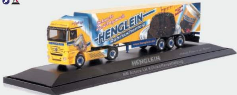
120616 MB Actros LH 02 Kühlkoffer-Sattelzug „Henglein“ MB Actros LH 02 refrigerated box semitrailer „Henglein“