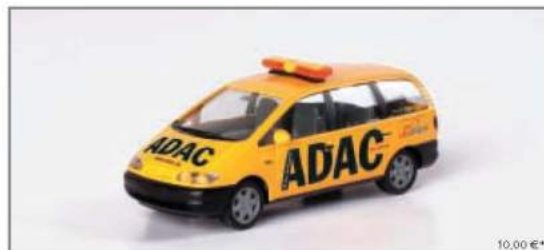
046374 Ford Galaxy „ADAC“