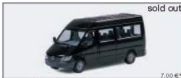
044677 MB Sprinter facelift Bus