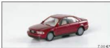
032490 Audi A4 metallic