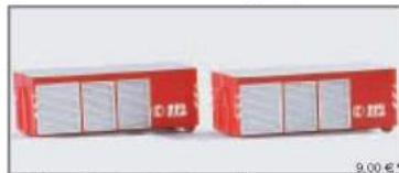
075633 2 Abrollcontainer „Feuerwehr“