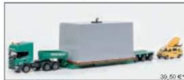
149426 Tiefade-Set „Hövelmann/Böckerholt“