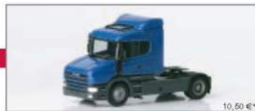
146607 Scania Hauber Solozugmaschine