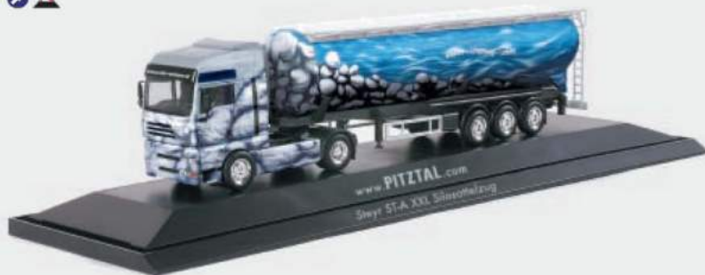
120609 Steyr STA XXL Silo-Sattelzug „Melmer Wasser & Granit“ Steyr STA XXL silo semitrailer „Melmer Wasser & Granit“