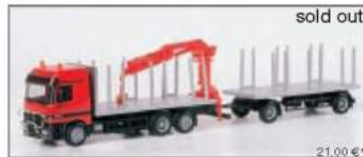
140450 MB Actros L Rungen-Hängerzug mit Ladekran