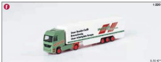
065221 MB Actros LH Koffer-Sattelzug „Wandt“ (Spur Z/1:220) MB Actros LH box semitrailer „Wandt“ (Spur Z/1:220)

This Wandt box semitrailer is the second truck model in the 1/220 scale (Z) to be released by Herpa. The MB Actros LH hauls a box semitrailer with special panelling and is printed in the colors of the Wandt transportation company.