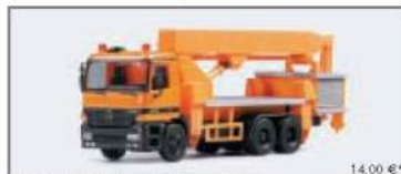
145610 MB Actros S Ruthmann Steiger