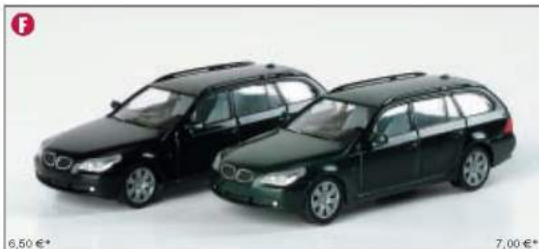
023269/033268 BMW 5er Touring™ standard / BMW 5er Touring™ metallic

The ADAC (German Automobile Club) celebrated its 100 th birthday in 2003. This year, the ADAC road service department celebrates its 50 th birthday. For this occasion, Herpa releases the latest Ford Galaxy, which is widely utilized by the ADAC in Germany, carrying the current ADAC design.