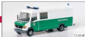
045797 MB Vario Kasten „Polizei Dresden“