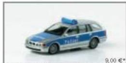
040711 BMW 5er Touring™ „Polizei“