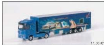
005100 MB Actros LH Koffer-Sattelzug „Herpa Showtruck“