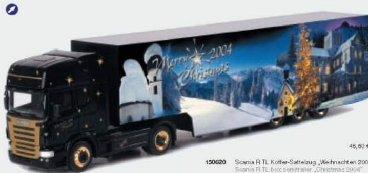
150620 Scania R TL Koffer-Sattelzug „Weihnachten 2004“ Scania R TL box semitrailer „Christmas 2004“