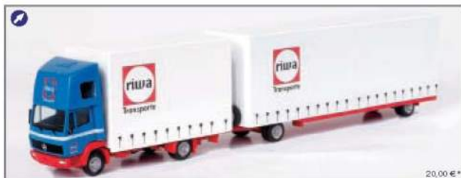
150330 MB 814 FH Volumen-Hängerzug „Riwatrans“ MB 814 FH volume trailer „Riwatrans“