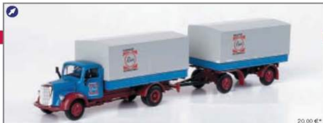
150323 MB L 311 Planen-Hängerzug „Riwatrans“ MB L 311 canvas trailer „Riwatrans“