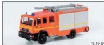
046170 MANL 2000 LF 20/12 „Feuerwehr Hamburg“