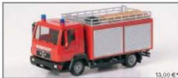
043526 MANL 2000 TLF 8/18 „Feuerwehr“