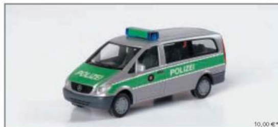
046343 Mercedes-Benz Vito neu Bus „Polizei Hessen“