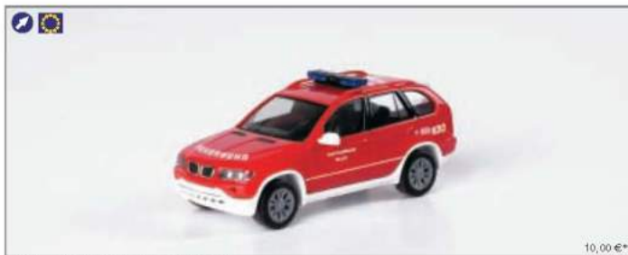
046336 BMW X 5™ „Feuerwehr Villach“ (A)