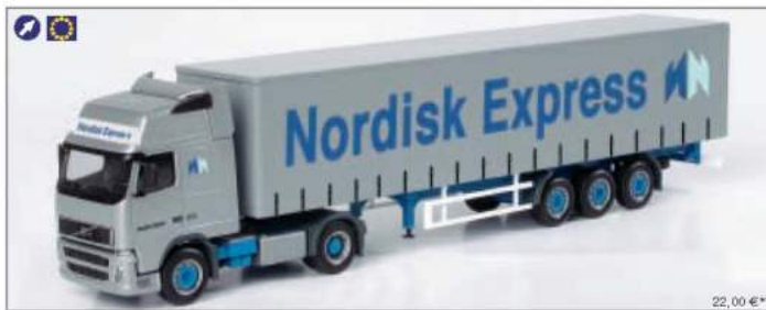
150613 Volvo FH XL Gardinenplanen-Sattelzug „Nordisk Express“ (S) Volvo FH XL curtain carvans semitrailer „Nordisk Express“ (S)

This year, Herpa's advent calendar will be released in its original form again, filled with twenty-four model cars, one for each day of the month of December up to Christmas Eve. All the Herpa models from various years will carry special colors otherwise not available in the shops. The models behind the twenty-four doors feature a great variety of originals, from 1950s cars to the latest car highlights.