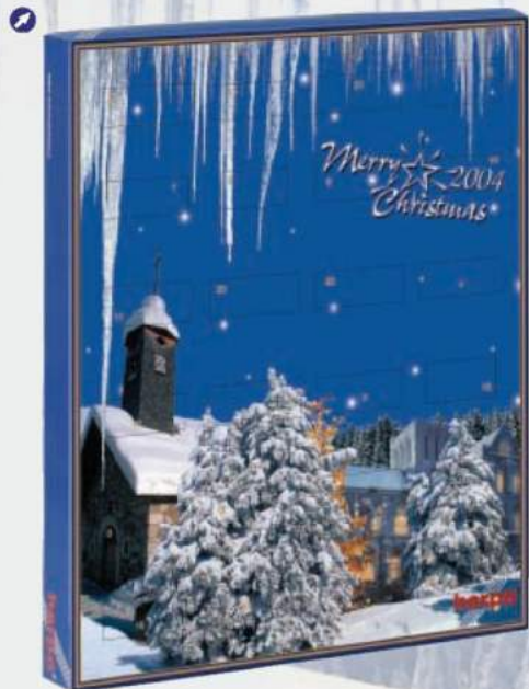
150743 Herpa Adventskalender 2004 Inhalt: 24 Herpa - PKW Herpa advent calendar 2004 Contains: 24 Herpa - cars