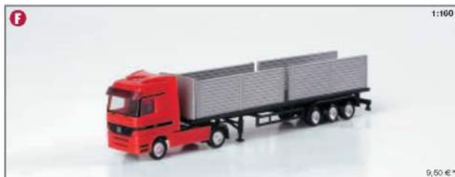
065214 MB Actros LH Flachbett-Sattelzug mit Bordwänden (Spur N/1:160) MB Actros LH flat semitrailer with platform gates (Spur N/1:160)