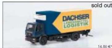
150008 MAN LE 2000 Koffer-LKW „Dachser“