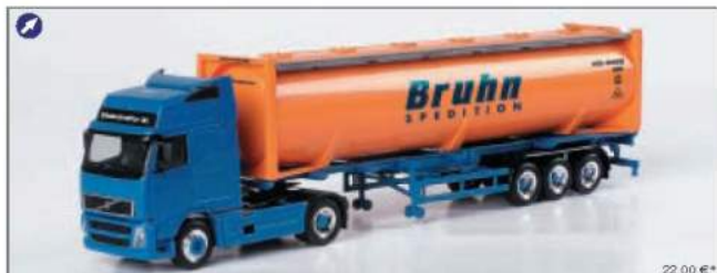
150477 Volvo GL 40ft. Drucksilocontainer-Sattelzug „Bruhn“ Volvo GL 40ft. bulk container semitrailer „Bruhn“