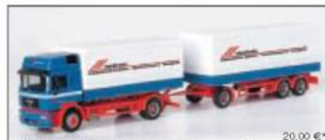
150163 MAN F 2000 Evo Planen-Hängerzug „Ritwatsen“