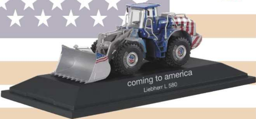
149921 Liebherr Radlader L 580 "USA" Liebherr wheel loader L 580 "USA"