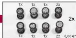
062061 PKW Sportfelgen Mercedes, verchromt