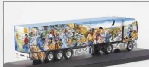
120555 DAF XF SSC Kühlkoffer-Sattelzug "Herpa präsentiert II" DAF XF SSC refrigerated box semitrailer "Herpa präsentiert II"