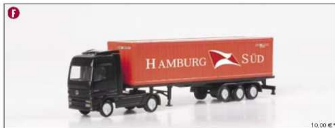
065191 MB Actros LH Container-Sattelzug "Hamburg Süd" (1:160) MB Actros LH container semitrailer "Hamburg Süd" (1:160)