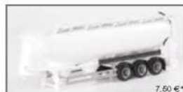
075000 Eulersilo-Auflieger 55cm33a