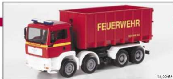
046152 MAN TGA M Abrollmulden-LKW 4a "Feuerwehr" MAN TGA M roll of multibucket truck "Feuerwehr"