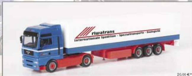
150217 MAN TGA XXL Planen-Sattelzug "Riwatrans" MAN TGA XXL canvas semitrailer "Riwatrans"

The extensive fleet of a very traditional company, Riwatrans, begins to grow in the Herpa program of scale models. The series begins with two modern Riwatrans vehicles. The history of the company will also be a future topic for further models to come, reaching back to the 1950s. The Riwatrans company also operates some very rare vehicle combinations, including a tarp trailer, silo trailers and even heavy-duty semitrailers. A new model variation will be released every month. You may have guessed it already: Riwatrans is a virtual shipping company, and Herpa will use it as an example for the variety of an entire fleet. Moreover, there will even be buildings to go with the vehicles. Thus, our collectors will get a whole host of pieces that will, one by one, become a unique shipping company diorama.