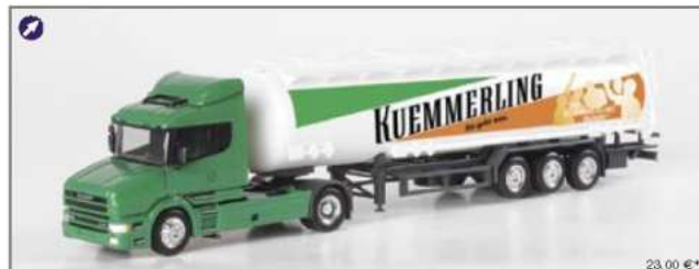
120224 Scania Hauber Jumbotank-Sattelzug "Kümmeling" Scania hauber jumbo tank semitrailer "Kümmeling"