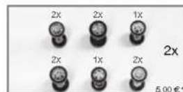
062086 PKW Sportfelgen Porsche, verchromt