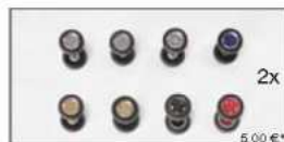
062062 PKW Sportfelgen 2-4-teilig