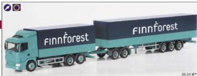
149038 Scania 124 Koffer-Hängerzug "Finnforest" Scania 124 box trailer "Finnforest"