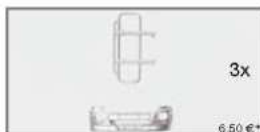
052047 Rammenschutz mit Stoßstange MB Actros L'02