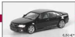
023139 Audi A8 Limousine standard