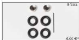
052023 Zwillingsreifen LKW Antriebsachse chrom/schwarz