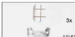
052064 Rammenschutz mit Stoßstange MB Actros LH'02