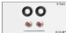
052016 Reifen für Auflieger/Hänger chrom/rot