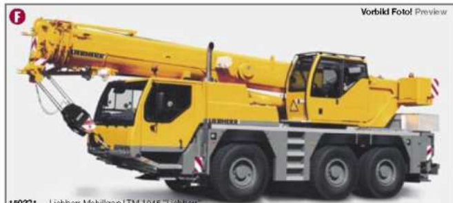
150231 Liebherr Mobilkran LTM 1045 "Liebherr" Liebherr mobile crane LTM 1045 "Liebherr"