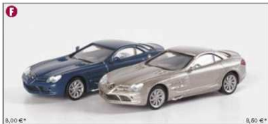
023207/033206 MB SLR McLaren standard / MB SLR McLaren metallic