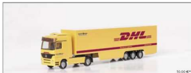
060184 MB Actros LH Koffer-Sattelzug "DHL" (1:160) MB Actros LH box semitrailer "DHL" (1:160)