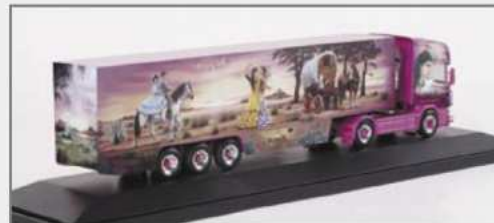
120048 Scania TL Kühlkoffer-Sattelzug "Guy Guerin" Scania TL refrigerated box semitrailer "Guy Guerin"