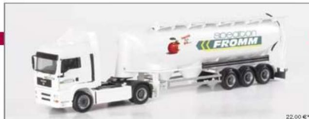
120194 MAN TGA LX Eulersilo-Sattelzug "Fromm" MAN TGA LX bulk silo semitrailer "Fromm"