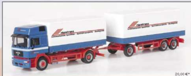
150163 MAN F 2000 EVO Planen-Hängerzug "Riwatrans" MAN F 2000 EVO canvas trailer "Riwatrans"