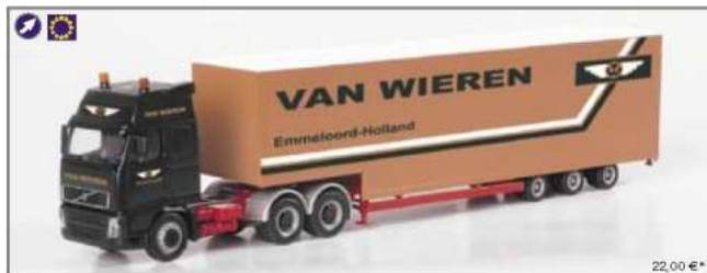
149846 Volvo FH GL Jumbo-Sattelzug "van Wieren" Volvo FH GL jumbo semitrailer "van Wieren"