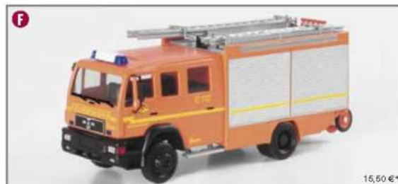
046176 MAN L 2000 LF 20/12 "Feuerwehr Hamburg"

Essen's city fire department operates several of these MB Varios as emergency rescue vehicles. The Herpa model has been completely overhauled and now includes the necessary step on the rear of the vehicle. The vehicle also features four emergency flashing lights on the roof.