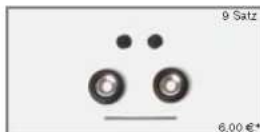
052030 Reifen für Auflieger/Hänger chrom/schwarz