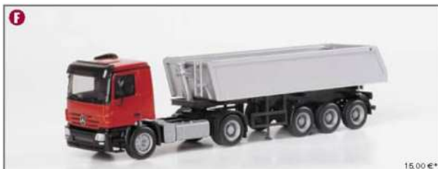
150187 MB Actros M 122 Baukipper-Sattelzug MB Actros M 122 construction site dumper semitrailer