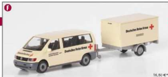
046145 MB Vito Bus mit Anhänger "DRK" MB Vito bus with trailer "DRK"