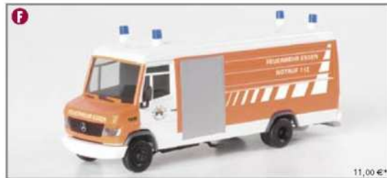
046183 MB Vario LRF "Feuerwehr Essen"