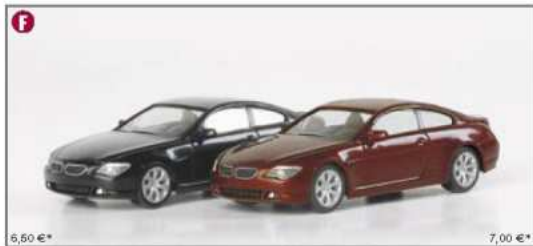
046145 MB Vito mit Geräteanhänger DRK