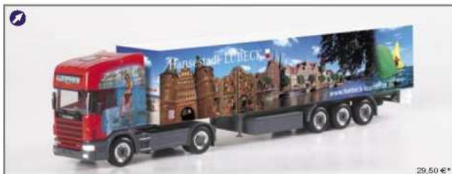
150170 Scania TL Koffer-Sattelzug "Lübeck-Truck" Scania TL box semitrailer "Lübeck-Truck"