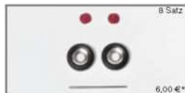
051906 Breitreifen LKW Vorderachse chrom/rot