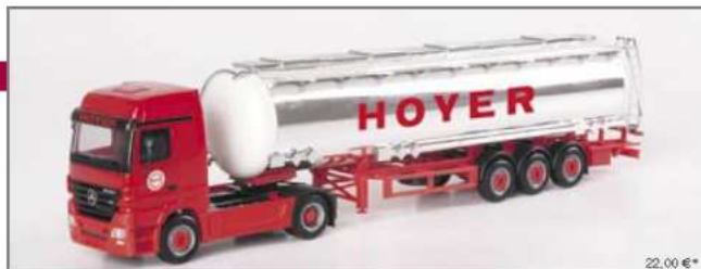
149693 MB Actros LH '02 Jumbotank-Sattelzug "Hoyer-Group" MB Actros LH '02 jumbo tank semitrailer "Hoyer-Group"