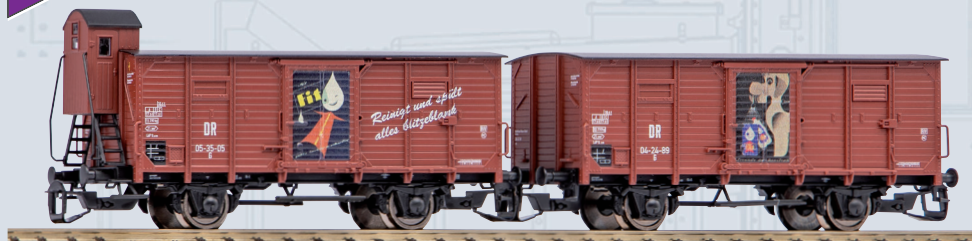
47032 2er Set Gedeckter Güterwagen G02 FIT DR Ep. III