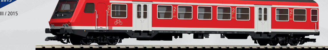
37635 Steuerwagen Bndzf479.2 Wittenberg DB AG Ep. V mit beleuchteter Zugzielanzeige 250,00 €*