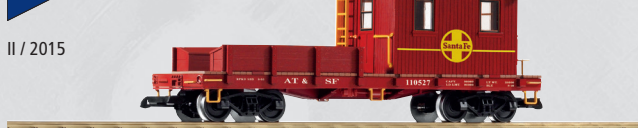
38706 Bauzugwagen SF mit Metallrädern und funktionierenden Schlusslichtern 130,00 €*