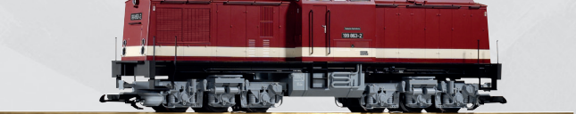
37542 Diesellok BR 199 DR Ep. IV 350,00 €*