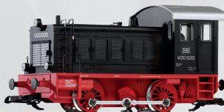
37550 Diesellok V 20 DB Ep. III 250,00 €*