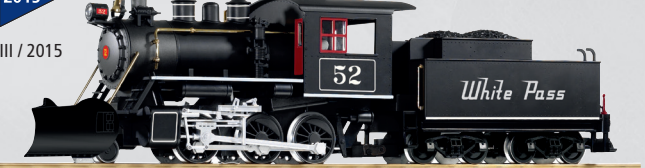
38219 Dampflokom mit Tender „Mogul“ WP&YR 400,00 €*