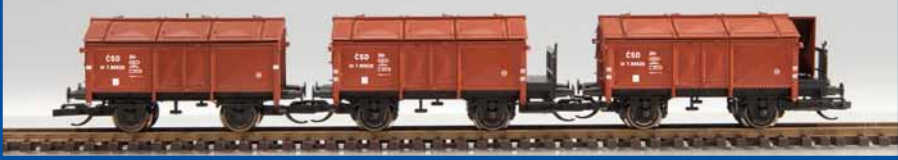
Klappdeckel-Wagenset ČSD (Epoche III) Best.-Nr. 65295 (TT) ab III/2014

Haben Sie schon unseren aktuellen "Katalog No 6"?