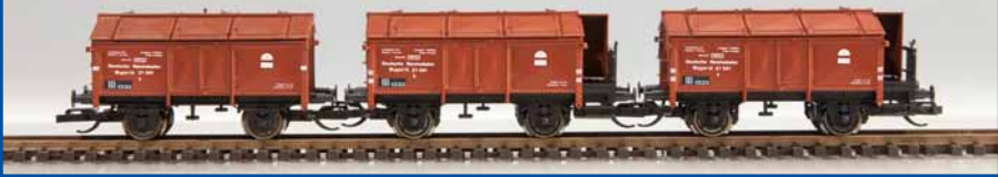
Klappdeckel-Wagenset DRG (Epoche II) Best.-Nr. 65292 (TT) ab III/2014