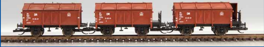
Klappdeckel-Wagenset DR (Epoche III) Best.-Nr. 65290 (TT) ab III/2014