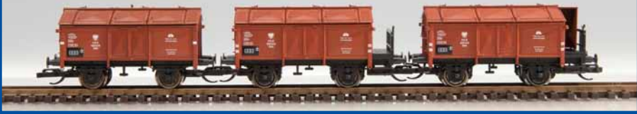
Klappdeckel-Wagenset PKP (Epoche III) Best.-Nr. 65294 (TT) ab III/2014