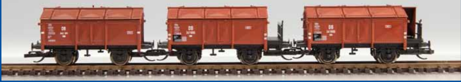
Klappdeckel-Wagenset DB (Epoche III) Best.-Nr. 65291 (TT) ab III/2014