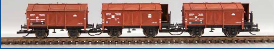
Klappdeckel-Wagenset Länderbahn (Ep. I) Best.-Nr. 65293 (TT) ab III/2014