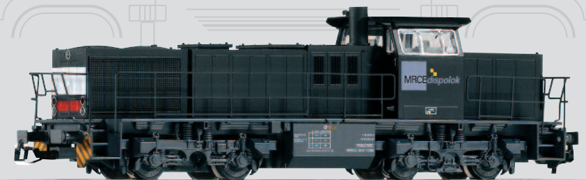
47223 Diesellok G 1206 MRCE Ep. VI