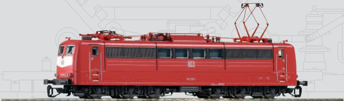
47203 E-Lok BR 151 orientrot mit Latz DB AG V mit Scheren-Stromabnehmer 69,99 €*