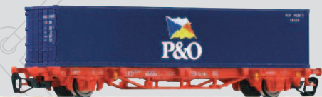
47700 Containertraggwagen Lgs579 „P&O“ DB Cargo Ep. V 19,99 €*