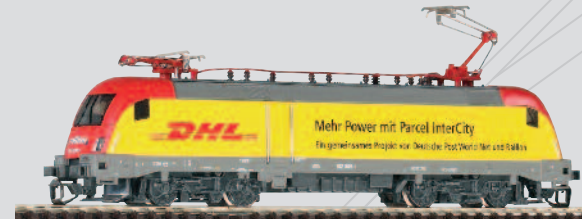
47413 E-Lok BR 182 Railion „DHL“ Ep. V 67,99 €*