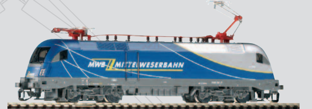
47415 E-Lok Taurus „MWB - Mittelweserbahn“ Ep. V 67,99 €*