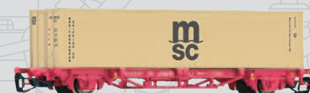
47706 Containertraggwagen Lgs579 „MSC“ NS Ep. VI 19,99 €*