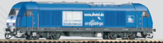
47583 Diesellok Herkules 253 014-9 „Pressnitztalbahn“ Ep. V 64,99 €*