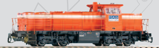
47221 Diesellok G 1206 RAG Ep. V