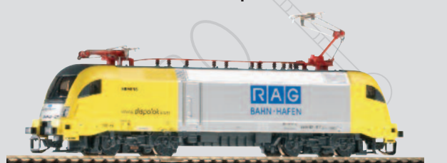
47418 E-Lok Taurus ES 64 U2-017 „RAG-Ruhrkohle AG“ Ep. V 67,99 €*