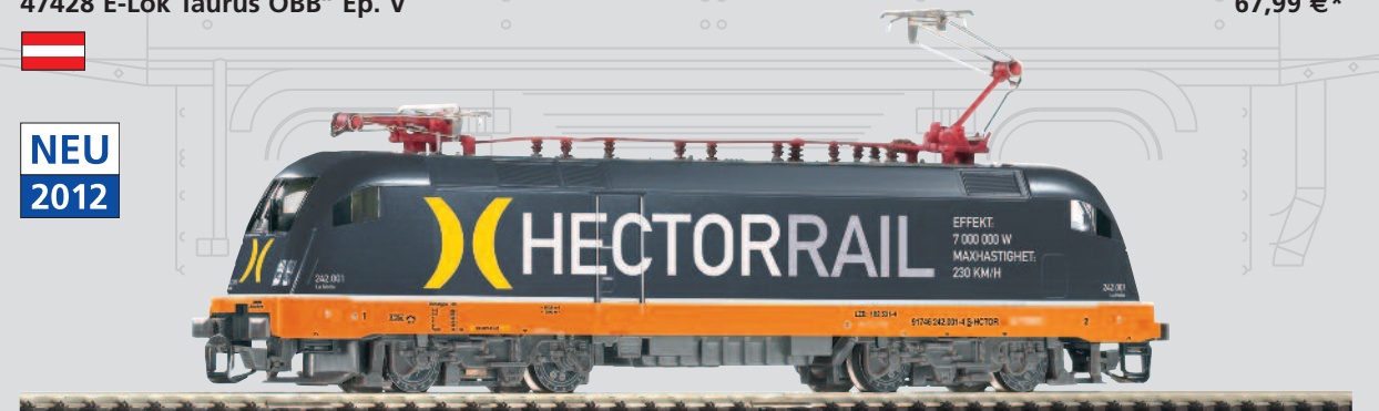
47427 E-Lok Taurus „HECTORRAIL“ Ep. VI 67,99 €*