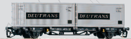
47705 Containertraggwagen Lgs579 „Deutrans“ DR Ep. IV 20,99 €*