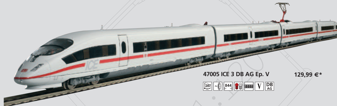
47005 ICE 3 DB AG Ep. V 129,99 €*