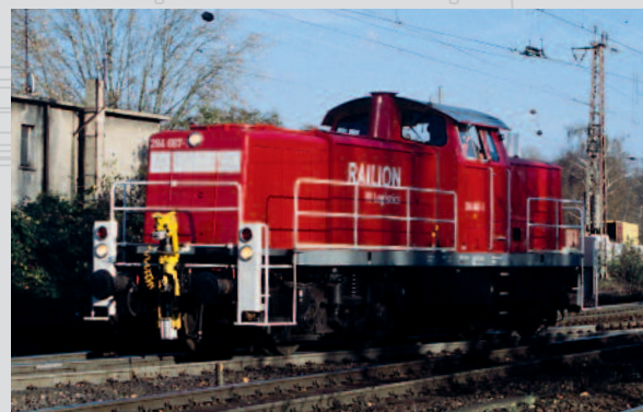
47261 Diesellok 291 Railion Logistic Ep. VI 99,99 €*