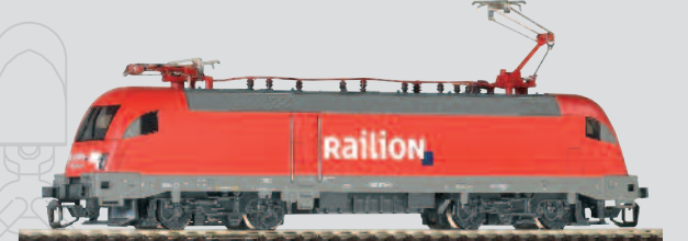
47412 E-Lok BR 182 „Railion“ Ep. V 67,99 €*