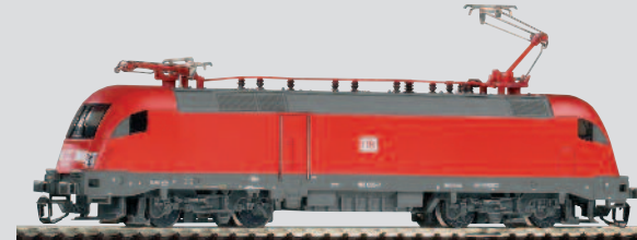
47410 E-Lok BR 182 DB AG Ep. V 67,99 €*