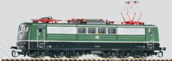
47201 E-Lok BR 151 DB Ep. IV mit Scheren-Stromabnehmer 69,99 €*