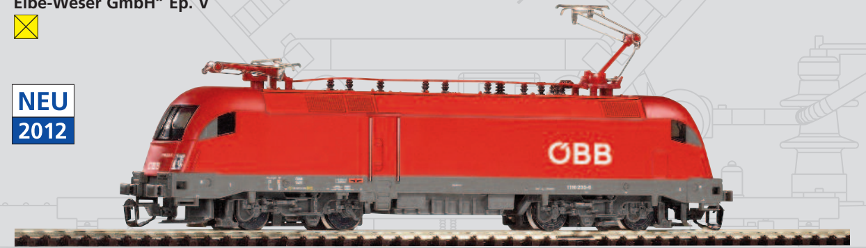
47428 E-Lok Taurus ÖBB“ Ep. V 67,99 €*