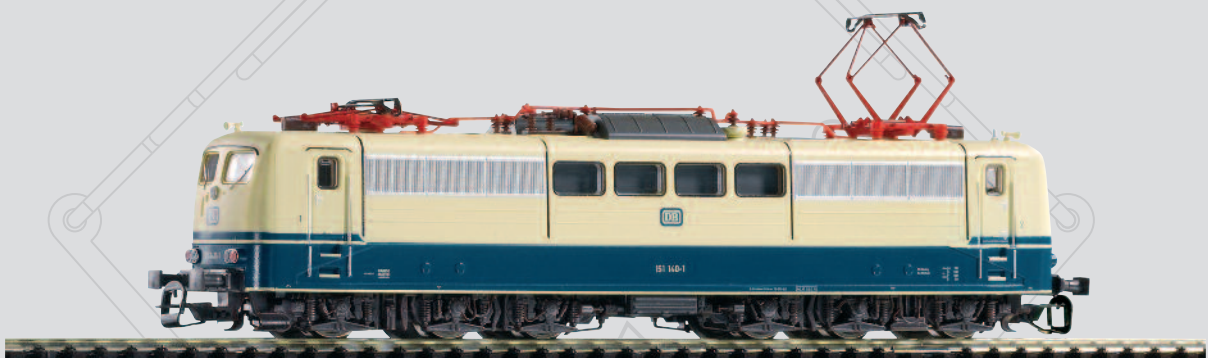
47202 E-Lok BR 151 DB Ep. IV mit Scheren-Stromabnehmer 69,99 €*