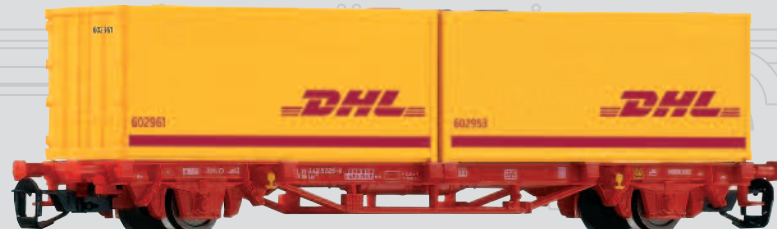
47709 Containertraggwagen Lgs579 „DHL“ DB AG Ep. VI 20,99 €*