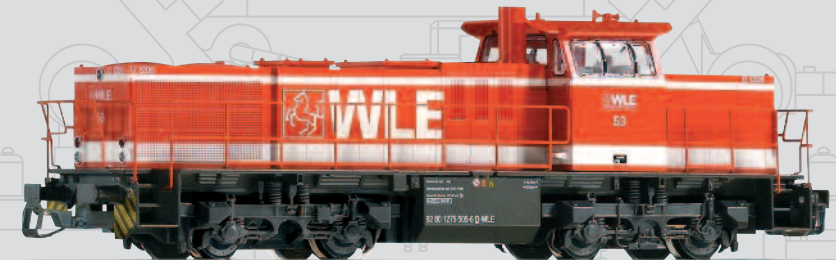
47222 Diesellok G 1206 WLE Ep. VI