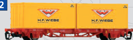
47708 Containertraggwagen Lgs579 „Wiebe“ DB AG Ep. VI 20,99 €*