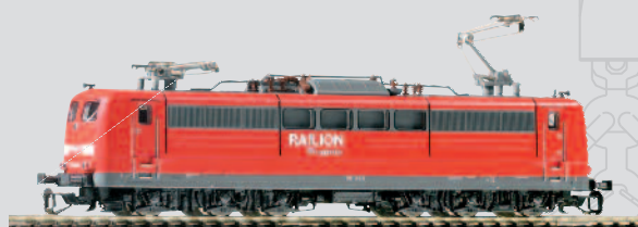
47200 E-Lok BR 151 DB AG Ep. V mit Einholm-Stromabnehmer 69,99 €*