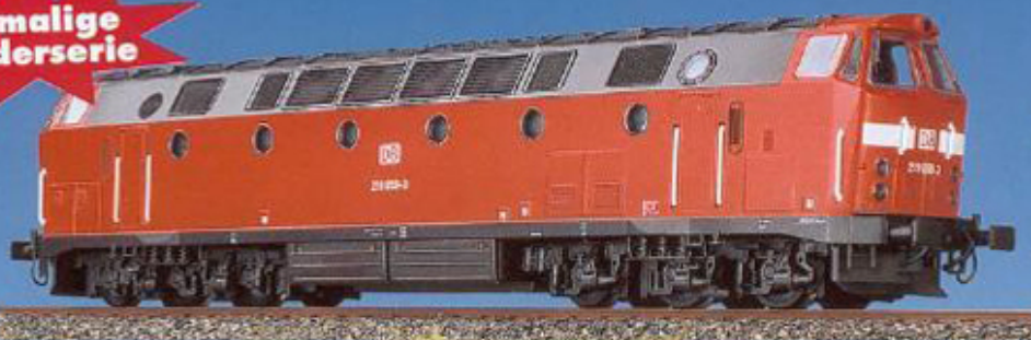
33 400 BR 219 der DBAG