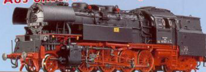
72 100 BR 65 der DR