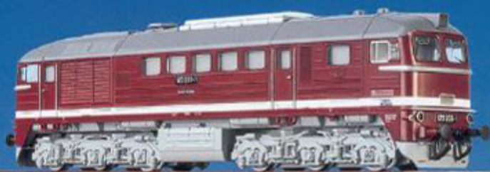
50 300 BR 120 der DR