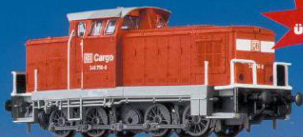
41 200 BR 346 der DBAG