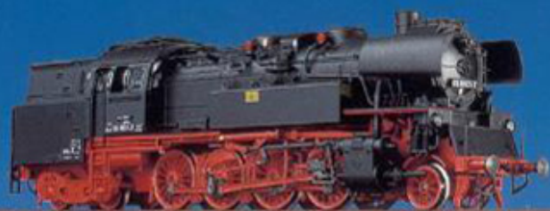
38 100 BR 65 der DR