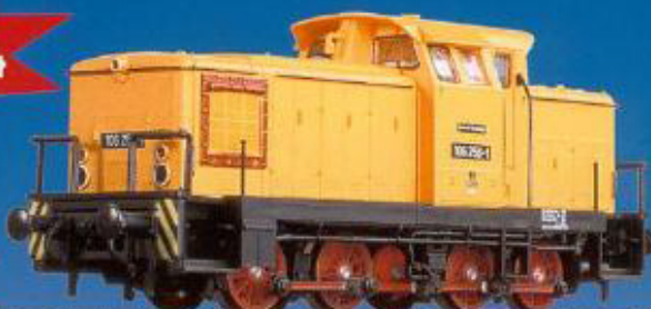
41 100 BR 106 der DR

jetzt mit Digital-Schnittstelle und NEM-Schacht