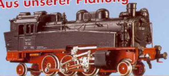
71 100 BR 75 der DR